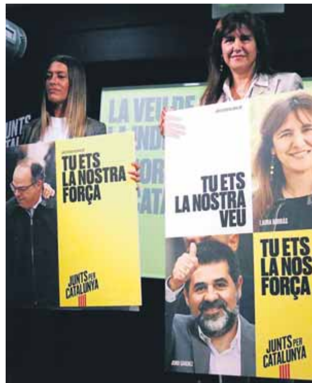
Míriam Nogueras i Laura Borràs presentant ahir els cartells electorals de JxCat

El president Carles Puigdemont –candidat a