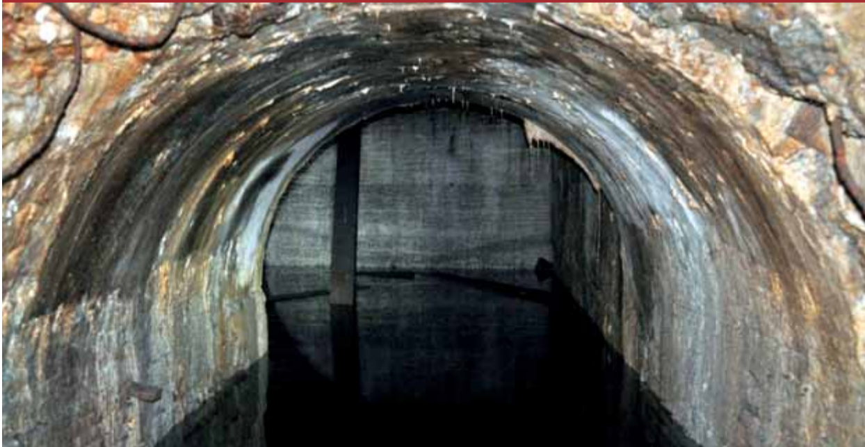
Un dels túnels abandonats descoberts de la línia entre la Rambla i el Paral·lel, que no es va arribar a fer mai ■ ICUB