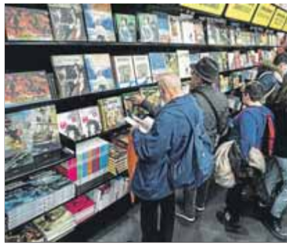
Visitants en un dels estands

L'aragonès Antonio Altarriba rep el Gran Premi de Comic Barcelona, inaugurat ahir