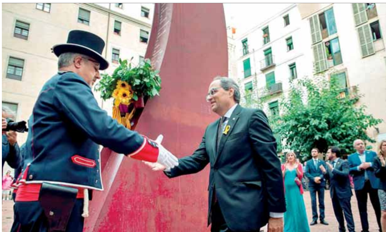
El president Quim Torra saluda un membre de la guàrdia d'honor dels Mossos, per la Diada

Si bé el president Torra no les preveu a curt termini, després que el Parlament demanés dijous la convocatòria d'eleccions, el CEO també hi augura un gran creixement d'ERC, que de tercera força amb 32 diputats passaria a primera, amb entre 40 i 43. Qui ho és ara, Cs, baixaria en canvi de 36 a entre 28 i 29, i JxCat també cauria de 34 a entre 22 i 24, i mantindria per pèls el tercer lloc. Li discutiria el PSC, que els superaria en intenció de vot i pujaria de 17 a entre 21 i 23 escons. Els comuns mantindrien els 8 que tenen ara, o en guanyarien un més; el PP continuaria enfonsat en els 3 o 4 escons que té ara, i la CUP els doblaria, de 4 a 8. La suma de forces independentistes, segons les previsions de vot, quedaria en el 49,5% (dos punts més que ara), i refermarien la majoria al Parlament amb un mínim dels 70 diputats actuals i un màxim de 75. ■