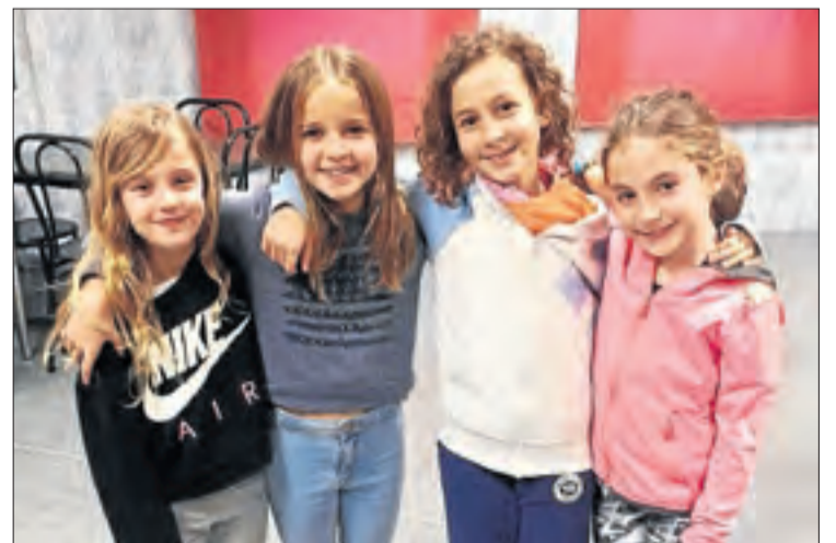
A la imatge, les quatre integrants de l'equip d'artística.