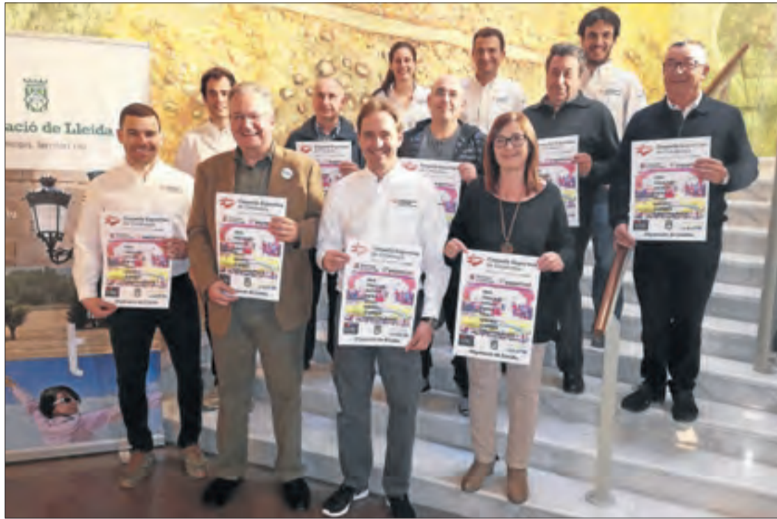
Les diferents lligues del Trofeu Diputació es van presentar ahir a l'ens provincial.

També ha iniciat la seua activitat la Lliga d'esquí alpí, que espera més de 800 participants en una competició que recalarà a Espot (24 de febrer) i Baqueira Beret (24 de març), després de disputar-se ja les proves de Boí Taüll i Cerler, que s'ha incorporat al circuit.