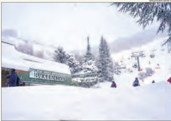
Imatge recent d'esquiadors a Baqueira.

promociona la Cerdanya", en la qual "s'ubica un càmping regentat pel demandat". D'aquesta manera, apunta que aquest tenia la intenció de "negociar la venda" d'aquests dominis en litigi a Baqueira Beret. Fonts de l'estació aranesa, per la seua banda, van corroborar que