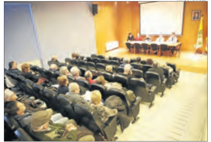
Imatge de la reunió que es va fer ahir a Alcoletge.