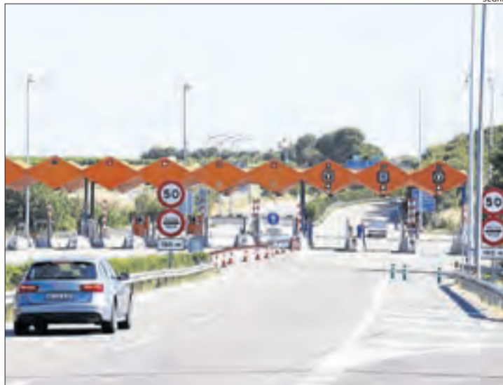
Imatge d'arxiu del peatge de l'autopista AP-2 a Lleida.