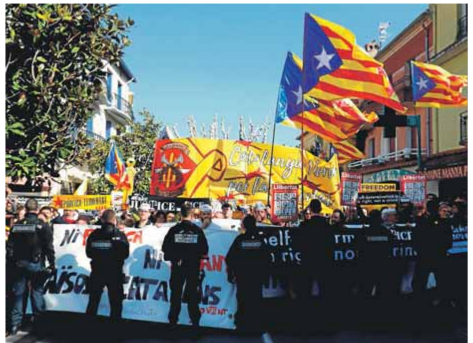
Els manifestants, ahir acordonats per la gendarmeria a prop del cementiri de Cotlliure

Amb el record a tots els exiliats, Sánchez va fer a