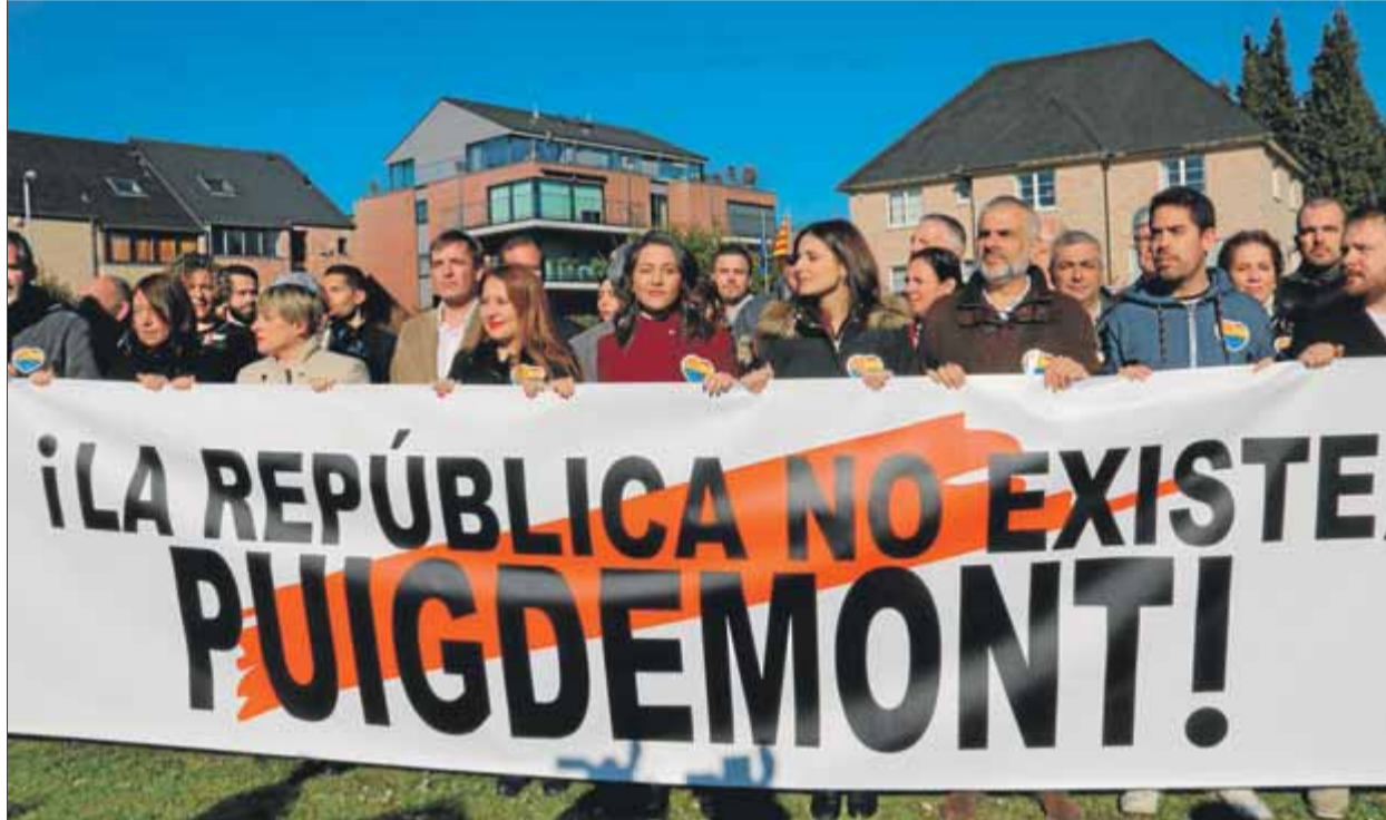
Inés Arrimadas i altres diputats i membres de Ciutadans, ahir, al jardí de davant de la Casa de la República, a Waterloo

La residència de Puigdemont va treure ahir el seu vestit de gala per rebre Arrimadas. Pancartes sobre els presos polítics, les banderes institucionals i un llaç groc provocativament enganxat a la porta d'entrada. Però Arrimadas no va picar i va escenificar una protesta exprés a l'esplanada del davant que