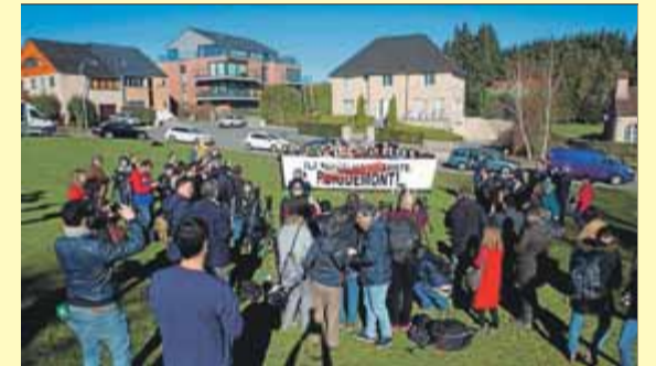
Ciutadans a Waterloo, només amb periodistes