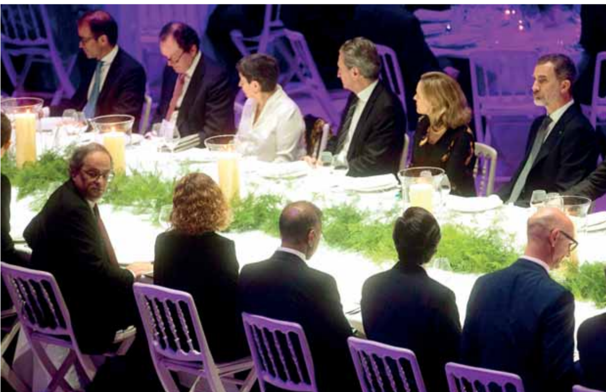
El president de la Generalitat, Quim Torra, i Felip de Borbó, amb la resta d'autoritats, ahir en el sopar

PROTESTA • Un miler de persones responen a la crida dels CDR per protestar contra la visita del monarca espanyol