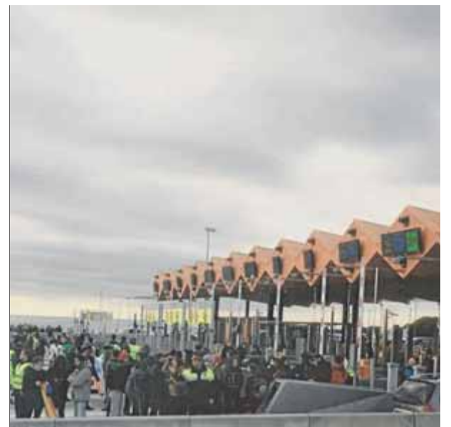
Autopista C-32 , tallada durant la vaga general del 8 de novembre del 2017

Hem debatut la qüestió amb els òrgans del sindicat. Hi donem suport i també farem convocatòria i ens hi implicarem. Som conscients que moltes vagues seguides afecten l'economia de la gent. No demanem barricades ni assaltar el Palau d'Hivern, però sí implicació. Si volem aconseguir coses, calen sacrificis. ■