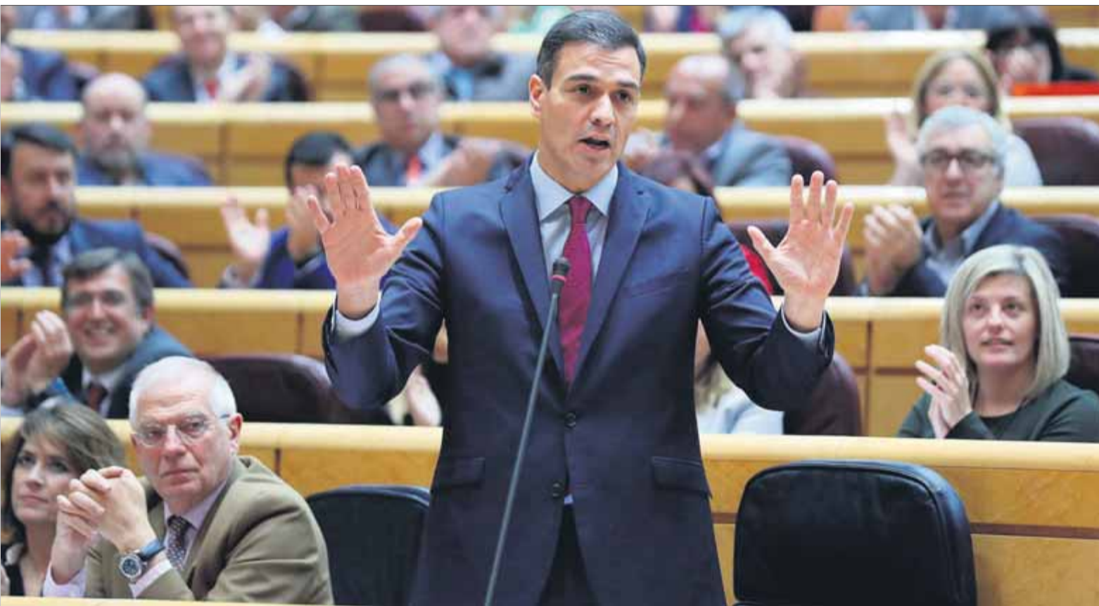
Sánchez responia ahir al senador d'ERC Joaquim Ayats en la sessió de control a l'executiu celebrada al Senat