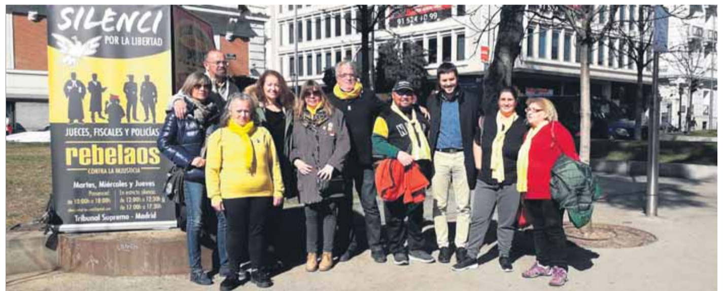
Una de les concentracions del col·lectiu Silenci, Rebel·leu-vos, a tocar del Tribunal Suprem de Madrid