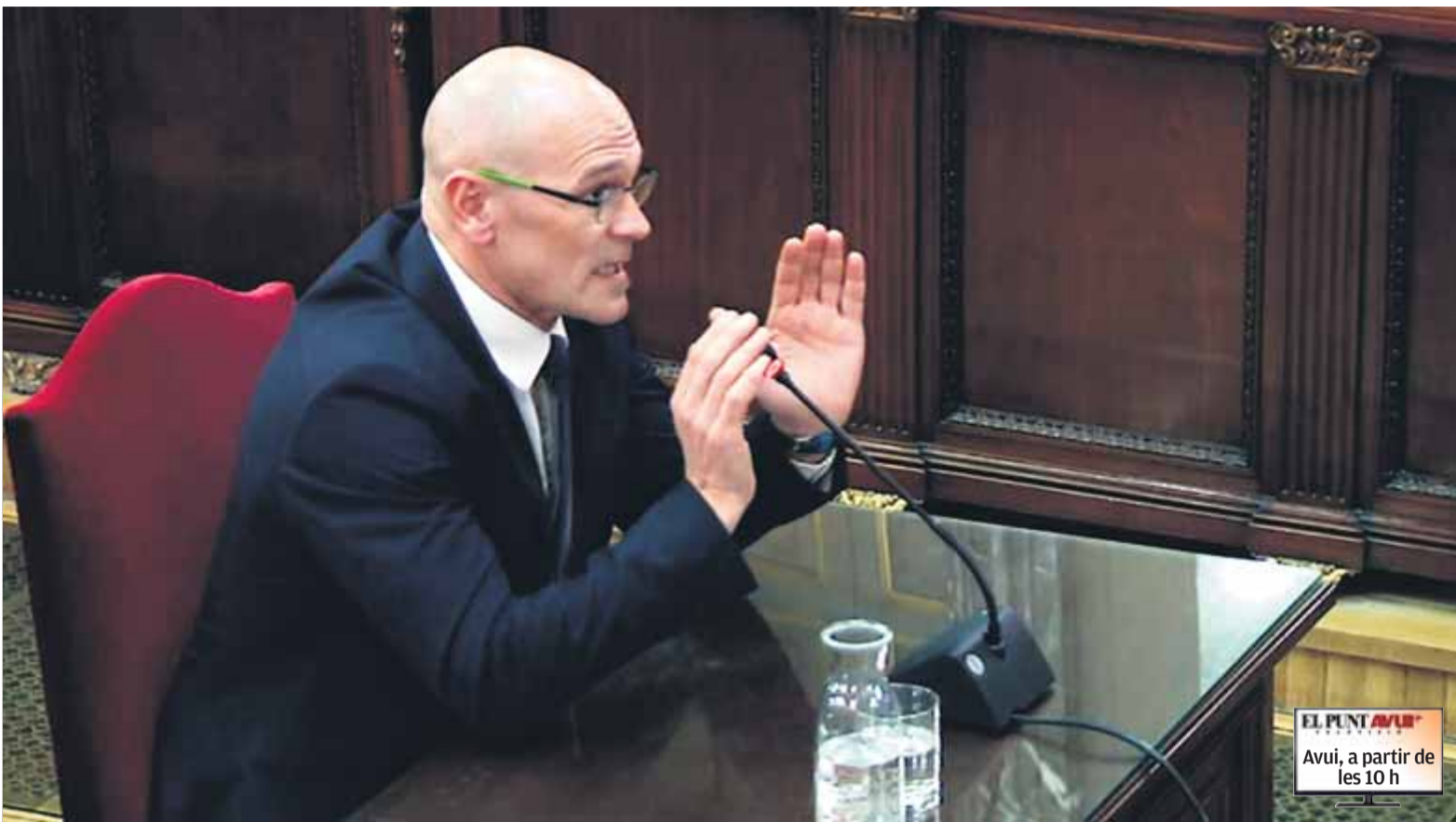
L'exconseller d'Afers Exteriors Raül Romeva, declarant ahir al Tribunal Suprem