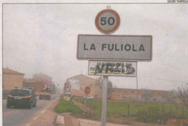
Una de les pintades a l'entrada de la població.