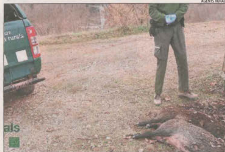
Imatge dels dos animals recollits pels Rurals.