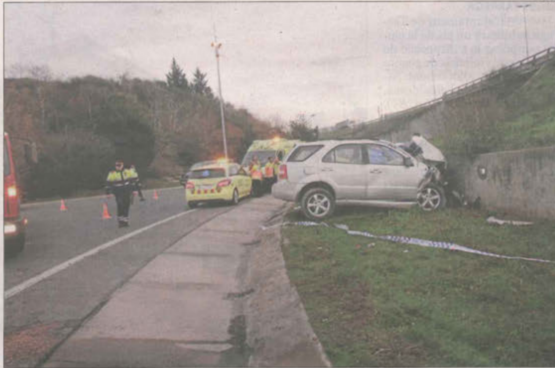
L'últim accident mortal a Lleida es va produir el passat 21 a la carretera LI-11.

Del total d'accidents, cinc han estat múltiples. A l'abril, un matrimoni de Sant Esteve de la Sarga va morir al ser sepultat per una allau de roques a Castell de Mur. Tres persones van morir al maig en una col·lisió frontal entre una furgoneta i un turisme a la C-12 a Llardecans.