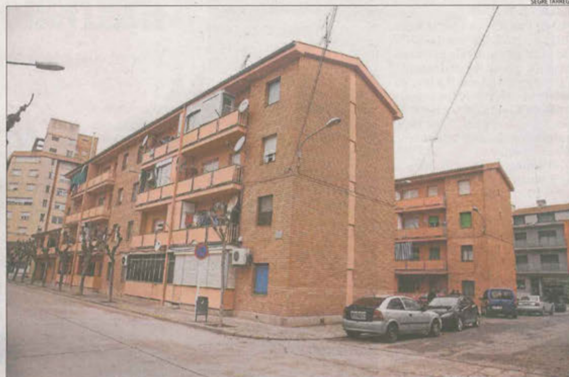
Les dos vivendes per a casos d'emergència social formen part dels Habitatges de la Plana.

L'ajuntament de Tàrrrega està especialment sensibilitzat contra la violència de les dones des del 2013, quan va ser assassinada una adolescent de 14 anys de la ciutat en mans de la seua exparella. Des d'aleshores, el consistori prepara cada any activitats de sensibilització amb motiu del Dia Internacional de l'Eliminació de la Violència contra la Dona, que se celebra el 25 de novembre. Per la seua part, el servei d'informació i atenció a la dona (SIAD) del consell de l'Urgell va atendre el 2017 tretze dones que havien patit violència de gènere: deu per agressions físiques, dos per maltractament psicològic i una dona d'una altra comarca a què