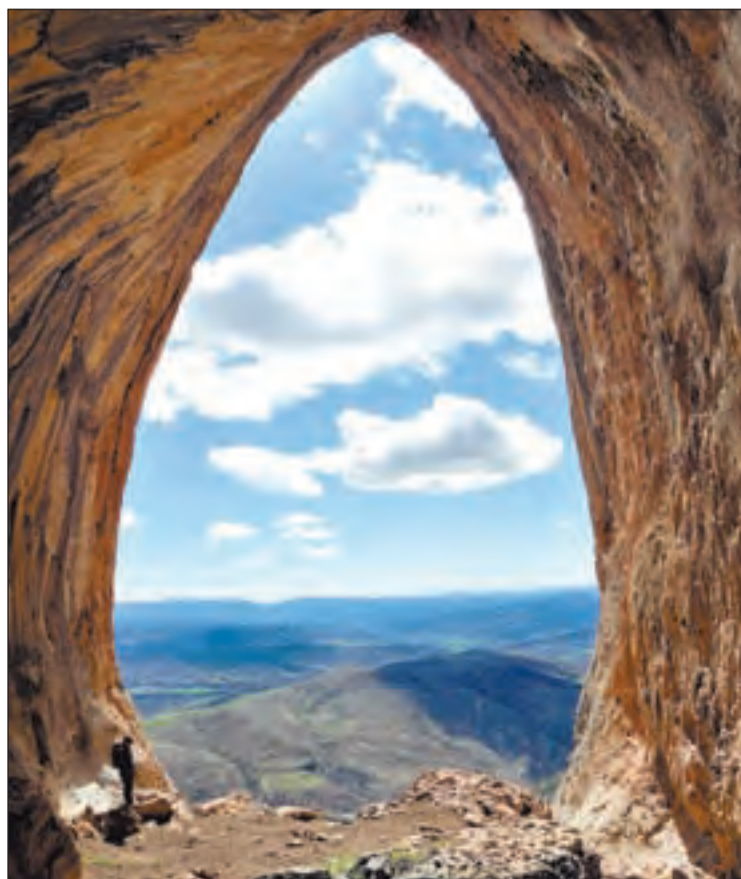
L'impressionant boca de la Cova del Sanat

"Aprofitar l'extraordinari patrimoni natural que tenim a la nostra província". Així expressa l'autor el principal objectiu del llibre, una guia amb acurada informació de 36 coves lleidatanes —de les més de 800 inventariades—, tant del material necessari per visitar-la i la seva dificultat com de característiques geològiques o de precises coordenades que permeten al visitant arribar sense problemes a la cova, a més de la descripció del recorregut recomanat, les topografies de les coves i les fotografies més representatives de la cavitat.