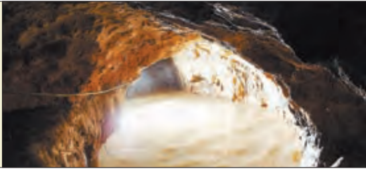
Cova de la Font d'Andana