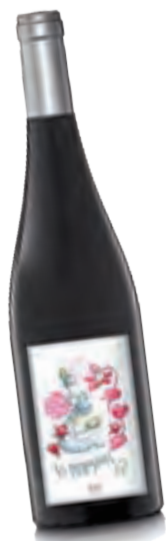
El Microscopi 2017.