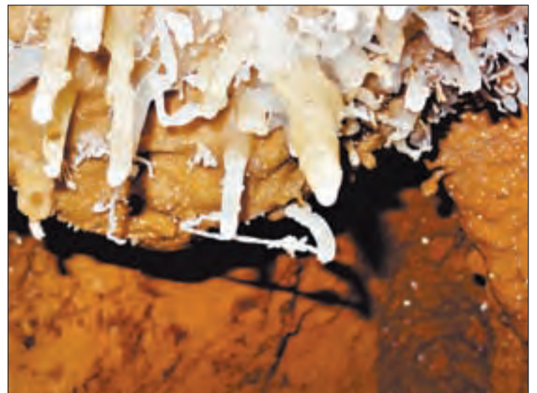
Detall de la Cova de la Fou de Bor

Malgrat això, el Centre Excursionista de Lleida continua dinamitzant la ciutat amb contínues sortides, marxas o el Premi de Fotografia Òscar Ribes, seguint la tradició del concurs fotogràfic, que va començar el 1924. També publica, encara que amb menys freqüència que abans, la revista Grallera. Així, el Centre continua molt viu, com demostra la reeixida organització de l’assemblea general extraordinària de la Federació d’Entitats Excursionistes de Catalunya (FEEC) celebrada el passat 24 de novembre, en la qual va fer d’amfitrió.