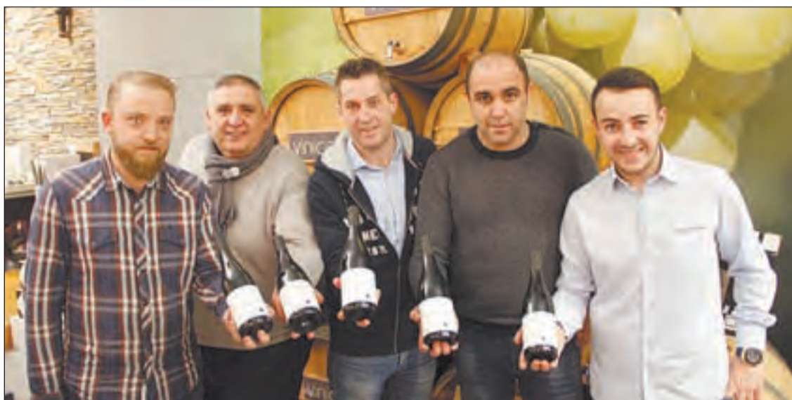
Como Pomona / Representants de Gra de Sorra amb membres de l'equip de Casa Badio i Vinicia.

A Vinicia, Afanoc Lleida i els cellers participants