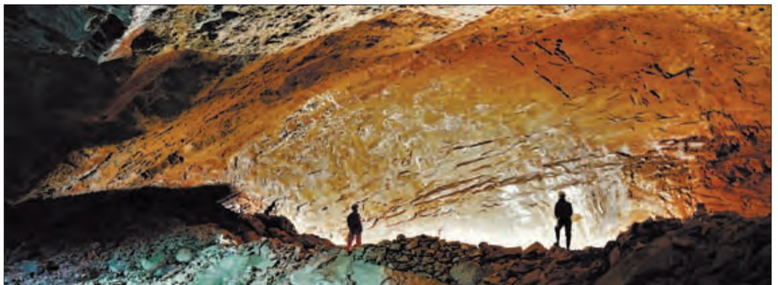
Espectacular imatge del Forat del Gel, situat a Llimiana, al Pallars Jussà

des de fa 30 anys i fa gairebé dos que n’és el president. L’entitat, com a la resta de Catalunya, no té la mateixa activitat que en anteriors èpoques. “Tenim un problema i és que, deixant de banda els escaladors, que sí són joves i fan molta activitat, per la resta estem quedant només amb gent gran”, explica. Les raons són múltiples, però sobretot la crisi econòmica, que va fer “que molts socis joves es donessin de baixa”.