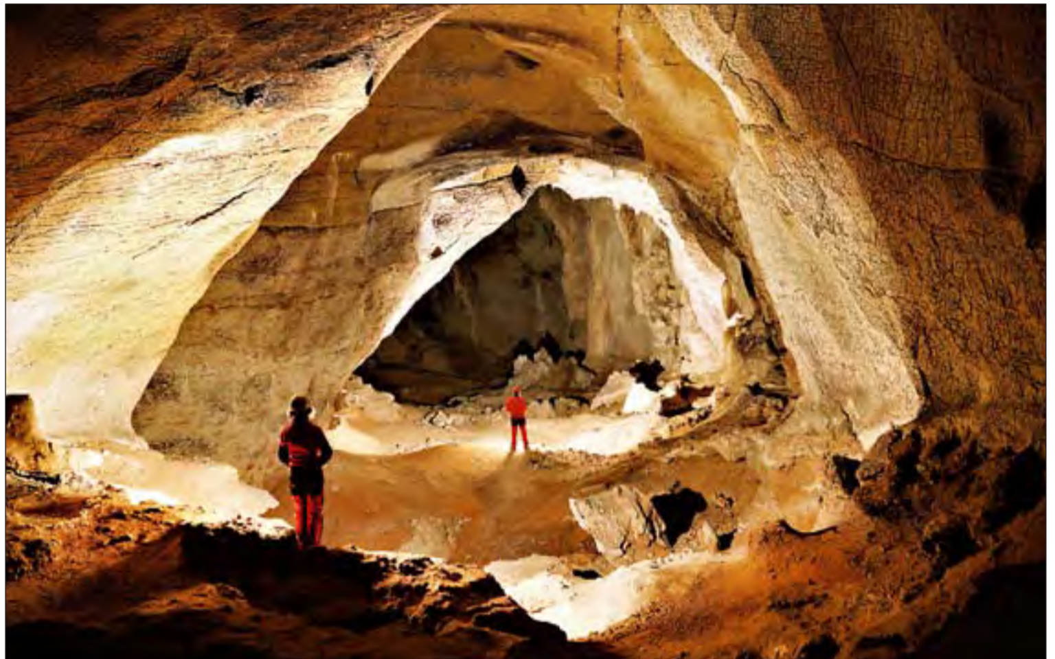
La Cova del Tabac, una de les més conegudes de la província, està a Camarasa