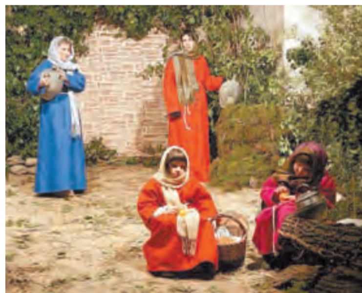
La representació, en una edició anterior