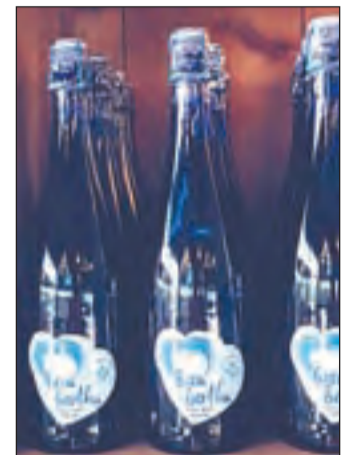
Cava Solidari Bertha.

El projecte porta per títol "Disseny, implementació i efectivitat d'un programa de suport a cuidadors i cuidadores de persones amb demència a la ciutat d'Amposta: Escola de Cuidar" i ha estat seleccionat pel Consell de Col·legis d'Infermeres i Infermers de Catalunya per rebre la Beca Bertha 2018, una aposta del Consell per impulsar la recerca infermera amb impacte social finançat per la venda del Cava Solidari Bertha.