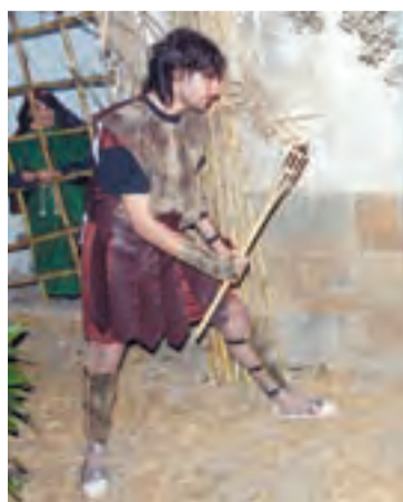
Les diferents escenes que es poden veure