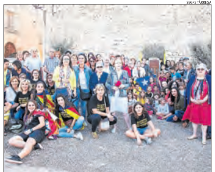
Belianes. El municipi va estrenar també la plaça 1 d'Octubre.