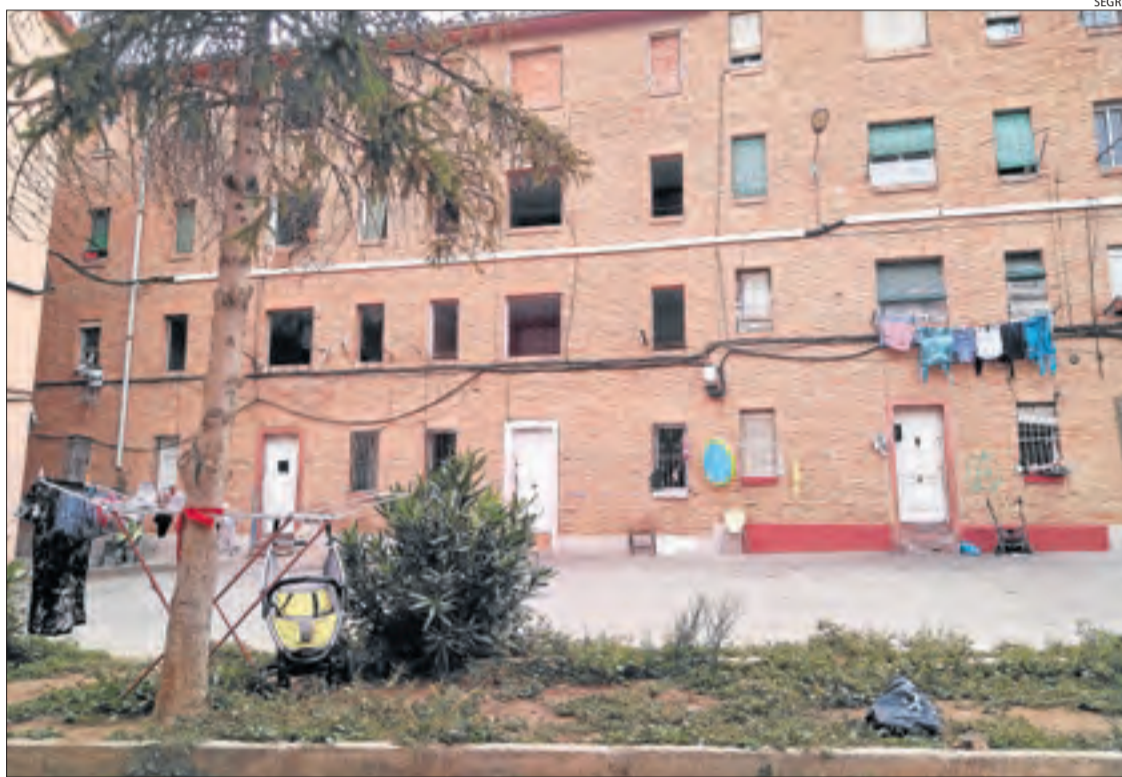
Els blocs Ramiro Ledesma, a la Mariola, tenen més de dos-cents pisos buits.

La Generalitat de Catalunya va crear aquest impost l'any 2015 i està destinat només a grans tenidors i bancs que acumulen habitatges desocupats