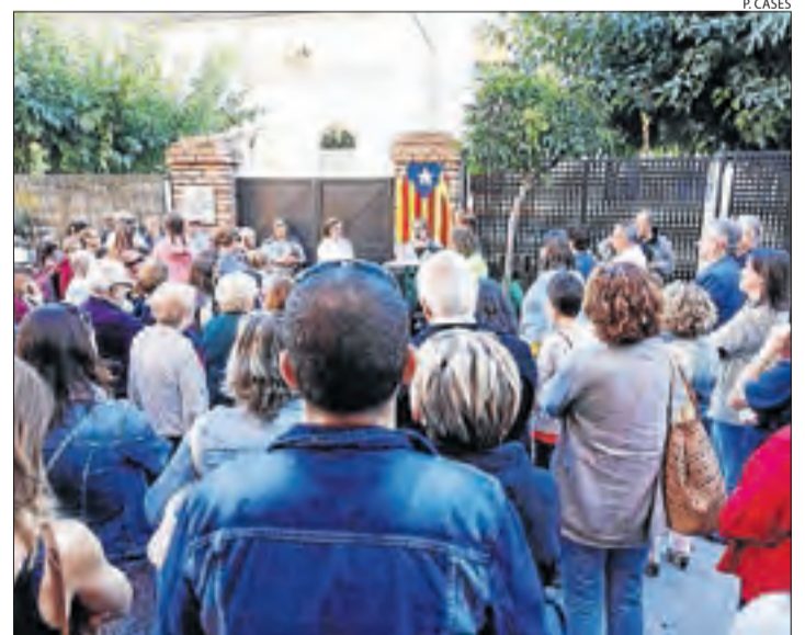
Tremp. A la capital del Jussà van destapar una placa commemorativa.