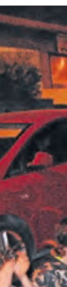
Vielha. Veïns d'Aran van fer peticions al Govern i al Conselh.