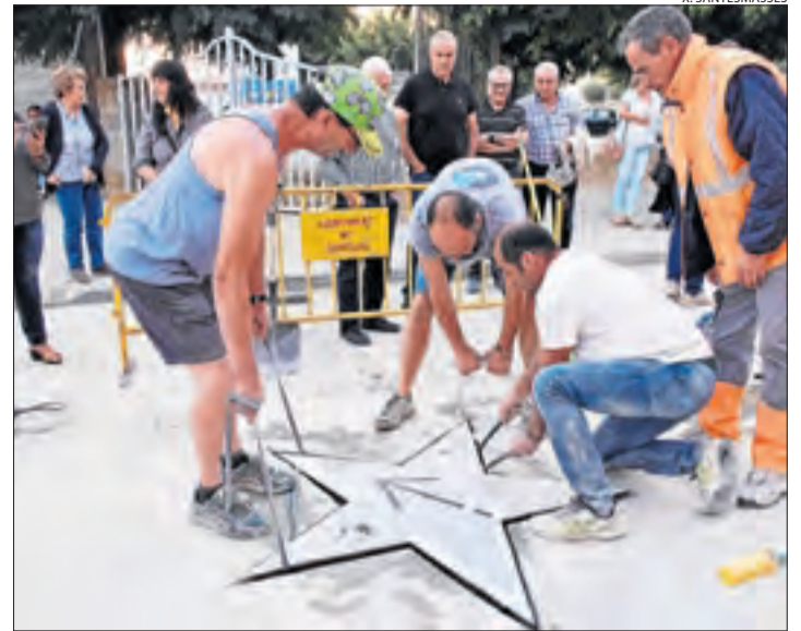
Sanaüja. Van destapar una placa commemorativa de l'1 d'Octubre.