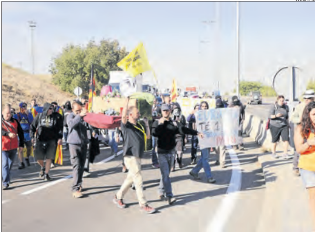
Els activistes, caminant per l'LI-11 ahir a mig matí.