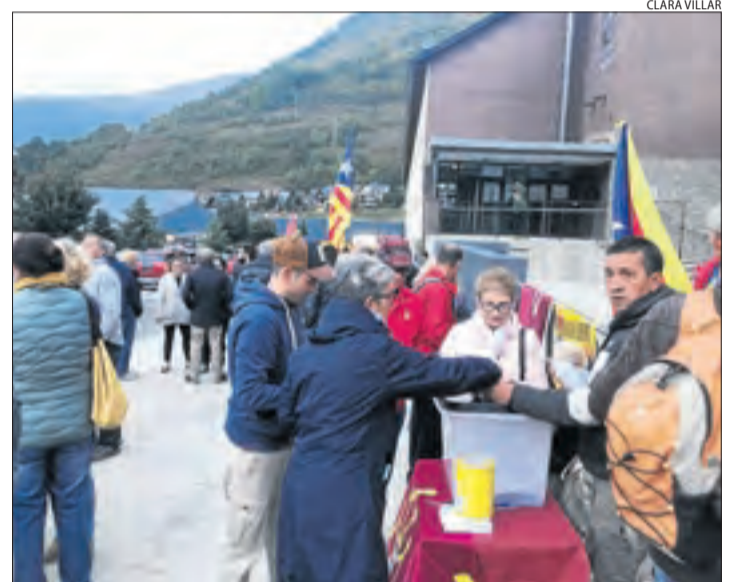
Vielha. Veïns d'Aran van fer peticions al Govern i al Conselh.