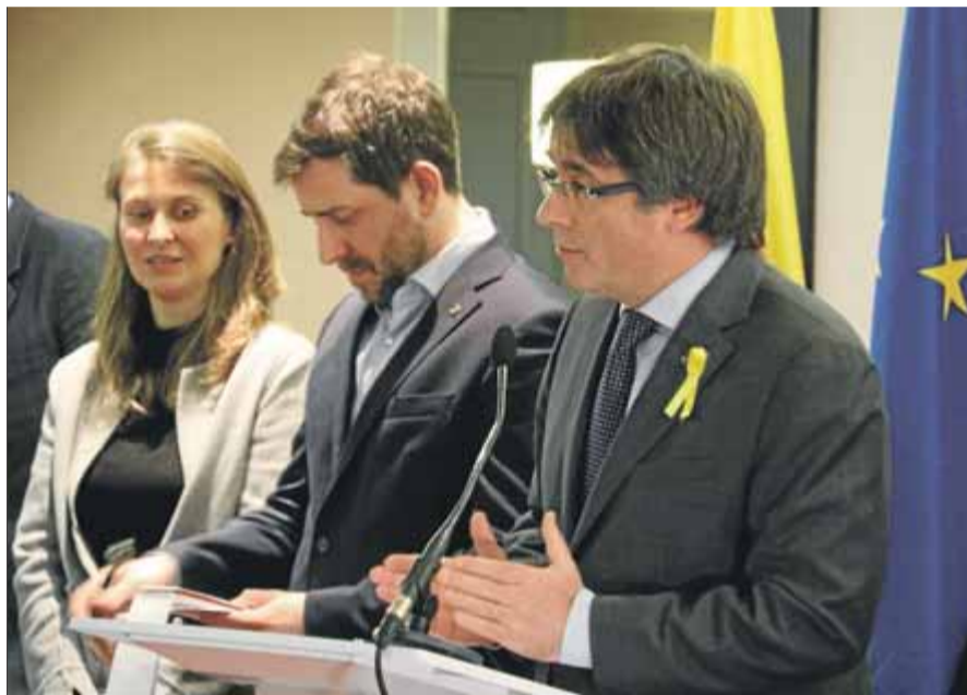
Puigdemont, Serret i Comín, a l'exili, reclamant la llibertat dels companys presos

Tots nou empresonats i altres nou líders independentistes en llibertat (exconsellers, membres de la