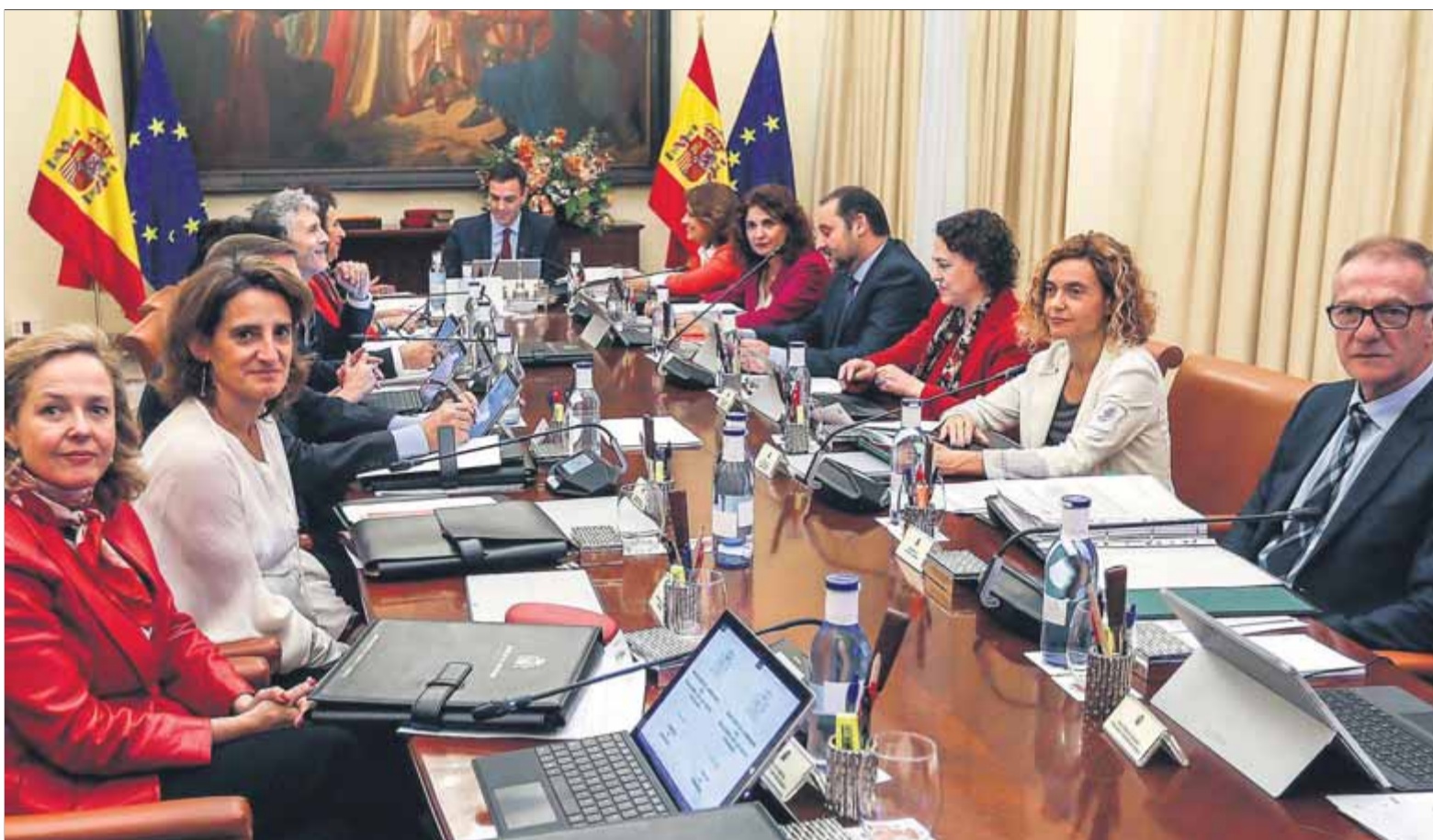
El Consell de Ministres, que ahir es va fer extraordinàriament a Sevilla, va aprovar el recurs al TC contra la reprovació del Parlament a Felip VI