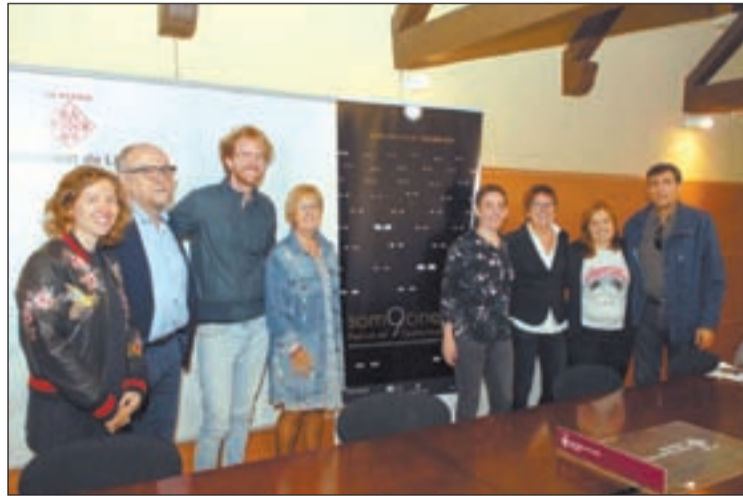
amb l'equip del Festival Som Cinema