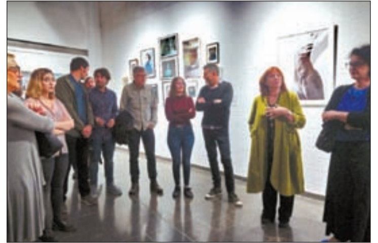
Foto de família amb tots els participants