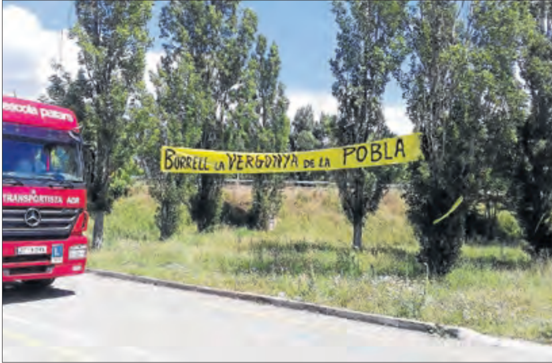
Imatge d'arxiu d'una pancarta a la Pobla contra Josep Borrell el mes de juny passat.