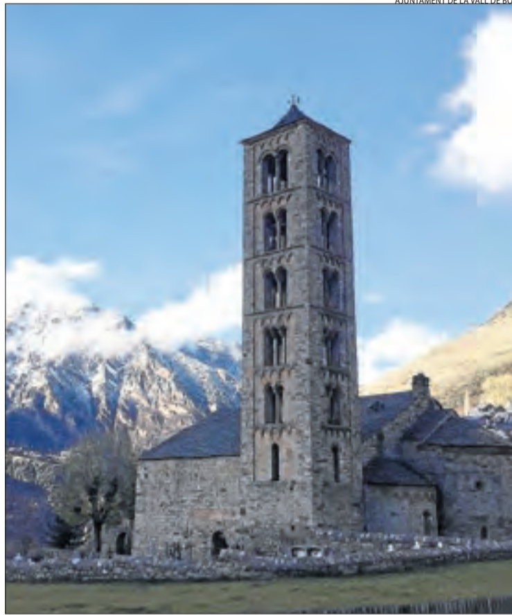
Les 9 esglésies romàniques de la Vall de Boí van repicar les campanes.

El primer edil va assenyalar que els accessos als nuclis del municipi estan en condicions, però van respondre a la crida