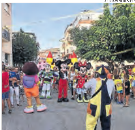
Cercavila de personatges de fantasia a Soses.