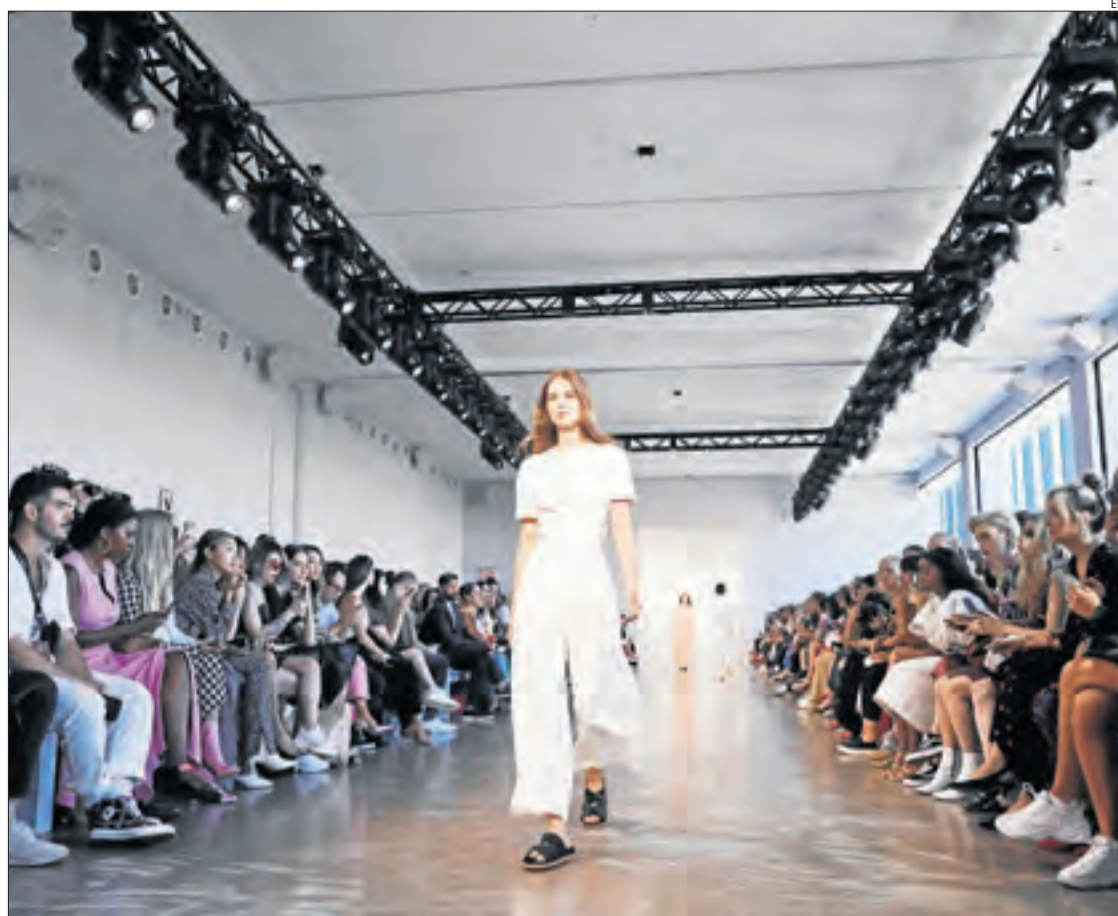
Una model llueix peces de Noon By Noor durant la desfilada a Nova York.

Fins a 24 esportistes del Club Esportiu l'Estel de Balaguer participaran als Jocs Special Olympics a la Seu d'Urgell i Andorra la Vella en les disciplines de bàsquet, petanca, natació i gimnàstica rítmica.