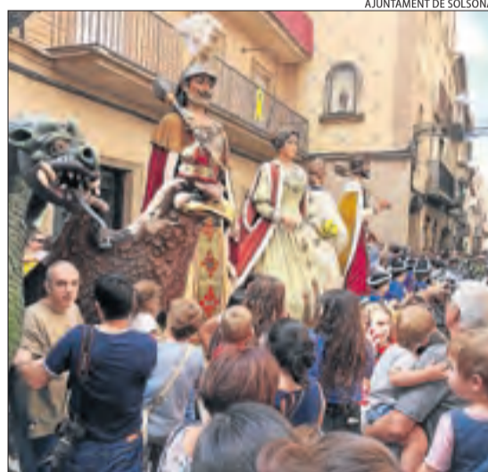
Els gegants de Solsona durant la festa.