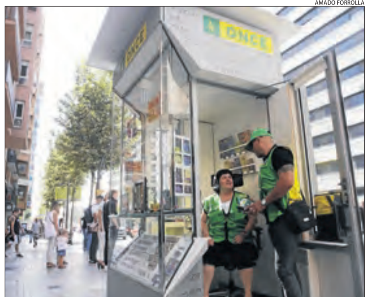
El nou quiosc de l'ONCE es localitza a l'avinguda Catalunya.

| LLEIDA | L'ONCE va presentar ahir el primer dels nous quioscos a l'avinguda Catalunya de Lleida. Es tracta d'un model més accessible per als venedors amb discapacitat que facilita la comunicació amb el públic. A més, disposa d'un espai per als gossos guia. Una altra novetat són les armilles que portaran els venedors. El regidor de la Paeria Xavier Rodamilans va assistir a l'acte.