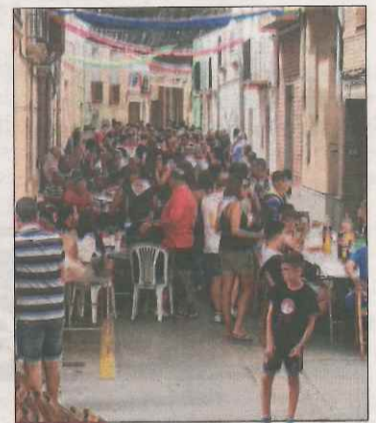
La festa de les cassoles preveu reunir un miler de comensals, repartits entre el carrer i cases.

Cultura, música, esports i tradicions són els vímets amb què Soses basteix la festa que arranca avui amb la processó. Com a estandards, l'obra Bona gent de Quim Masferrer, el so a les penyes de Virus o Hey! Pachucos o els balls al compàs de la Selvatana, Nueva Etapa, Pasarela o Junior's. Apel·lant el joc, un rocòdrom, Festa Holi, el tobogan o l'Humor Amarillo Xtreme Time. Quant a l'esport, mobilitza al reclam del tir, pedalada, pesca o futbol. I, convocant tothom, la festa de les cassoles, capaç d'aplegar uns 1.000 participants. Tot és de franc, tret del tobogan.