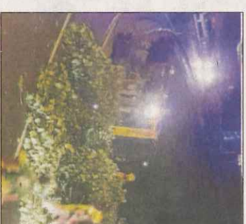
Incident a Salardú.