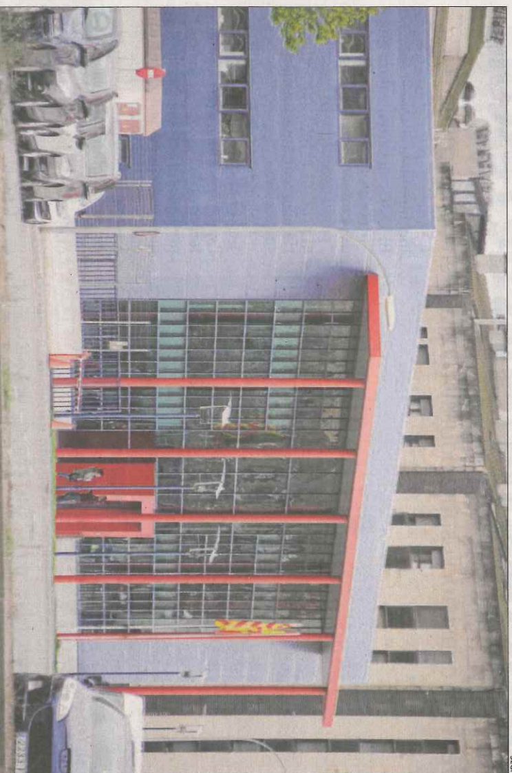
Vista de la comissaria dels Mossos d'Esquadra a Lleida.

LLEIDA | El Jutjat d'Instrucció número 4 de Lleida ha citat recentment a declarar almenys una vintena d'agents dels Mossos d'Esquadra de la regió de Ponent en qualitat de testimonis en la causa de desobediència per l'1-0. Aquests mossos, que formarien part del dispositiu policial que es va desplegar a Lleida durant la jornada de votació del referèndum, hauran de prestar declaració davant del jutge el proper mes d'octubre. Segons van apuntar des de la Unió Sindical de la Policia Autònoma de Catalunya, "els agents hauran d'explicar el que hi ha relata a les actes d'aquella jornada encara que, al capdavant, nosaltres sempre seguim les ordres dels responsables de l'operatiu". La Guàrdia Civil ja va escorcollar el passat 19 d'octubre, per ordre del jutjat, la comissaria dels Mossos a Lleida per accedir als registraments de la centralita durant l'1-0. Així mateix, va demanar bolcar la informació de tres telèfons mòbils, dos dels quals de dos alts càrrecs dels Mossos i el tercer, d'un agent. En aquest sentit, el jutge va dir que els agents lleidatans "no només van tenir una deliberada actitud passiva, sinó també una actitud proactiva afavoridora de la realització de la consulta". L'Au-