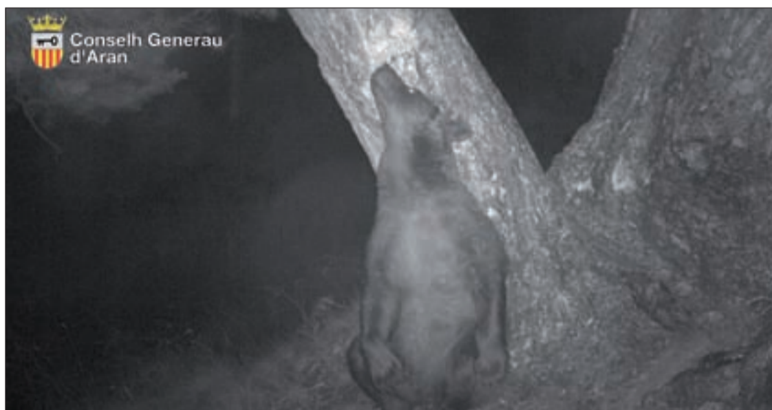
Imatge de l'ossa de les càmeres de 'fototrampeig' properes a la zona

La inquietant situació començava a les 11 hores quan un grup de 4 excursionistes francesos van alertar sobre la desaparició d'un d'ells, de 22 anys. La causa de la desaparició va ser la topada del noi amb una ossa amb tres cadells que, després de breus moments cara a cara a menys de 10 metres de l'ossa, va causar la fugida del noi. Segons l'excursionista, l'ossa va mantenir una actitud defensiva fins que les cries van estar prou lluny i ella els va seguir. Així, l'animal no va mostrar agressivitat ni va atacar el noi però es va mantenir ferma davant els gestos i els crits del noi fins que les cries es van allunyar. El noi va escapar de l'indret corrent muntanya amunt i per aquest motiu els seus companys, entre ells el pare i un germà, van avisar al 112 i un helicòpter dels Pompiers d'Aran va rescatar al jove sa i estalvi.