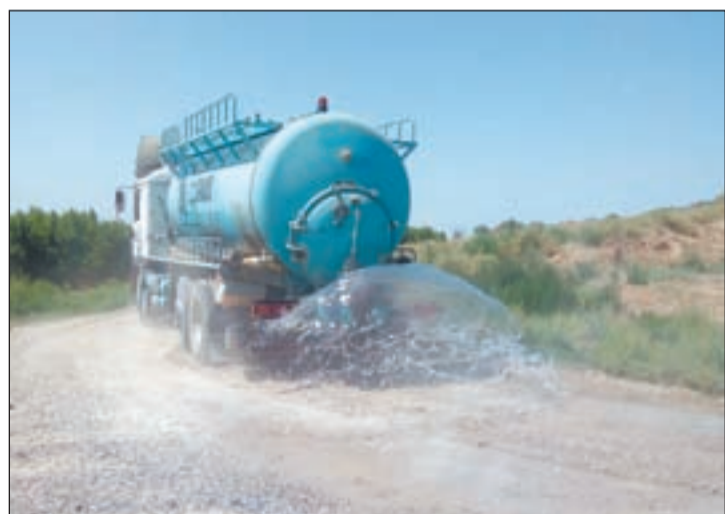
Un camió treballant en les millores dels camins

per un helicòpter. Posteriorment va ser traslladat en ambulància a l'Hospital de la Val d'Aran. L'altre muntanyenc no presentava ferides. Per altra banda, un helicòpter amb membres dels GRAE de Bombers va rescatar una nena que tenia problemes de respiració a Guingueta d'Àneu, concretament a l'Estany de la Gola.