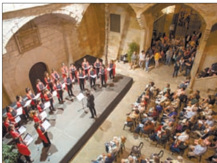
Un concert de l'edició de l'any passat