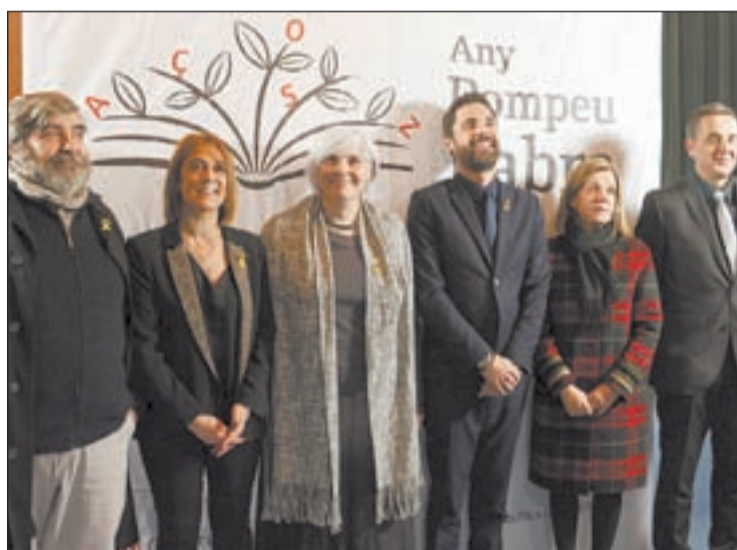
Acte inaugural de l'Any Fabra, a Badalona

En aquest marc, la Direcció General de Política Lingüística, ha publicat també 3 quaderns de passatemp que tenen com a tema la vida i l'obra de Pompeu Fabra. D'aquesta manera, a través de cercadors de paraules, mots encruats, sopes de lletres o jocs del penjat, es fa un apropament més lúdic a la figura de Fabra. Segons diuen des del departament, aquesta proposta, més lúdica, es