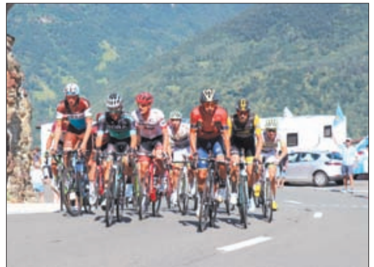
El pas del Tour de França per la Val d'Aran

Durant el mes de juliol la Val d'Aran ha acollit també d'altres proves esportives de primer nivell com són la segona edició de la Trail Vielha-Molières 3010 que va