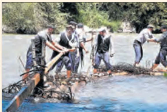
Els raiers baixen per la Noguera Pallaresa.

Els raiers tornen a solcar el riu Noguera Pallaresa en el tram de 6 km que discorre entre la presa de Llanía i el Pont del Claverol. Allà els esperaran centenars de persones, que decebran amb ells la 40 edició d'aquesta festa que rememora un dels oficis tradicionals del Pirineu: aprofitar l'avinguda dels rius pel desglaç per traslladar per via fluvial els troncs tallats als cims. Al migdia se celebra un dinar popular, que clausurarà la XL Diada dels Raiers. També hi haurà Bus Rai.