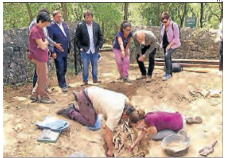
El documental segueix l'equip que obre les fosses de la Guerra Civil.

A les 22.05, TV3 estrena el documental La guerra inacabada , que aborda l'obertura de les fosses de la Guerra Civil i la postguerra. A Catalunya hi ha 5.063 famílies que reclamen a un parent desaparegut. Des del 1999 i fins a l'any passat només se n'havien identificat 7. Per revertir la situació, l'estiu passat, la Generalitat va emprendre un pla d'excavació de les fosses a Catalunya, i va crear el programa d'Identificació Genètica, amb un banc d'ADN que permet crear les dades familiars amb