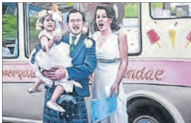
Obra de J. Ll. Jardí a la galeria Terraferma. Lleida.