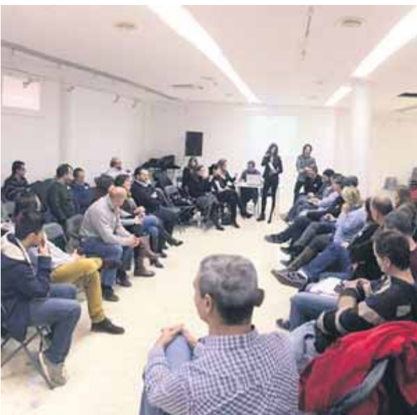
Acte de Generació Llibertat a Sallent l'any 2016 previ al congrés de CDC