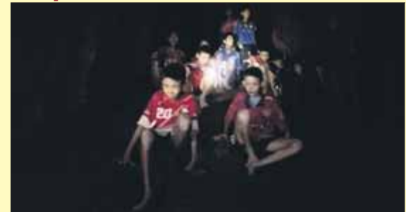
Els 12 infants i el seu entrenador, dins la cova

Junqueras, Romeva, Sànchez i Cuixart arribaran avui a Catalunya