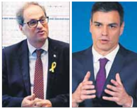
Quim Torra i Pedro Sánchez

Torra explorarà en la cimera camins de resolució i nomena negociadors per als afers de gestió