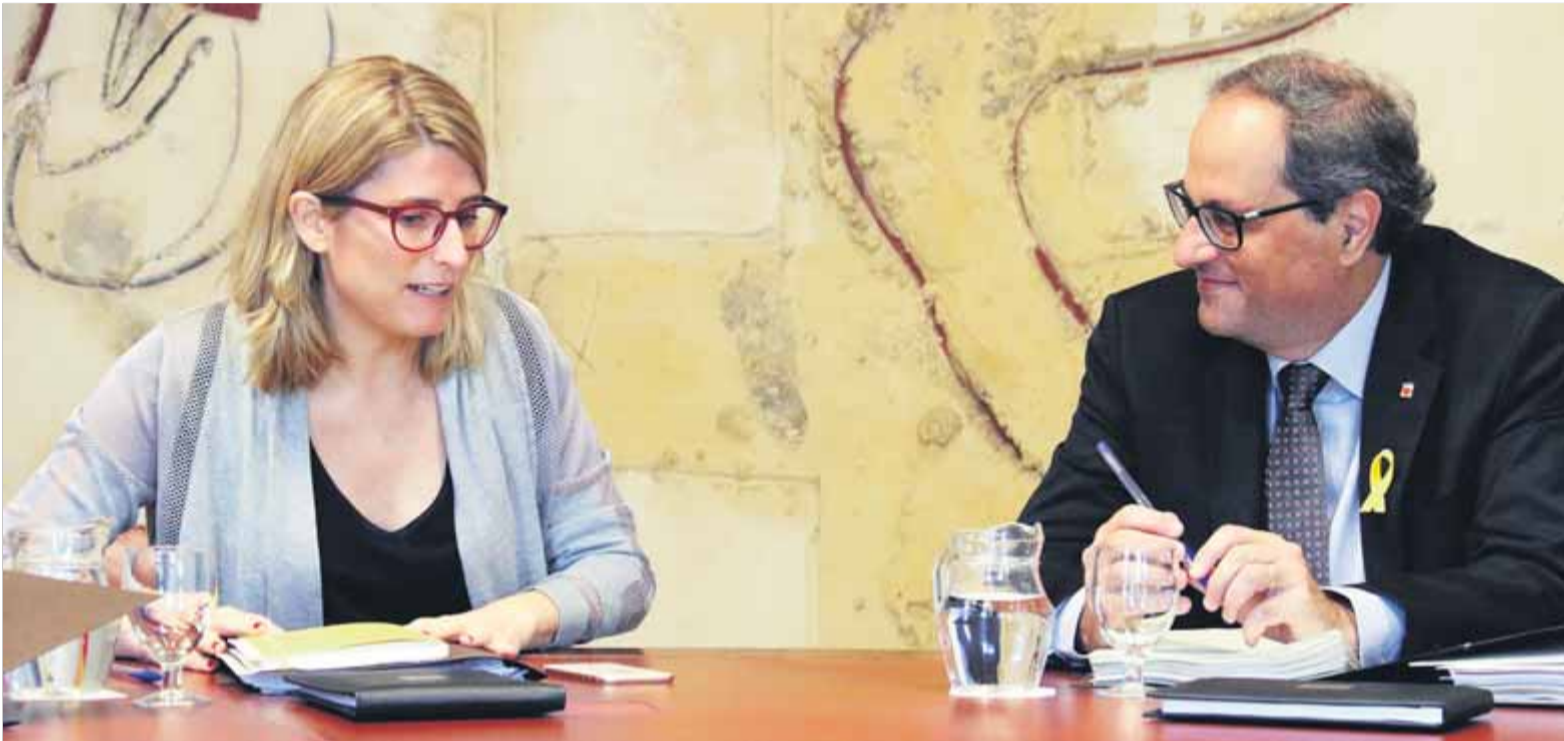
La consellera de la Presidència, Elsa Artadi, i el president, Quim Torra, en la reunió del Consell Executiu d'ahir al Palau de la Generalitat