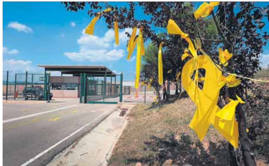
Llaços grocs a l'entrada de la presó de Lledoners, al Bages

La reclusió dels nou presos als penals catalans no serà definitiva, sinó que tots ells seran reclamats pel Suprem quan s'obri el judici oral i seran de nou retornats a penals de Madrid mentre duri el judici. Per a les famílies acaba ara el càstig de fer 600 quilòmetres fins a Madrid i després llogar un cotxe o agafar un taxi fins a Alcalá Meco (a 40 quilòmetres) per poder visitar Forcadell i Bassa, o fins a Soto del Real (a 50 quilòmetres) per veure els Jordis, o fins a Estremera (a 78 quilòmetres) per visitar Junqueras i els exconsellers. ■