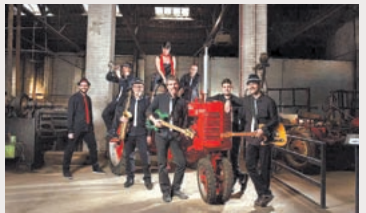
El grup de versions actuarà dissabte a la nit

20.00 Ball de tarda amb Duet Stylette. A la mitja part, llonganissada popular.