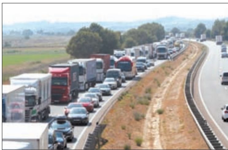
L'A-2 va registrar fins a dos quilòmetres de retencions

Per altra banda, a les 15.05 hores al quilòmetre 473 de l'A-2, al seu pas per Bell-lloc d'Urgell, un camió tràiler va xocar contra una furgoneta de manteniment de carreteres. Els dos vehicles van acabar fora de la via pel fort impacte i el camioner va resultar ferit de caràcter menys greu, sent traslladat a l'Arnau de Vilanova. Els Mossos van tallar un carril i es van formar també fins a dos quilòmetres de cues.