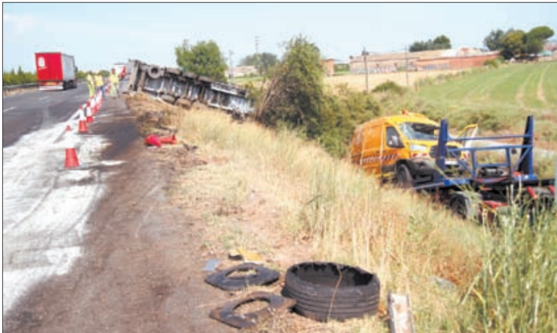
Els dos vehicles implicats en el sinistre de l'A-2 van acabar fora de la via