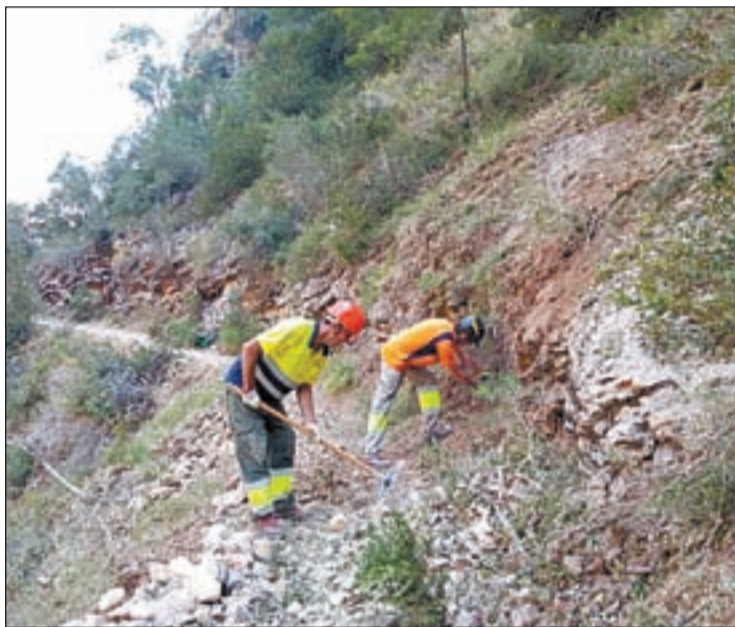
Els tècnics netejant la zona afectada

El centre d'informació de La Masieta i l'aparcament seguiran funcionant amb normalitat i atendran les consultes dels visitants. En moments de màxima afluència turística arriben a visitar el congost de Mont-rebei unes 2.000 persones al dia.