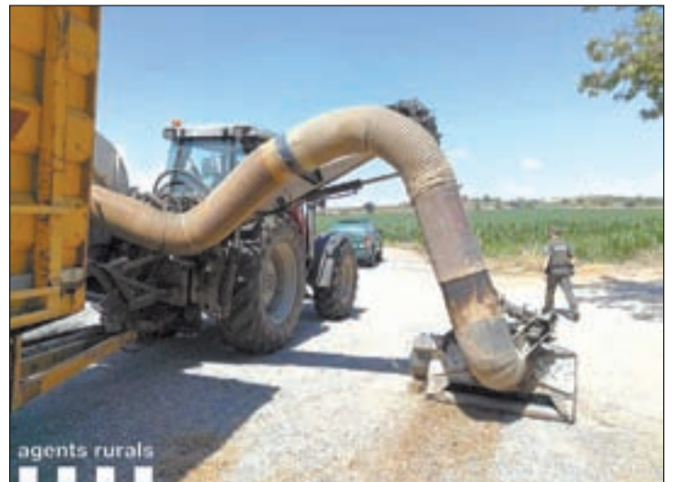
Imatge en el que era sancionada una màquina