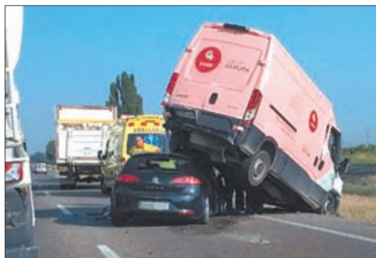
Estat en el que van quedar el cotxe i la furgoneta a l'N-240