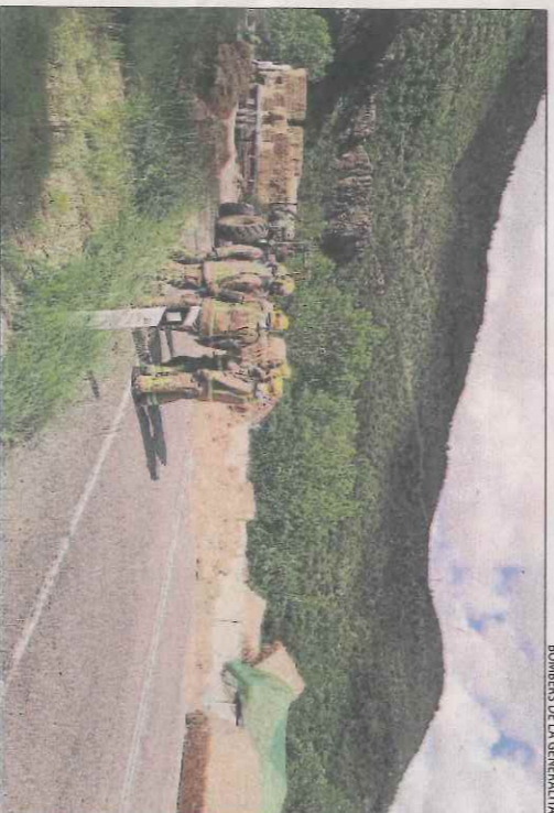
BOMBERS DE LA GENERALITAT

nicipal d'ERC va afirmar que l'ajuntament tenia l'obligació de donar llicència a qualsevol projecte que complís la normativa, com era el cas, ja que "actuar d'una altra manera seria un delicte de prevaricació", va puntualitzar l'alcaldé Llavors.