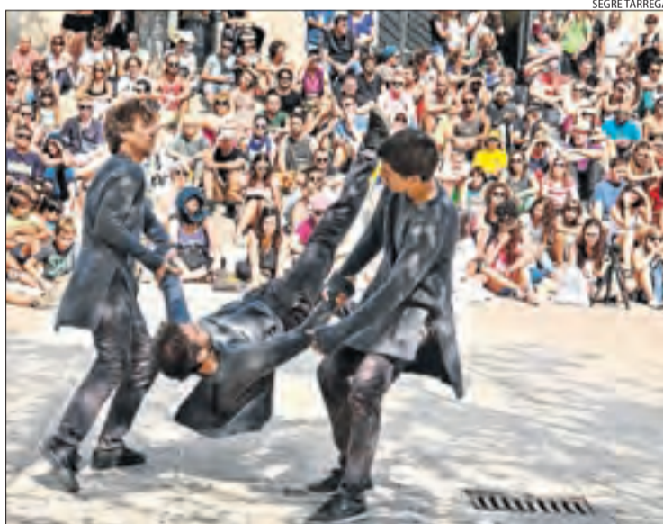
La Cia. Elías Aguirre, una de les enquestades, a FiraTàrrrega 2017.

Donen un 4,3 sobre 5 a l'organització, condicions d'exhibició i caràcter internacional de la fira