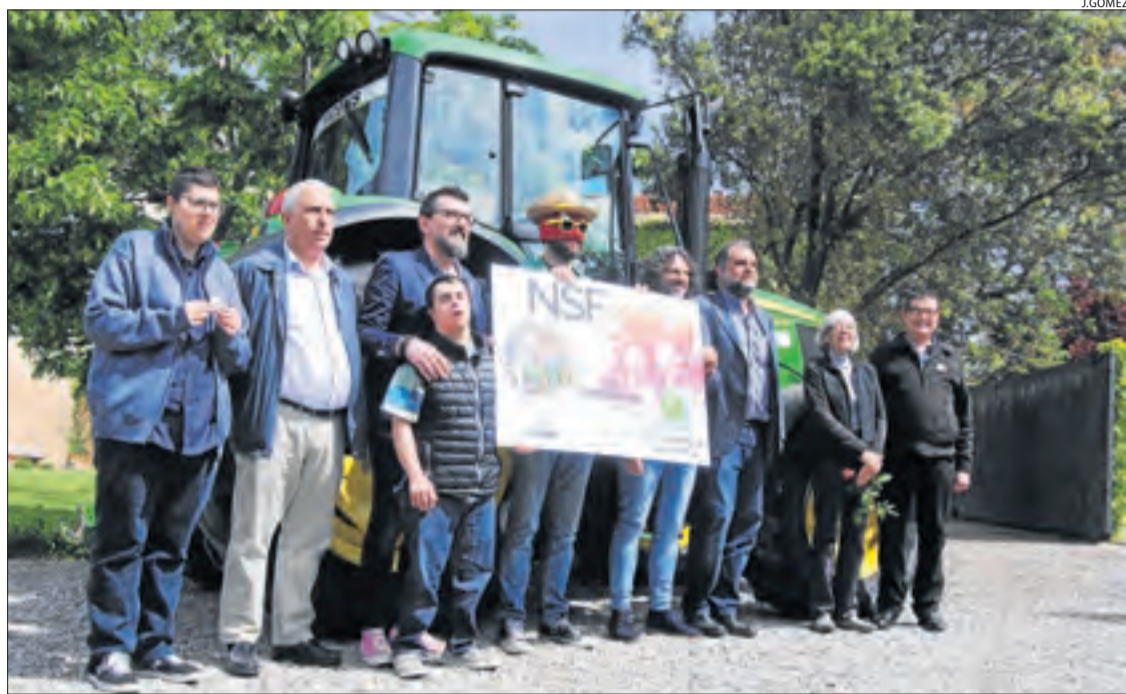
La presentació de la segona edició del festival es va portar a terme ahir a la casa rural Era de Cal Falillo.

A disposició del cantant durant la celebració del No Surrender Festival