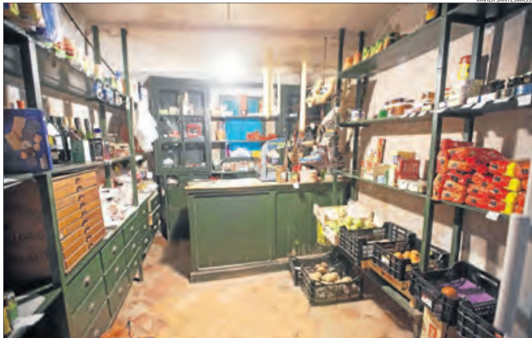
Cal Canosa, a Concabella, va tancar fa anys encara que els amos conserven la botiga com un museu.

Més de quaranta municipis dels 231 de Lleida, amb gairebé 7.000 veïns, no disposen de cap botiga de queviures, segons dades del departament d'Empresa. La Noguera i la Segarra són les comarques més afectades. Per pal·liar aquesta carència, els habitants es desplacen a altres poblacions amb transport "a la carta", però també comerciants ambulants van periòdicament a aquests pobles.