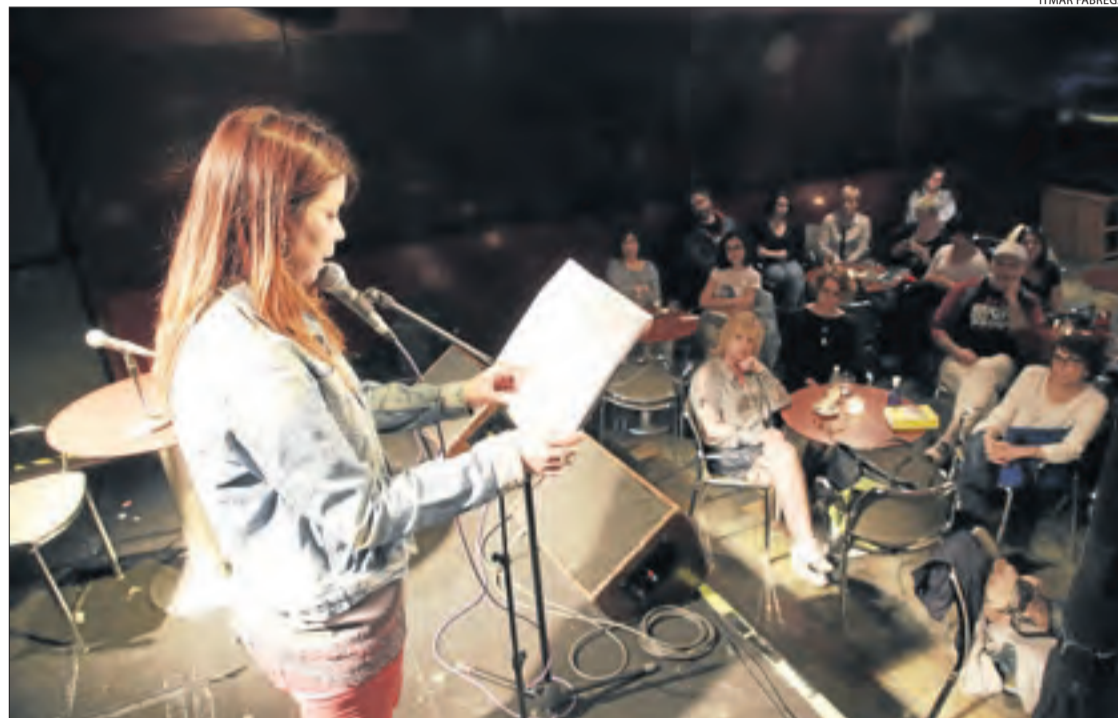
Més d'una desena de persones van pujar a l'escenari a llegir parts de la sentència de La Manada.

Una quarantena de persones es reuneixen a Lleida per llegir col·lectivament fragments de la sentència || En un acte que ja se celebra en altres ciutats