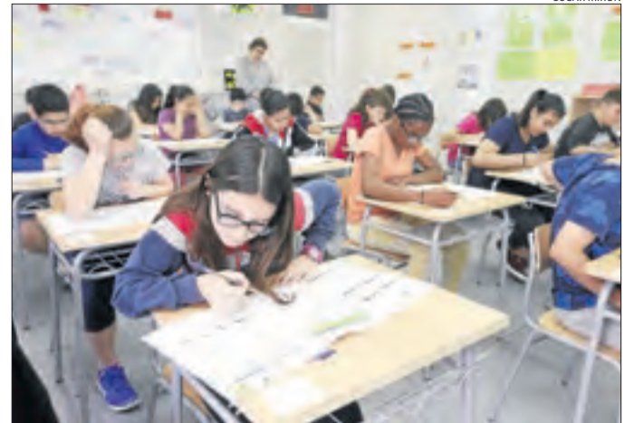
Alumnes de sisè del col·legi Pinyana de Balàfia.