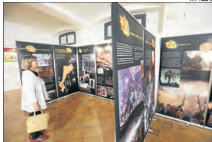
La mostra es podrà visitar gratuïtament fins al 20 de maig.