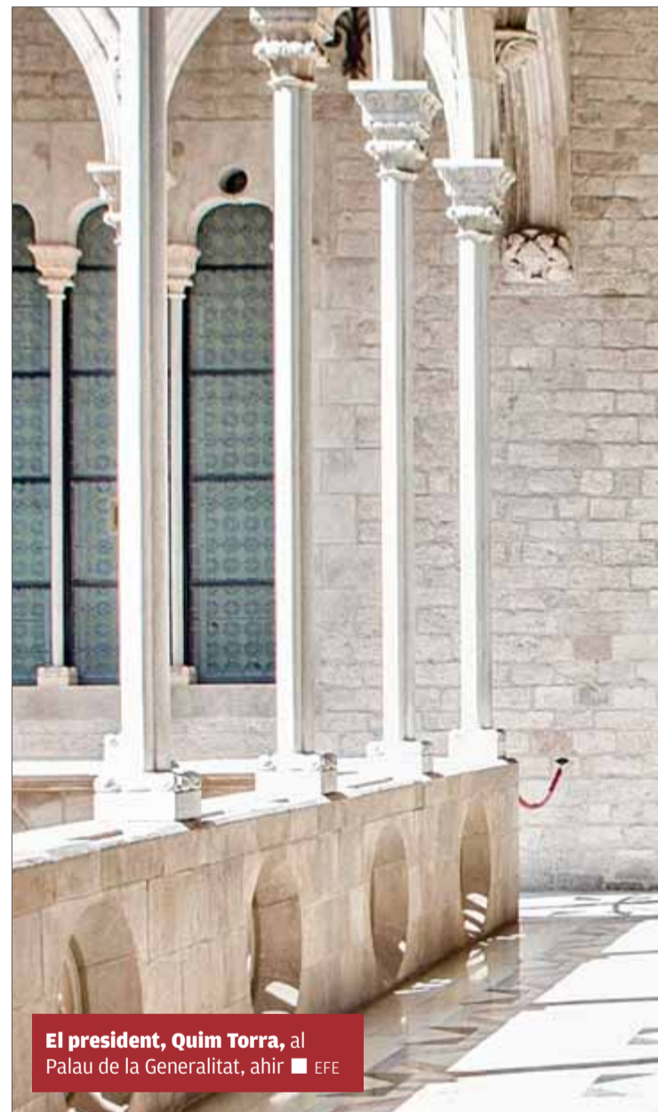
El president, Quim Torra, al Palau de la Generalitat, ahir

Aquests noms formaran part d'un executiu que queda completat amb el vicepresident Pere Aragonès; el conseller d'Acció Exterior, Ernest Maragall; el conseller d'Interior, Miquel Buch; Josep Bargalló, a Ensenyament; Ester Ca-