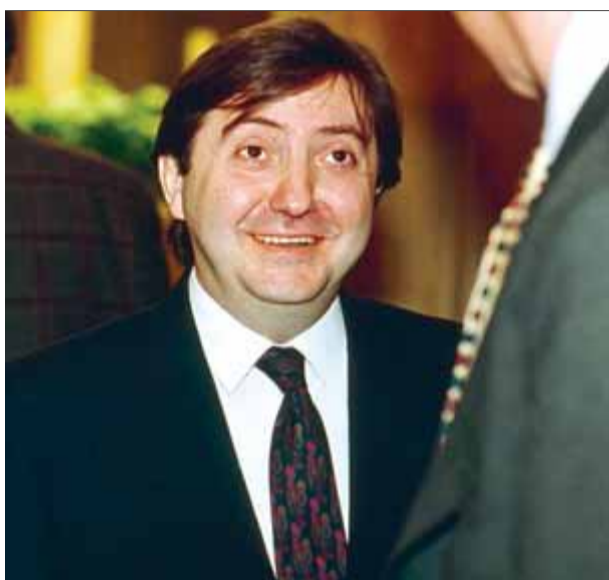
Federico Jiménez Losantos en una imatge d'arxiu durant una recepció al Congrés dels Diputats