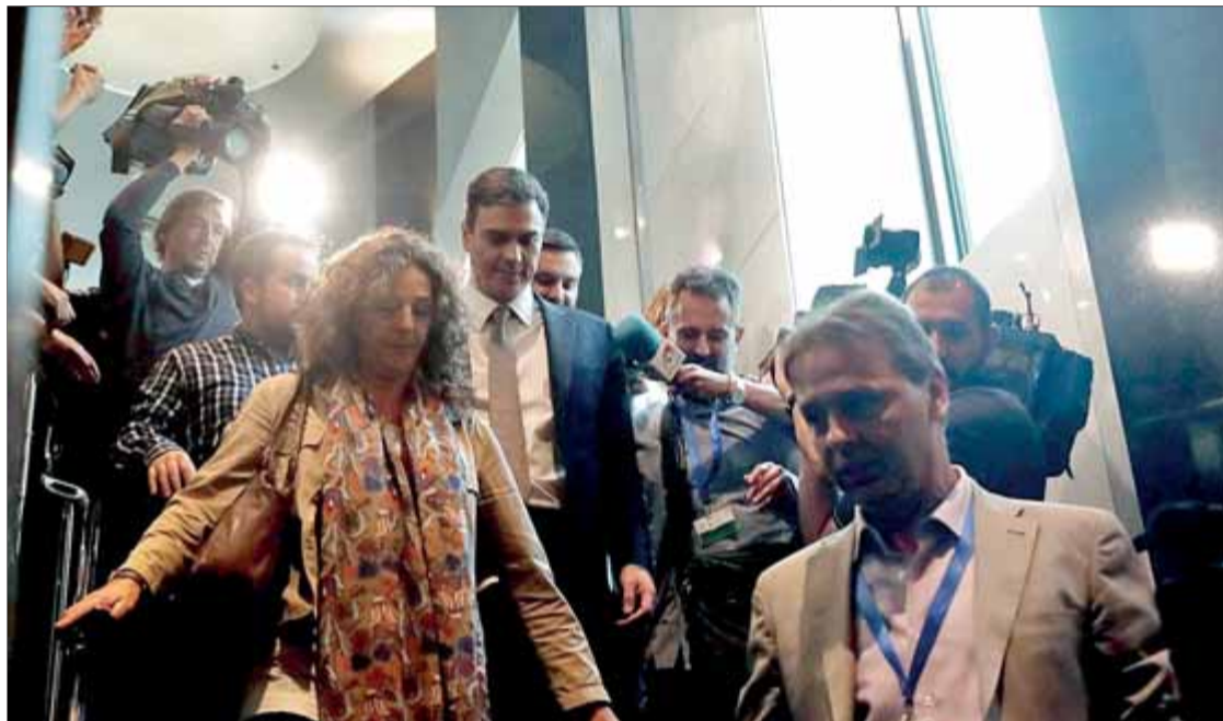
Si Pedro Sánchez guanya la moció de censura, notarem ben poca cosa

És clar que el procés català els partits polítics espanyols l'han entomat amb una mena de pacte de sang en defensa de la unitat d'Espanya per sobre dels drets i assumint qualsevol cost polític,