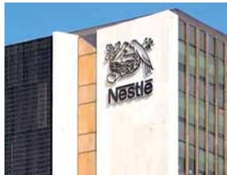
Seu de Nestlé a Esplugues

Nestlé hi portarà la seva divisió tecnològica i Siemens hi obrirà un centre d'R+D