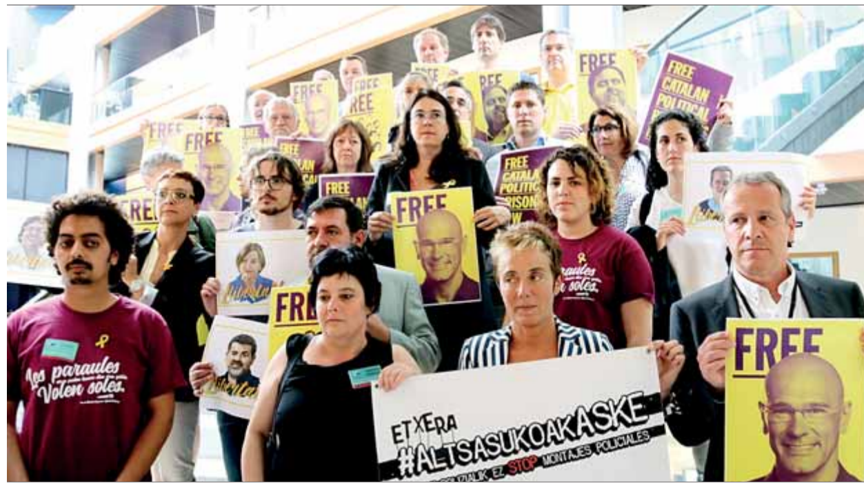
Familiars dels presos catalans, dels d'Altsasu i de Valtònyc al Parlament Europeu, amb eurodiputats ■ ACN

QUERELLA • Un dels primers acords serà una querella contra Rajoy