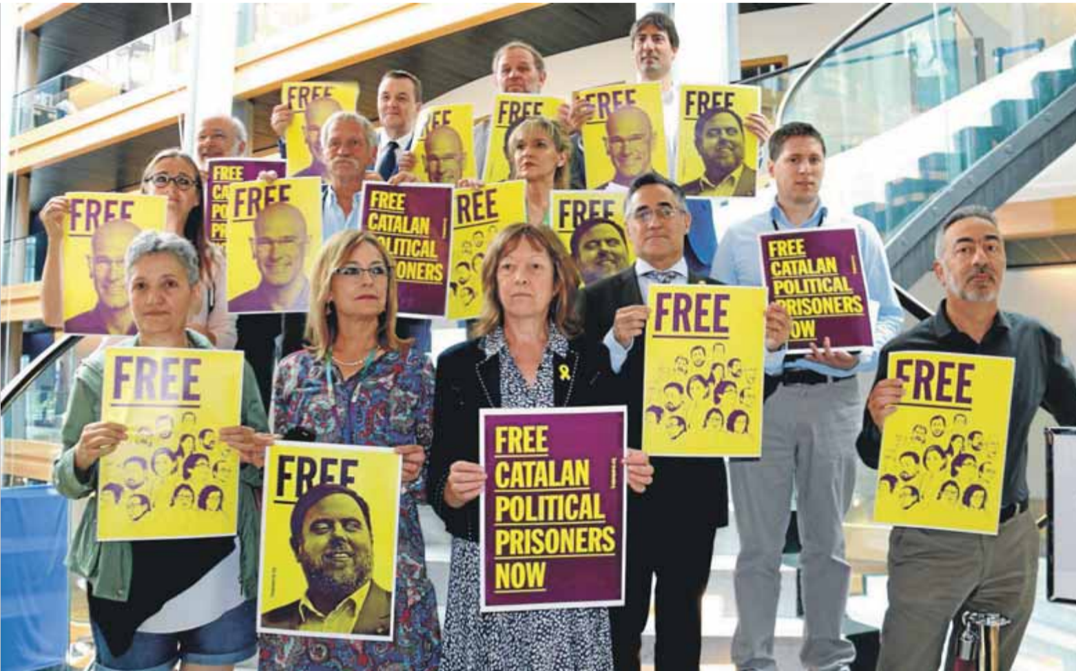
Un grup d'eurodiputats amb cartells a favor de l'alliberament dels presos polítics catalans, ahir a Estrasburg