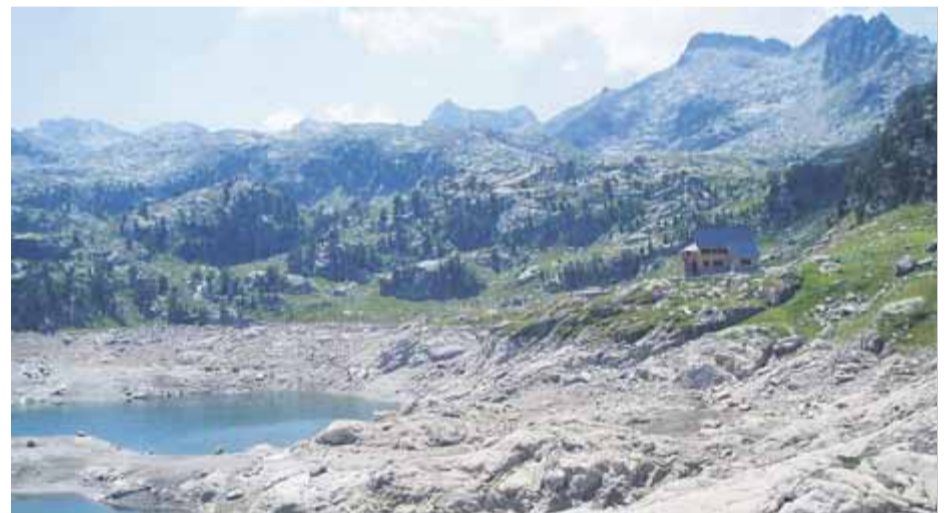
El refugi i l'estany de Colomers, en una imatge d'arxiu

Els vuit festivals van començar aquest cap de setmana passat a la Vall de Siarb. Des d'aquest dijous i fins al 3 de juny tindrà lloc el certamen Cerdanya Happy Walking, que inclou, per exemple, una excursió nocturna per conèixer