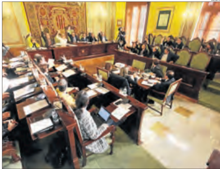
Votació dels comptes de l'EMU en un ple de la Paeria.

Per això, els consellers del PDeCAT van sol·licitar que se