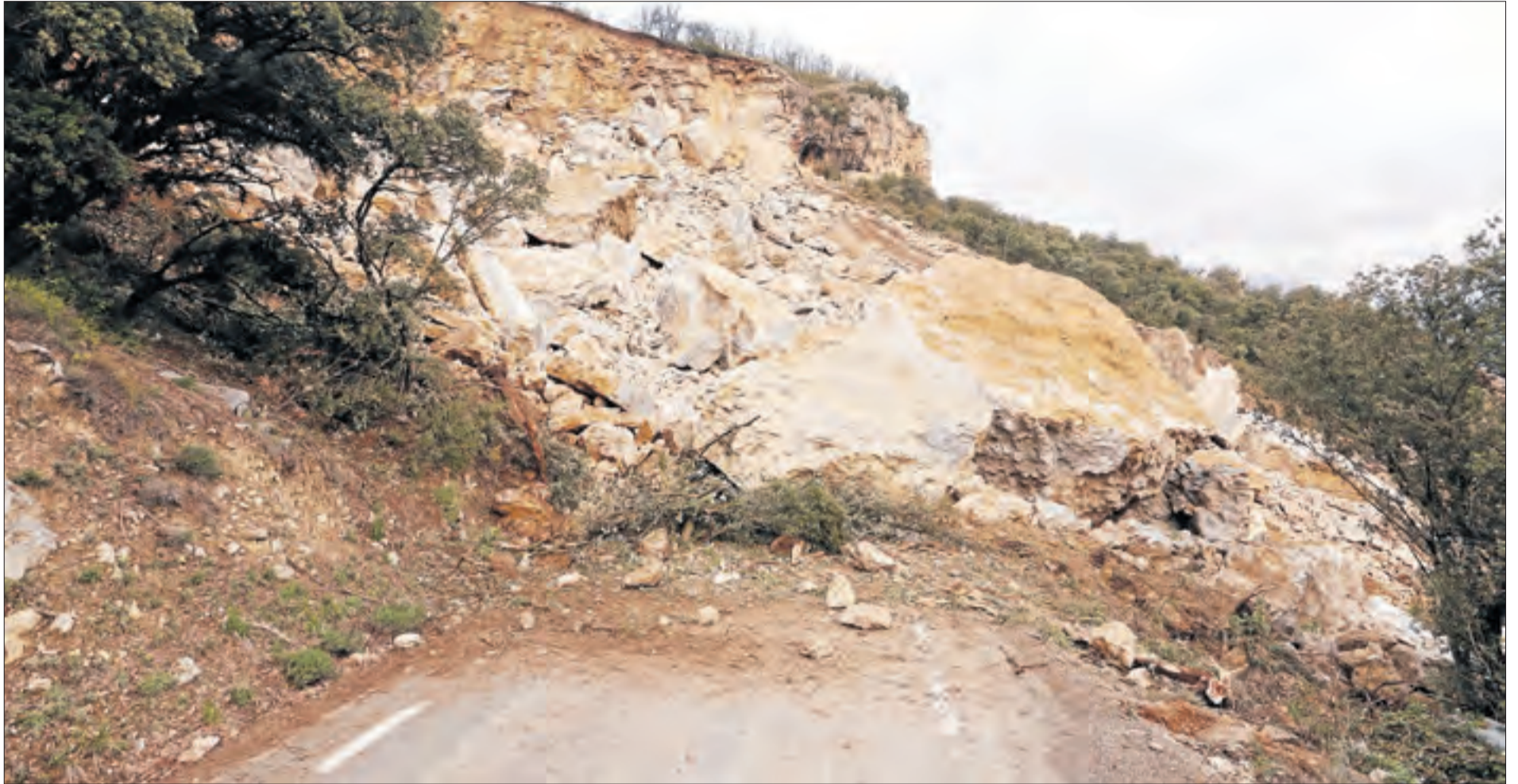
L'esllavissament va tallar del tot la carretera i va arrossegar i sepultar el cotxe en el qual viatjaven dos persones.