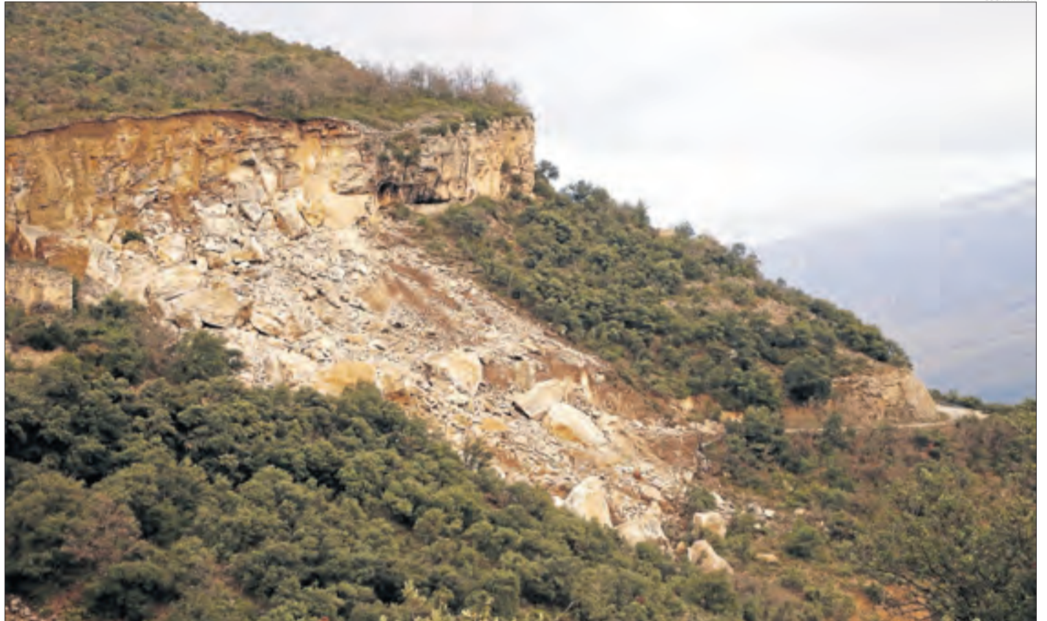
El pendent on va tenir lloc l'ensorrament del cingle, que va sepultar dos-cents metres de la carretera i el vehicle on viatjaven dos persones.

Després d'anys de reclamacions i litigis, sentències a partir de l'any 2014 van obligar a indemnitzar els afectats. Aquestes interlocutòries judicials incidien, precisament, en l'"enorme delicadesa del terreny" de la zona i revelaven l'existència d'estudis de l'Institut Geològic i Cartogràfic de Catalunya (ICGC) que, l'any 1997, advertien ja sobre "els moviments de masses que afecten el municipi".