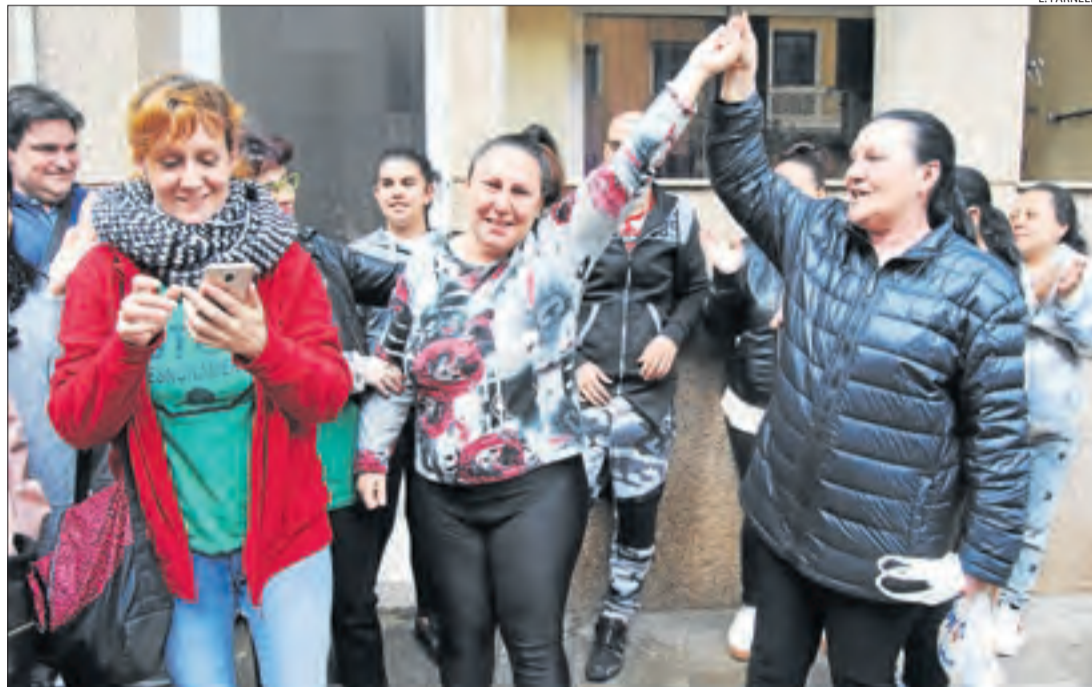
La dona, cap de família, al rebre la notícia que es parava el seu desnonament.

Una parella amb un fill menor d'edat || Okupes d'un pis d'un banc, i demanen quedar-s'hi amb un lloguer social