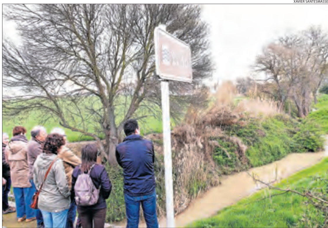
Representants dels ajuntaments implicats van visitar ahir la zona de l'actuació.

El projecte d'Agricultura és una mesura compensatòria inclosa en la declaració d'impacte ambiental del Segarra-Garri-