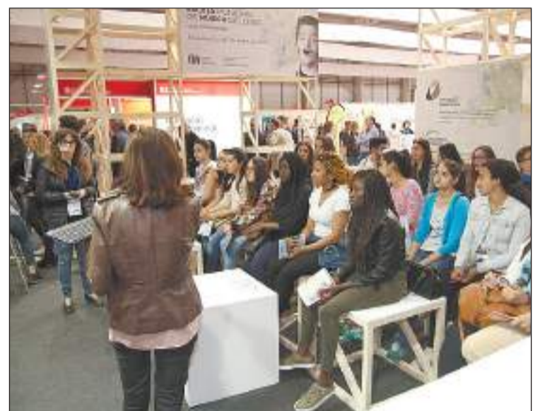
Imagen de archivo del encuentro formativo

El encuentro cumple su duodécima edición y se celebrará del 19 al 21 de abril en el pabellón 4 de Fira de Lleida. El salón contará con la participación de 21 empre-