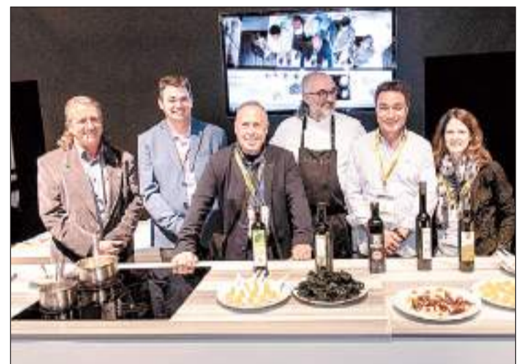
FOTO: / La DOP Les Garrigues mostra les excel·lències de l'oli verge extra