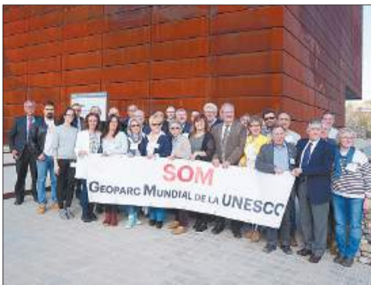
Foto de grup dels impulsors de la candidatura

El Geoparc Conca de Tremp-Montsec el formen 19 municipis de 4 comarques lleidatanes: el Pallars Jussà, la Noguera, el Pallars Sobirà i l'Alt Urgell que,