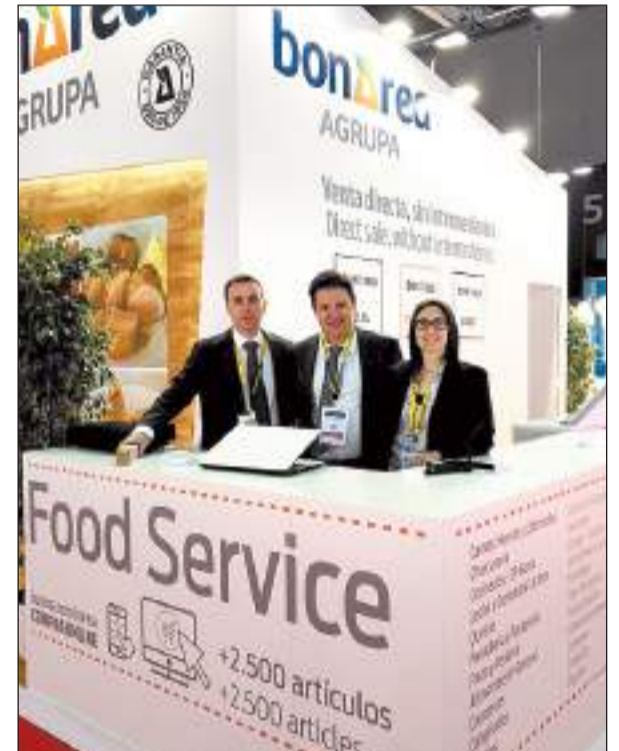
FOTO: El Grup Alimentari bonÀrea també hi és present