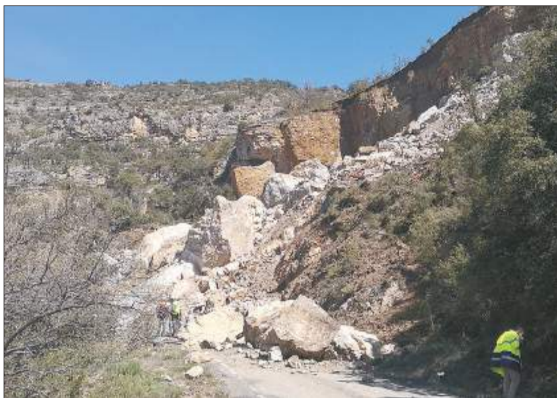
L'esllavissada va tallar totalment la carretera de Castell de Mur a Sant Esteve