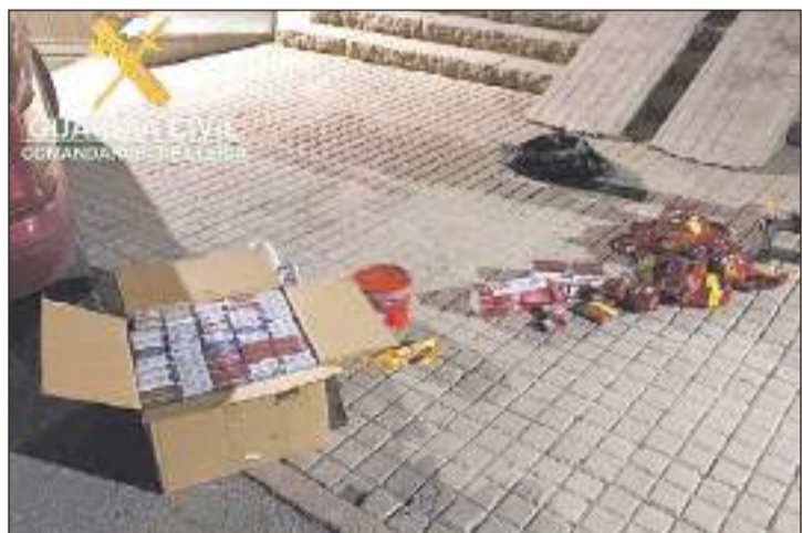
Imatge del tabac de contraban decomissat

Els Agents Rurals van efectuar quatre denúncies de pesca furtiva a Talarn per pesca amb mort en una zona de pesca sense mort, segons van informar. A més, els membres del cos van explicar, que els denunciats tampoc disposaven del corresponent permís diari de la zona de pesca controlada. Es van decomissar quatre canyes de pescar i una truita autòctona.