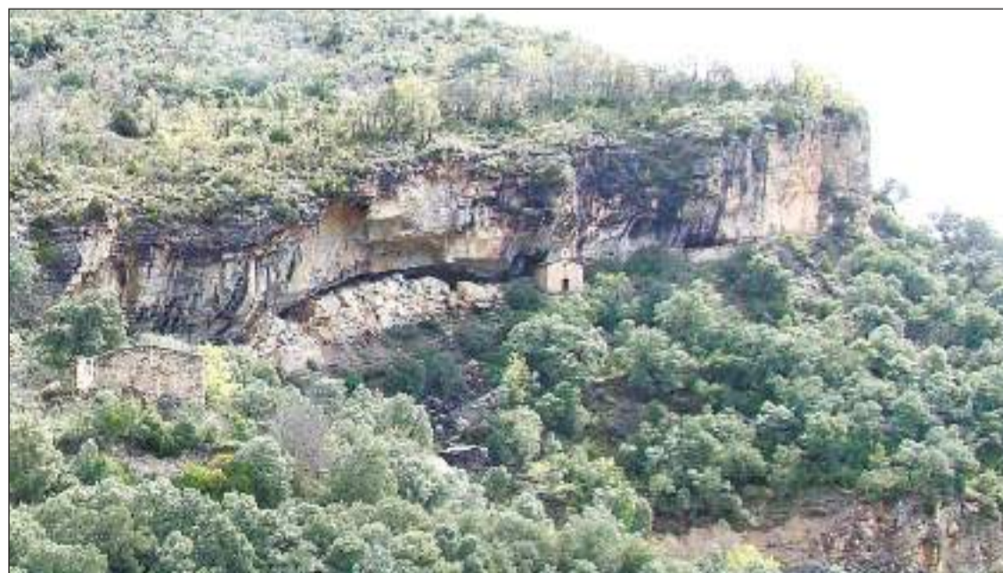
El Cinglo de les Esplugues on es pot veure l'ermita abans de l'esllavissada a Castell de Mur