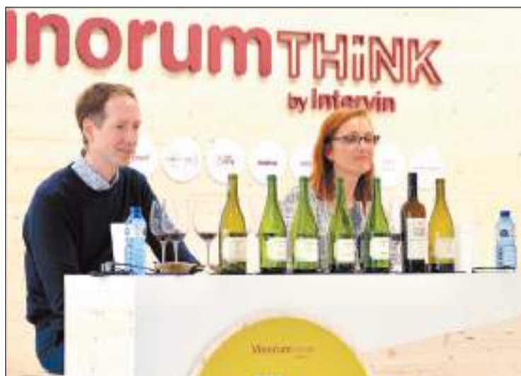
FOTO: / Cellers Torres ofereix tastos de varietats de raïm ancestrals