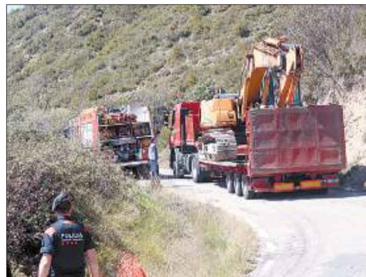
Una excavadora es va desplaçar fins la zona afectada