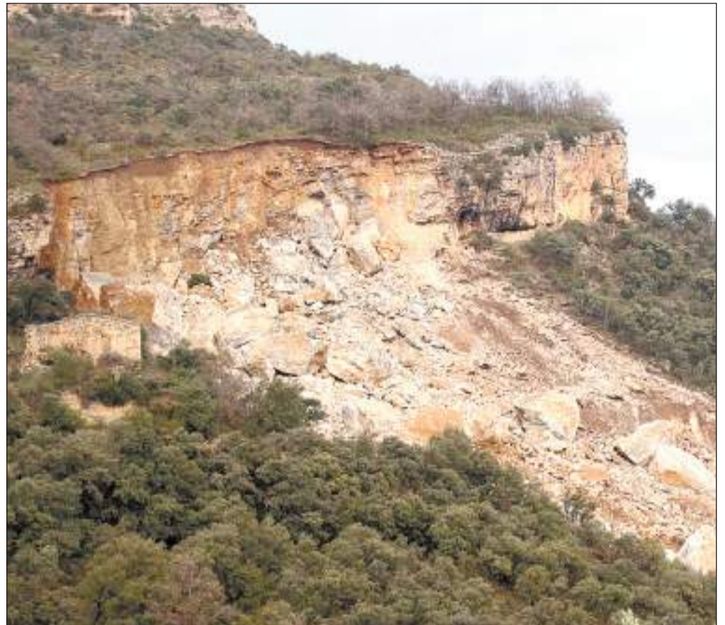
A l'esquerra, una imatge de l'ermita de la Mare de Déu del Roser. A la dreta, una fotografia de l'esllavissada on l'ermita ja ha quedat enfonsada entre les roques