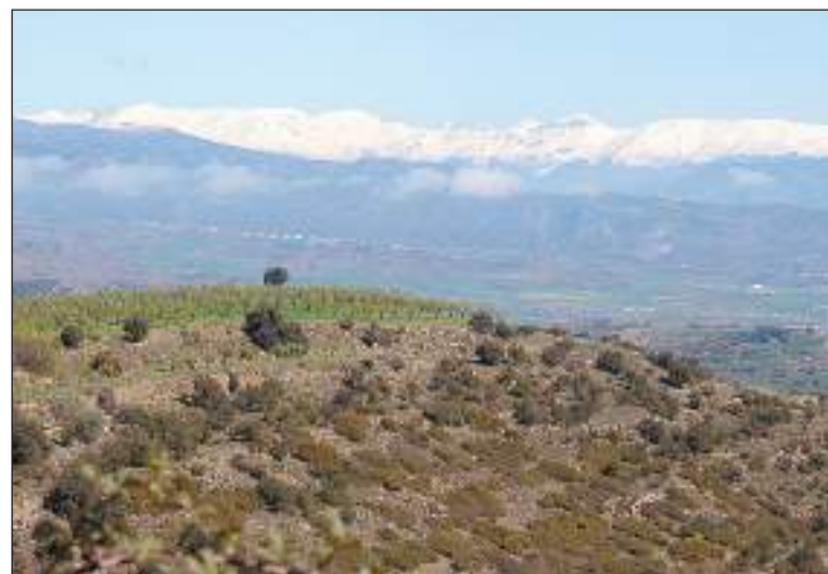
A l'esquerra, la presa del pantà de Mequinensa, ahir, i a la dreta muntanyes nevades des del Montsec