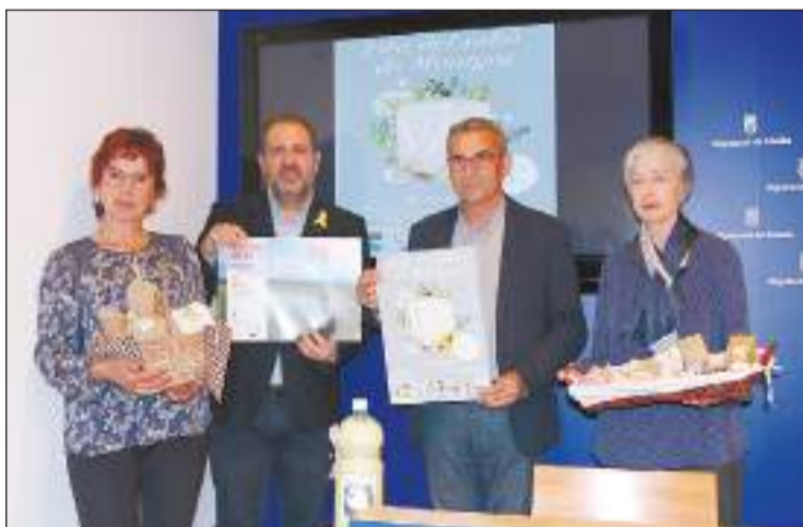
La Diputació va acollir la presentació de la fira

ros. Els efectius policials els van localitzar a l'interior del maleter de dos vehicles en dos controls: a l'N-145 a La Seu d'Urgell i a la C-14 al seu pas per Oliana.