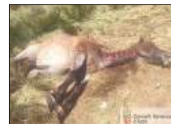
L'euga atacada

L'ós Goliat ataca una euga a Bausen, a la Val d'Aran