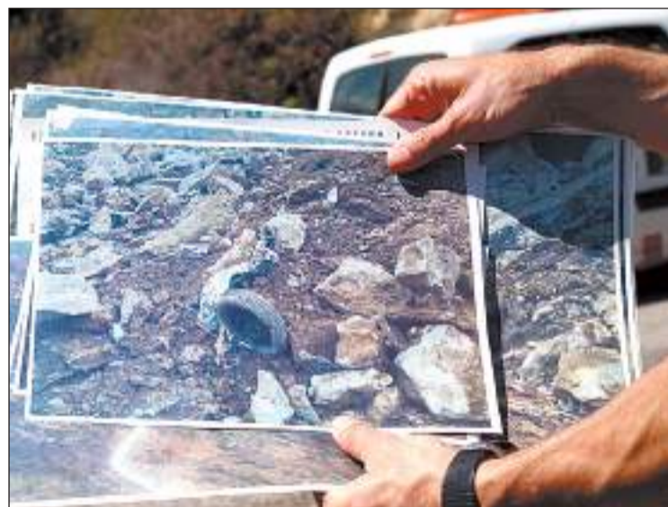
Restes del cotxe trobades entre les roques