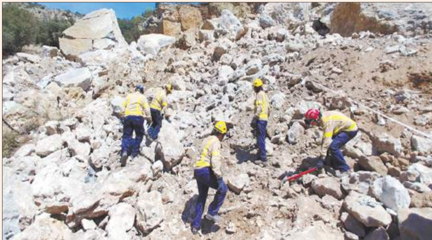
Los servicios de emergencias trabajaron duro en las tareas de rescate después de que los geólogos autorizaran la actividad

La carretera seguirá cerrada y se habilitará un paso alternativo