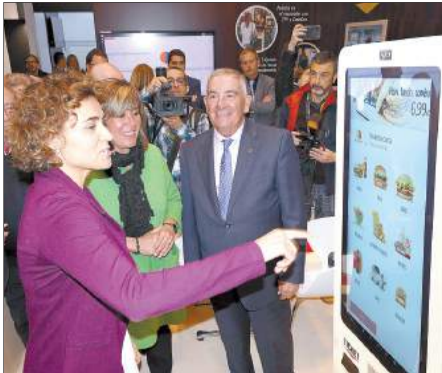
La ministra de Sanitat, Dolors Montserrat, ahir a l'estand d'ICG

També està present la firma Cellers Torres, que ofereix en el marc del certamen un tast inèdit de varietats de raïm ancestrals. Algunes d'aquestes estan plantades en finques de Costers del Segre i a les Garrigues. La varietat pirene la troben a la finca de Cellers Torres situada a Tremp, la vinya de major altitud de la família, i la varietat gonfaus es troba a la finca Purgatori de Juneda, que ben aviat estrenarà celler.