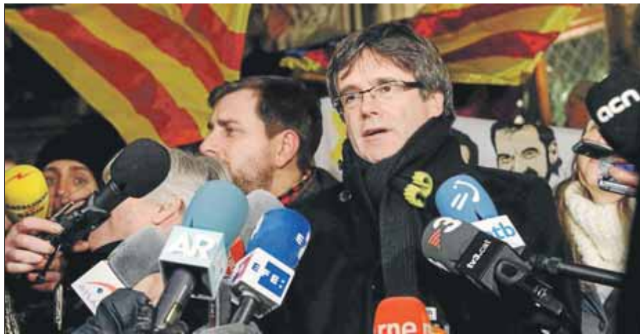
Puigdemont i Comin, en una de les atencions als mitjans que han fet en l'exili

Carles Puigdemont va concedir una entrevista que ahir publicava el diari britànic The Guardian en què carregava amb duresa pel paper que va fer el rei espanyol, Felip VI, el dia 3 d'octubre després de la situació que s'havia produït a Catalunya en el referèndum, dos dies abans. "El seu pare es va posar un uniforme militar i va fer un discurs civil. Aquest rei es va posar un vestit civil però va fer un discurs militar. Una república no necessita un rei", va declarar. Però els retrets no van ser només per l'actuació de la monarquia, sinó també per la mala fe del govern de Mariano Rajoy. En aquest sentit, va reiterar l'error de no haver proclamat la república el 10 d'octubre per prioritzar un diàleg promès amb el govern espanyol que mai va arribar. El president reconeix que "l'Estat va dir que si no votàvem per la independència [immediatament] iniciaria un diàleg", i assegura: "Diversos diplomàtics [d'altres països] em van dir que encoratjarien un procés de diàleg. Aquesta va ser una declaració enganyosa de l'Estat, però