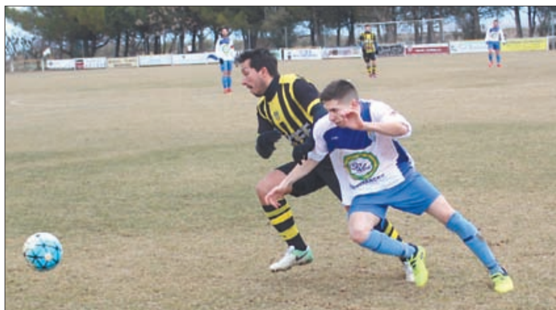
Angulària y Ponts disputaron un duelo de alternativas que se saldó con empate