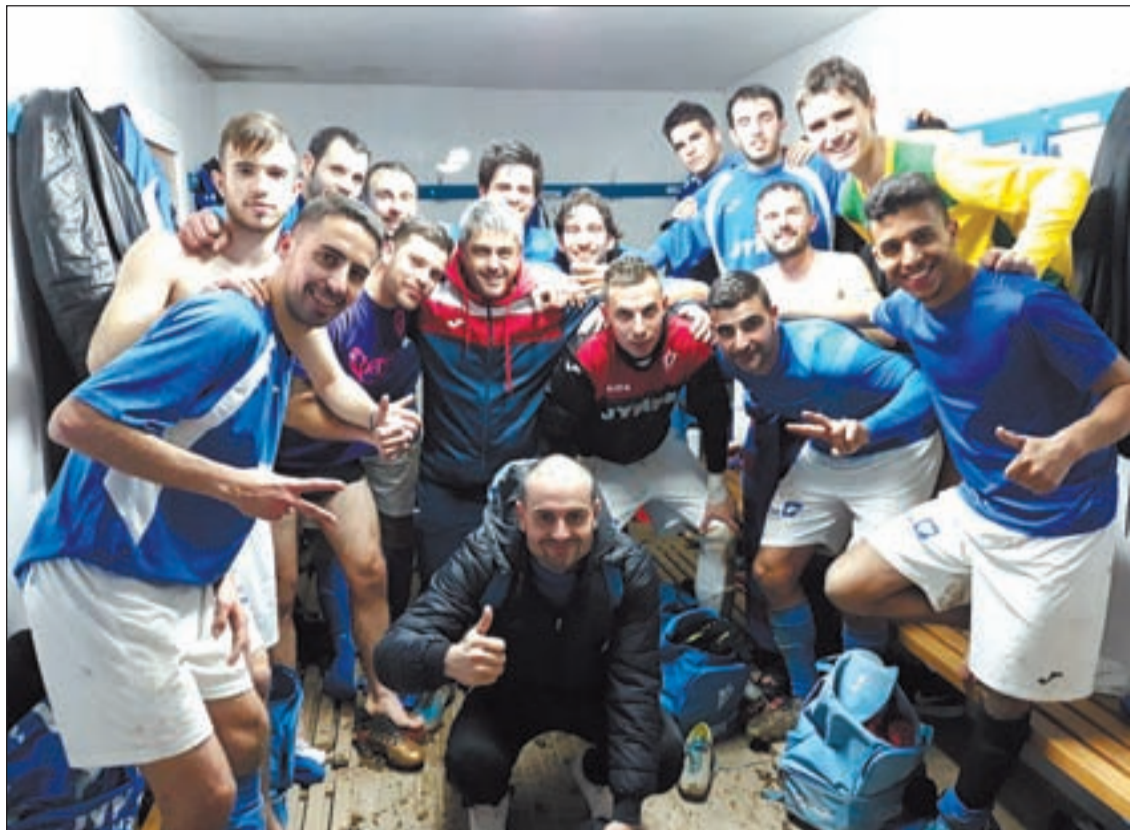
La plantilla del Castellserà volvió a celebrar un triunfo tras tres jornadas sin hacerlo

El Tàrrega no falla y suma la undécima victoria consecutiva