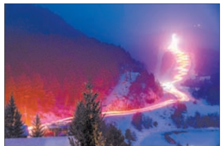
La baixada es va fer dissabte

zero degut principalment al fort vent. Prop de 7.000 persones han visitat aquest cap de setmana Port Ainé i Espot. Per Boí Taüll han passat 4.800.