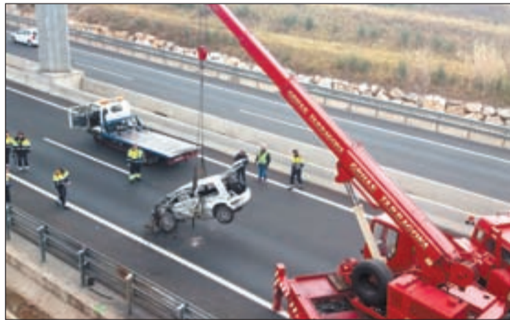
Estat en el que va quedar el cotxe