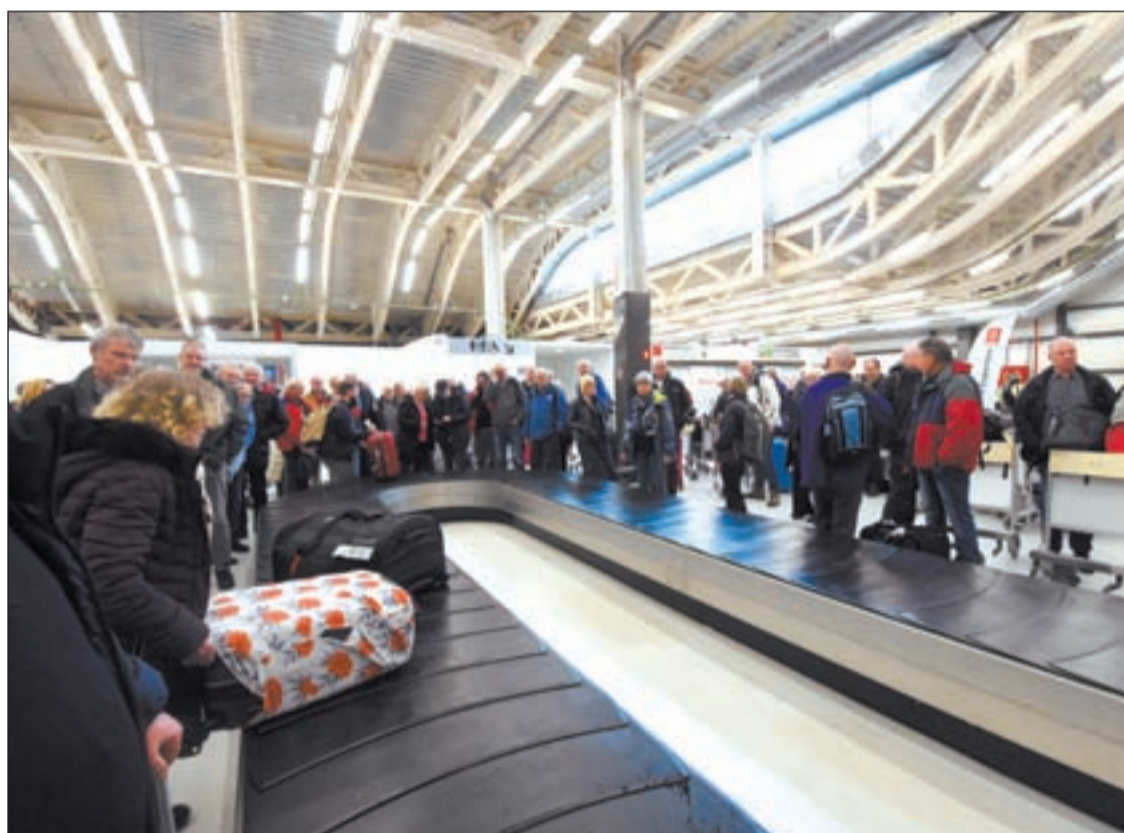
Imatge dels passatgers suecs que van arribar ahir al migdia a l'Aeroport d'Alguaire