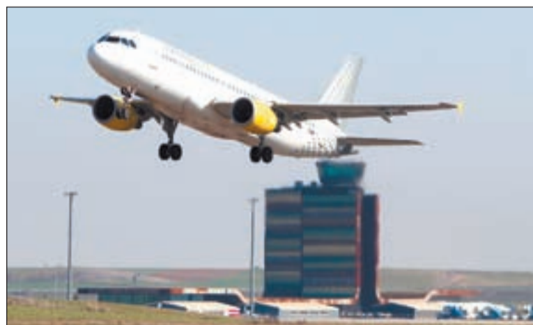
Un avión de Vueling durante los ejercicios

Los futuros pilotos de Vueling realizaron ayer prácticas de vuelo en el Aeroport d'Alguaire. También ayer se presentaron los vuelos de Marsella, Palma y Madrid al aeropuerto de Andorra-la Seu. | PÁG.14