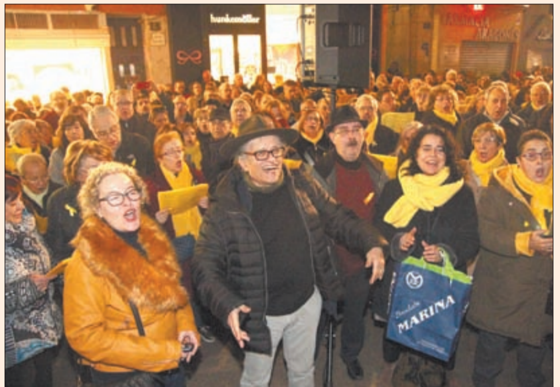
El politólogo Ramón Cotarelo ofreció una charla y participó en un acto ante la Paeria

CAP AL NOU GOVERN - PÁG. 3 - 6 Y EDITORIAL P. 7