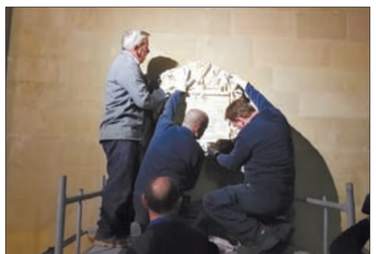
FOTO: / La placa, del segle XVIII, està dedicada a l'abat Jaume Caresmar

gut un doble objectiu: restaurar i posar en valor aquest patrimoni històric i artístic i retornar-la al seu lloc original, damunt de la sepultura de l'abat Jaume Caresmar, coincidint amb el 300 aniversari del seu naixement.