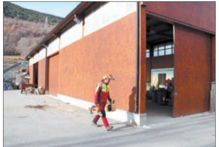
Les classes pràctiques es faran en un magatzem

Aquest projecte ha estat beneficiari d'una subvenció com a projectes singulars en el marc de la Xarxa d'Ateneus Cooperatius i projectes Aracoop. Entre els aspectes que s'han valorat destaca que aquestes entitats porten a terme una tasca que promou