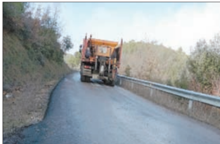
Un camió repartint sal a la carretera

D'altra banda, la Paeria disposa d'un stock de 220 tones de sal, que es reparteixen a les 3.00 de la matinada per les carreteres principals i cap a quarts de vuit a les