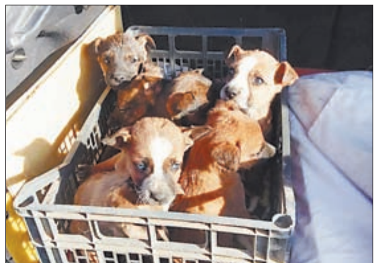
Los animales fueron trasladados a la protectora

Un vecino de Aitona encontró ayer en un contenedor de la localidad a ocho cachorros y los trasladó a la protectora de animales Lydia Argilés. Argilés explicó que uno estaba muerto y los supervivientes presentaban desnutrición y mucho miedo y estrés. | PÁG. 10