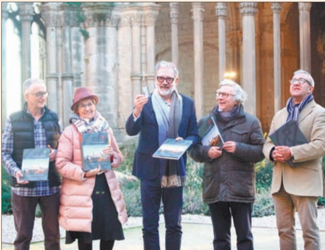
El dossier de la candidatura inició ayer su andadura para llegar a París el próximo año

► El dossier destaca la arquitectura y su ubicación sobre la plana de Lleida