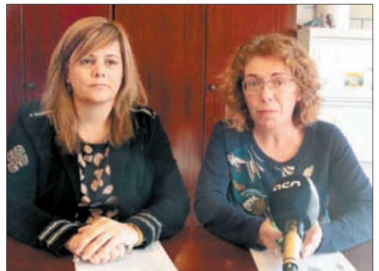
Les presidentes comarcals durant la reunió d'ahir

Cal tenir en compte que en els darrers temps, aquesta comarca aragonesa havia assumit, pràcticament, el manteniment de la infraestructura després de la dissolució del consorci del Montsec. Amb el conveni, la Noguera també es comprometrà a col·laborar-hi, buscant finançament d'altres administracions catalanes.