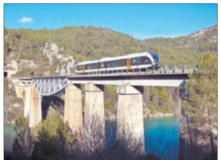
Imatge del tren de la línia Lleida-la Pobla de Segur

A la línia Llobregat-Anoia també es confirma la tendència de creixement, amb un increment respecte el 2017 també del 3,3%, amb 23 milions de validacions. En aquesta línia s'ha detectat un augment global de la mobilitat, sobretot concentrat en la segona corona (tram entre Colònia Güell