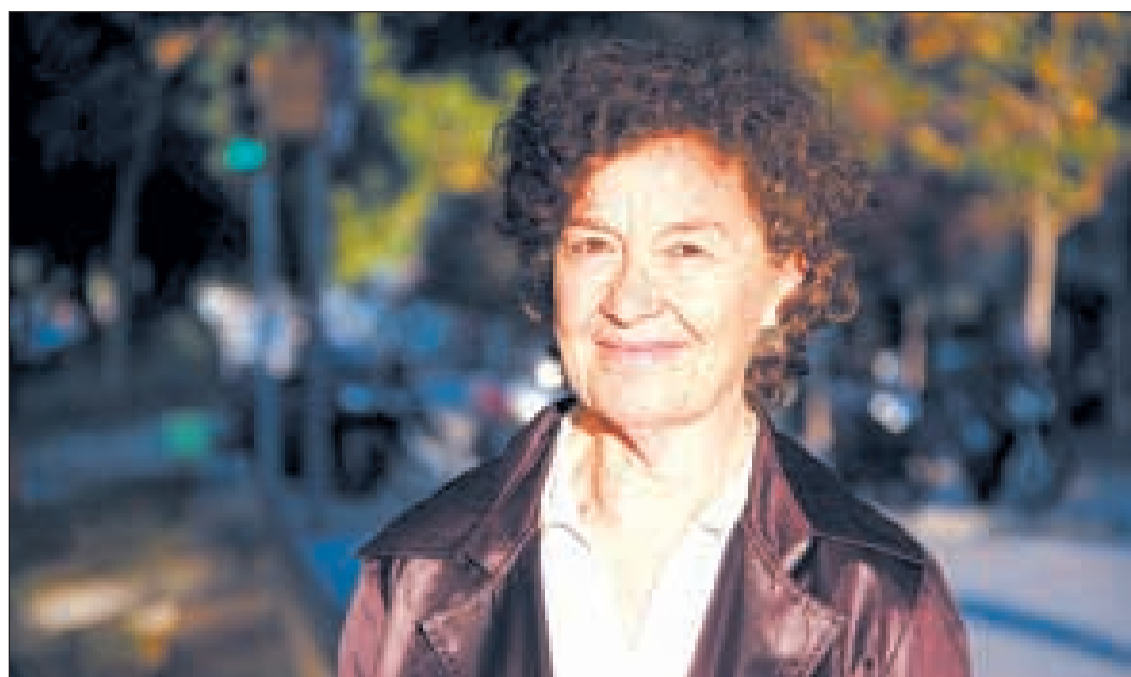
El nou treball de Maria Barbal estarà a la venda a partir del 23 de gener