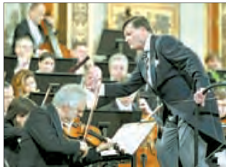
El director alemany portant la batuta del concert

el 1984, la tercera temporada ho farà a l'estiu de 1985, quan continuarà l'aventura del grup d'amics després que un d'ells desaparegués en estranyes circumstàncies i relacionades amb experiments secrets governamentals i forces sobrenaturals. La nova temporada comptarà amb cares noves: la de les actrius Maya Hawke i Cary Elwes i l'actor Jake Busey.