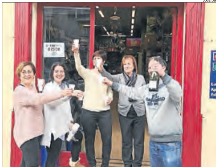
Fraga. L'estanc Bollic va celebrar amb cava haver venut un dècim.