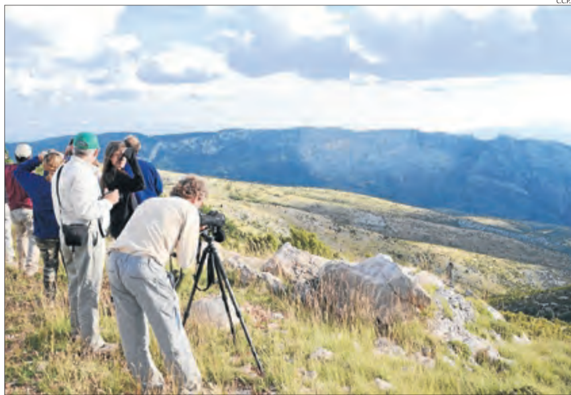
Imatge de turistes en una de les activitats d'albirament de fauna a la reserva de Boumort.

una guia que es publicarà en les pròximes setmanes i que incorporarà idees i recursos per dissenyar i executar productes turístics per a l'observació de fauna, amb informació per poder desenvolupar-los dins de la reserva i també en altres espais naturals de la comarca del Pallars Jussà.