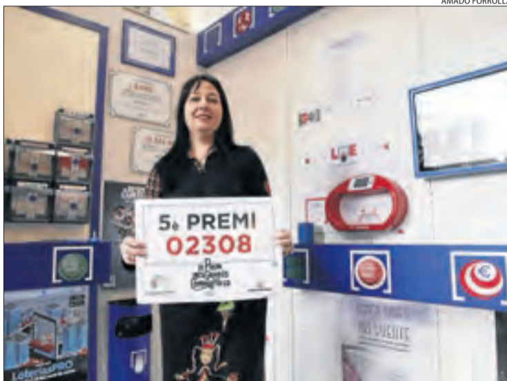
Un dècim d'un cinquè es va vendre a Balaguer.