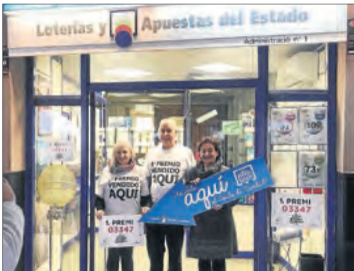
La Seu. Els titulars de l'administració 'Els Minairons'.

El primer || Deixa a Osca 120 milions, així com a Bilbao, Gernika i Conca