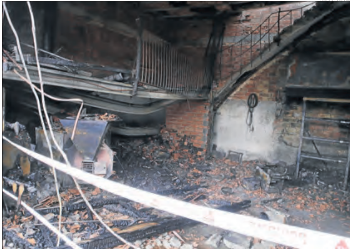
Un incendi divendres a Soses va obligar a traslladar les dotacions de Lleida ciutat i Mollerussa.

Es tracta d’una situació extrema”, en la qual els bombers reclamen com a mínim 100 pla-