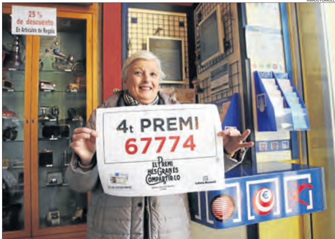
La propietària de l'estanc de l'Estació Lleida-Pirineus, amb el cartell del quart premi.

La província de Lleida s'ha gastat en aquesta edició de la loteria fins a 43.208.740 euros, un 12 per cent menys que l'any passat, quan van ser 49 milions. La demarcació no ha estat especialment agraciada, ja que només ha recuperat setze milions d'euros.