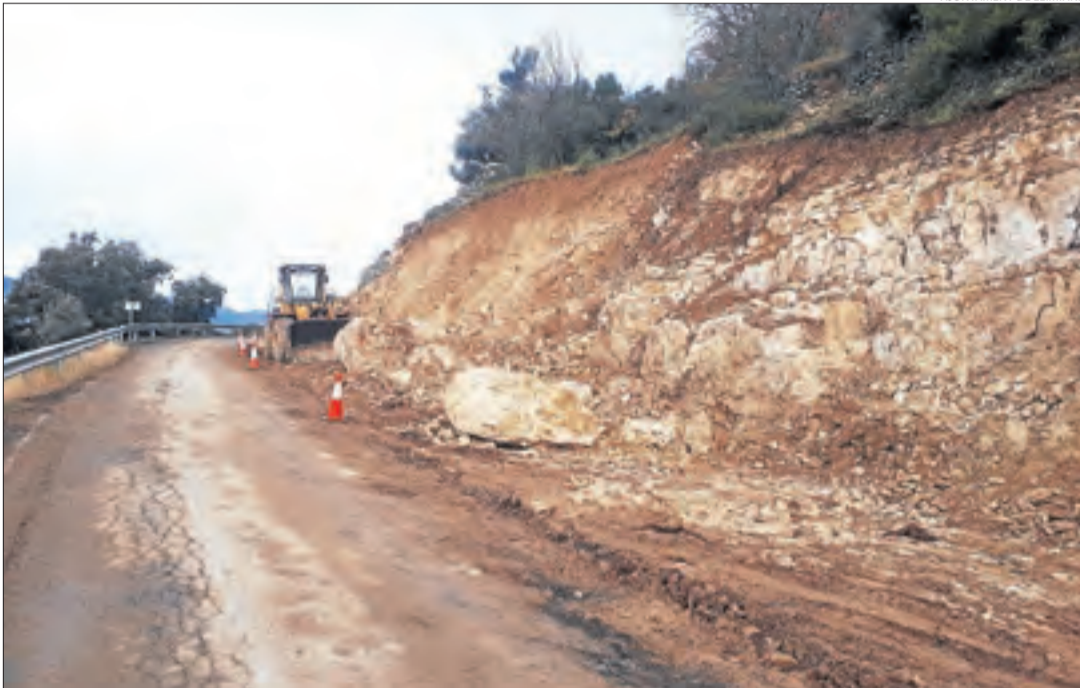
AJUNTAMENT DE LLIMIANA