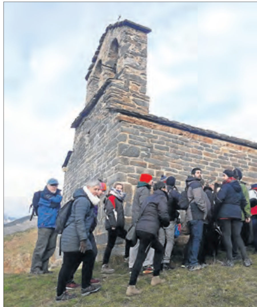
Romànic. La Vall de Boí va celebrar ahir les tres 'declaracions' amb una visita al romànic,

Respecte a les candidatures futures, la del Turó de la Seu Vella com a Patrimoni Mundial és la que està més avançada (vegeu el desglossament). Tanmateix, res fa presagiar que sigui fàcil aconseguir-ho. Les dels Vestits de Paper de Mollerussa i la Val d'Aran es troben en les fases inicials.