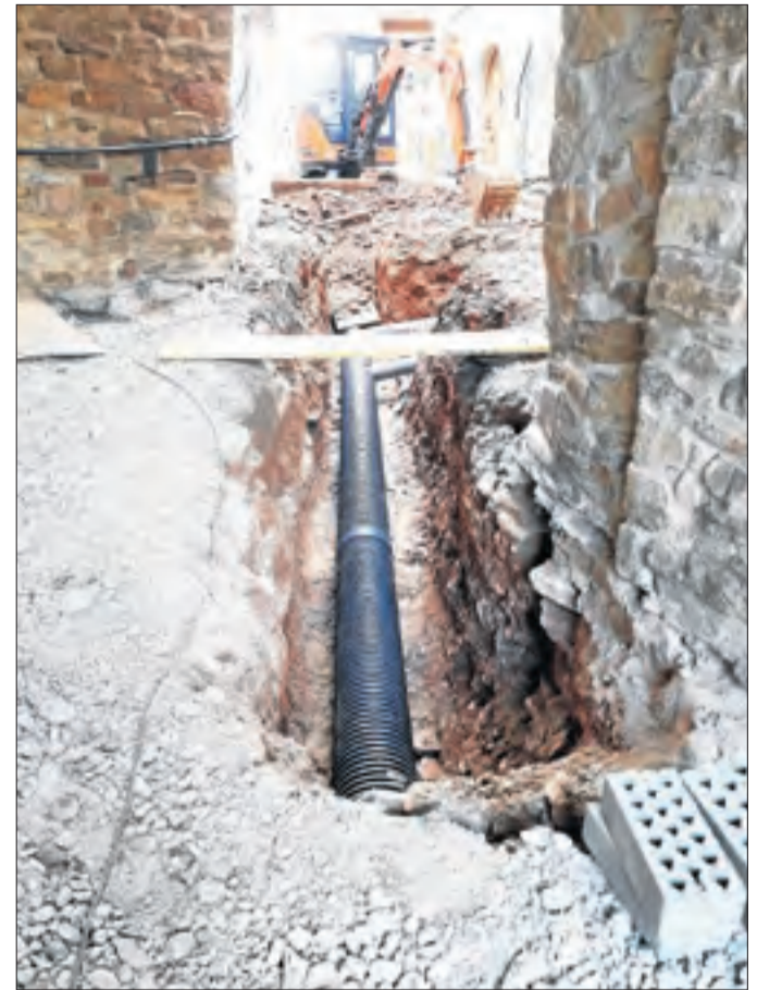
Els treballs en curs a Palau de Noguera.