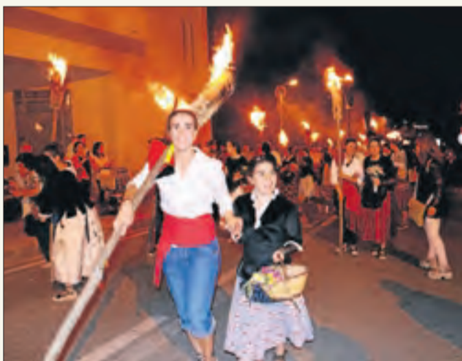
Les dones ja poden ser fallaires a tot el Pirineu.