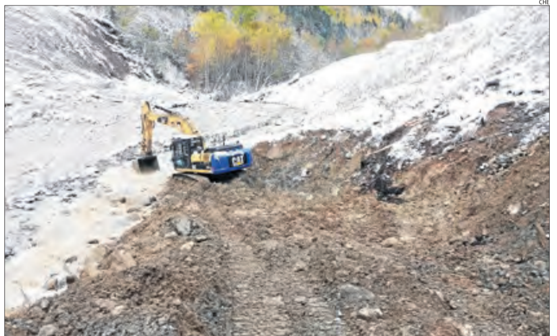
Imatge del dia que van començar les obres per evitar els abocaments de llots i argiles a la Garona.

El Conselh va demanar a la CHE que actués d'urgència pels desprendiments de terra a Valarties