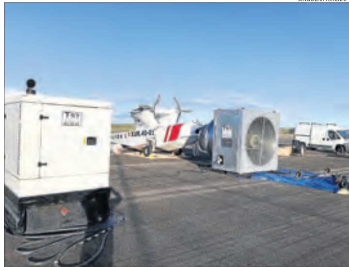
Prototip de Singular Aircraft la primavera passada a Alguaire.

Segons informen fonts de la Generalitat, autoritzar el vol d'aeronaus no tripulades requereix un informe de l'Agència de Seguretat Aèria (Aesa), que haurà d'avaluar si aquesta activitat suposa risc per al trànsit aeri. Les mateixes fonts van apuntar que ja han sol·licitat l'informe a aquest organisme del ministeri de Foment. Acollir vols de prova de drons s'emmarca en l'interès del Govern de potenciar activitats industrials a l'aeroport lleidatà, on una desena d'empreses operen de forma regular.