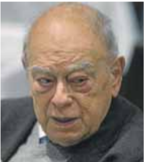
Jordi Pujol i Solel PRESIDENT DE LA GENERALITAT