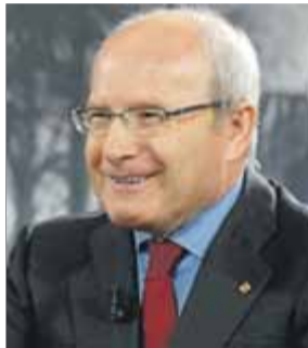
José Montilla i Aguilera PRESIDENT DE LA GENERALITAT