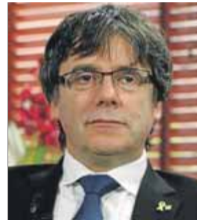
Carles Puigdemont PRESIDENT DE LA GENERALITAT

“En aquests moments, cal pensar a salvaguardar el seu dret a la vida i a la salut i a garantir llur participació amb plenes facultats en la imminent fase de defensa processal i, més endavant, en el futur polític del país”, clou el comunicat conjunt de les autoritats catalanes. Al vespre, el president de la Generalitat Quim Torra també es va afegir a la petició i els va demanar que aturin la vaga de fam: “Tenen un coratge increïble però hi ha un punt d’angoixa”, va dir en un Sopar Groc a Barcelona.