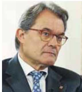
Artur Mas i Gavarró PRESIDENT DE LA GENERALITAT