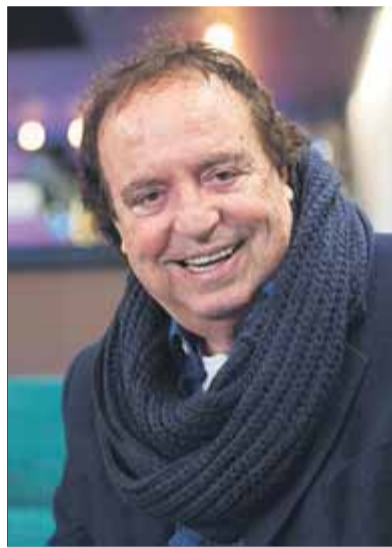
Dyango , fa uns dies