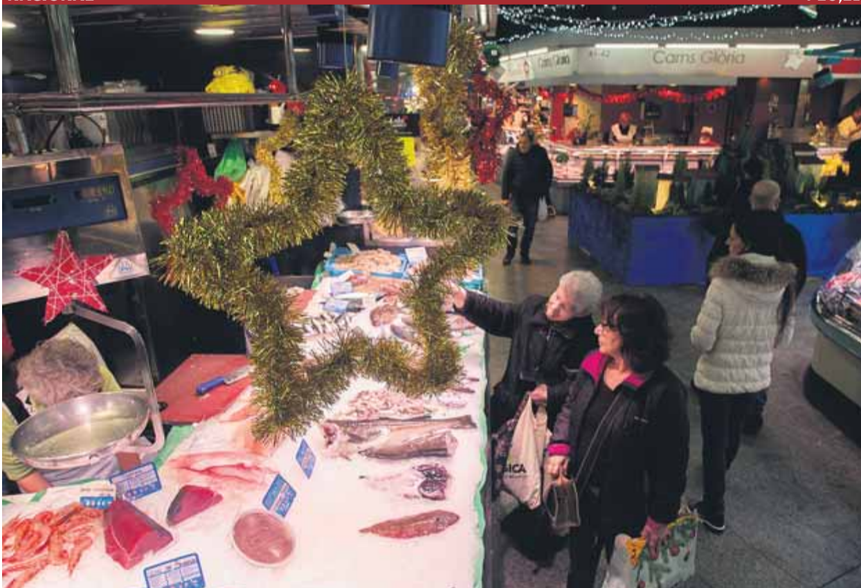
Compres de Nadal al mercat barceloní de Santa Caterina

CONTINGUT • El govern vol parlar dels presos i la consulta en una reunió que veu com una oportunitat per al "diàleg efectiu"