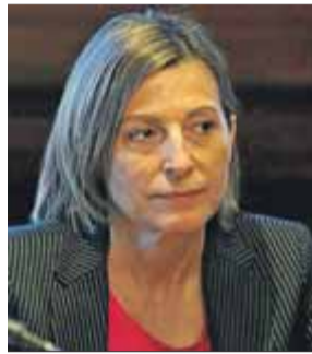
Carme Forcadell i Lluís PRESIDENTA DEL PARLAMENT