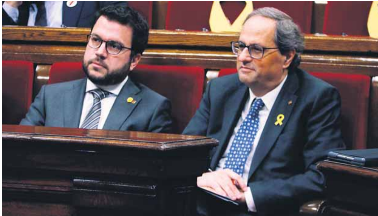
El vicepresident Aragonès i el president Torra, ahir al Parlament

Torra parlava en un to conciliador, el mateix amb què el líder socialista, Miquel Iceta, li havia fins i tot recomanat que “parlin de tot”, i gairebé implorat que aconseguís que la repre-