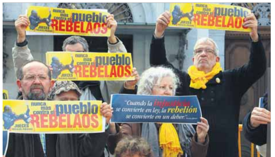
Concentració ahir a les portes del Tribunal Suprem de membres de col·lectiu