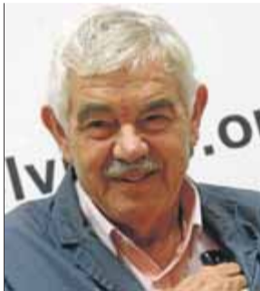
Pasqual Maragall i Mira PRESIDENT DE LA GENERALITAT