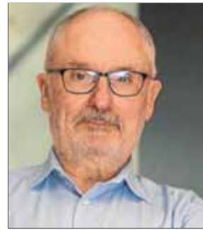
Rafael Ribó SÍNDIC DE GREUGES-