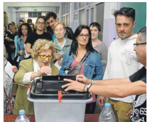
Una dona vota, durant el referèndum de l'1-O, en una escola de Barcelona

En l'escrit, les dues entitats consideren que el govern van causar un “menyscabament” de dos milions a la Generalitat per l'1-O, i també a les arques de l'administració de l'Estat. Recentment, el tribunal va condemnar l'expresident Mas i part del seu govern a pagar cinc milions pel 9-N del 2014. ■