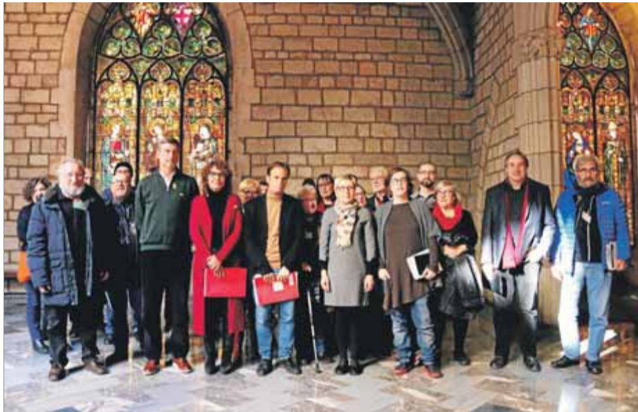
Els grups municipals van anunciar ahir la moció per il·legalitzar la Fundació Francisco Franco, en una trobada amb entitats memorialistes i de drets humans

que van mantenir amb entitats memorialistes i de defensa dels drets humans. Amb aquestes organitzacions es vol constituir “un front antifeixista” davant la possibilitat, apuntada recentment per El Periódico , que la Fundació Francisco Franco s'expandeixi a Catalunya,