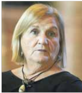
Núria de Gispert i Català PRESIDENTA DEL PARLAMENT