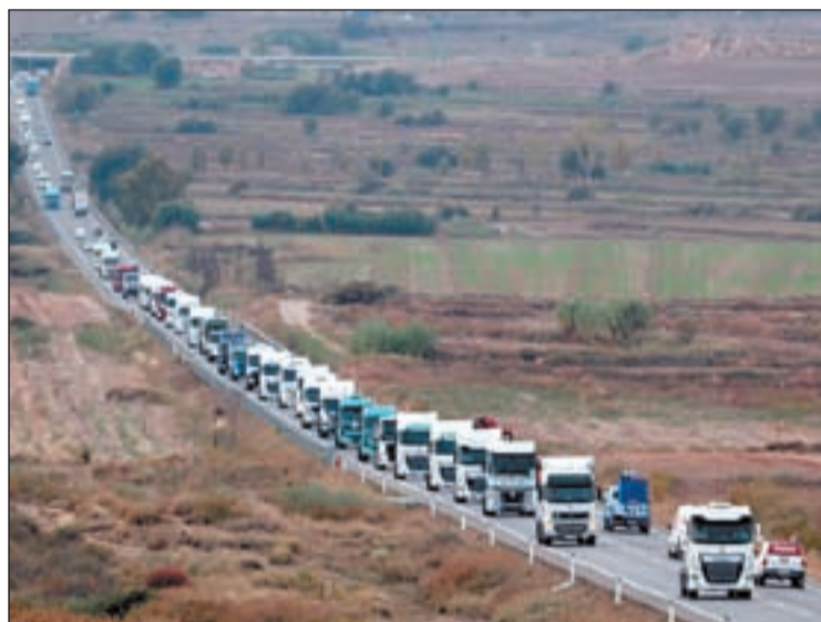
Anterior marxa lenta, celebrada el passat 10 d'octubre

A Lleida, els transportistes han convocat una concentració a les 16.00 a l'aparcament d'Asotrans-Lleida al Polígon Industrial El Segre. Cal remarcar que la convocatòria s'ha hagut d'avançar una hora, perquè des del departament d'Interior els van comunicar que no la podien convocar a les 17.00. Mitja hora més tard començarà una marxa lenta per la LL-11 direcció A-2 en sentit Saragossa, fins a la sortida d'Alpicat. Allà, s'agafarà la sortida de l'A-2 i es tornarà pel mateix recorregut. Des d'AsotransLleida també recomanen que, pels que no puguin arribar a la concentració, redu-