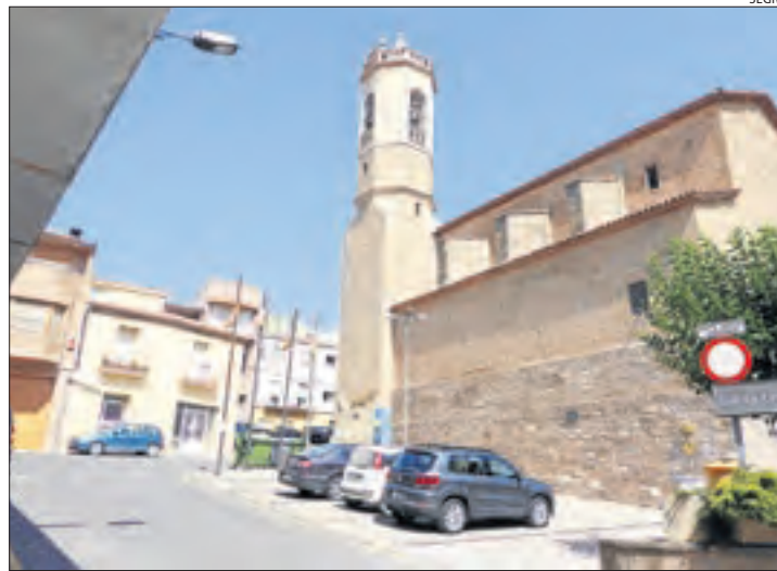
Imatge d'arxiu d'Alpicat.

La normativa estableix que els enregistraments no es poden conservar durant un termini superior a un mes i que s'hi ha de restringir l'accés. En cas de càmeres municipals, com a Alpicat, aquestes només podrien ser visionades per la policia local o, en el seu defecte, els Mossos d'Esquadra.