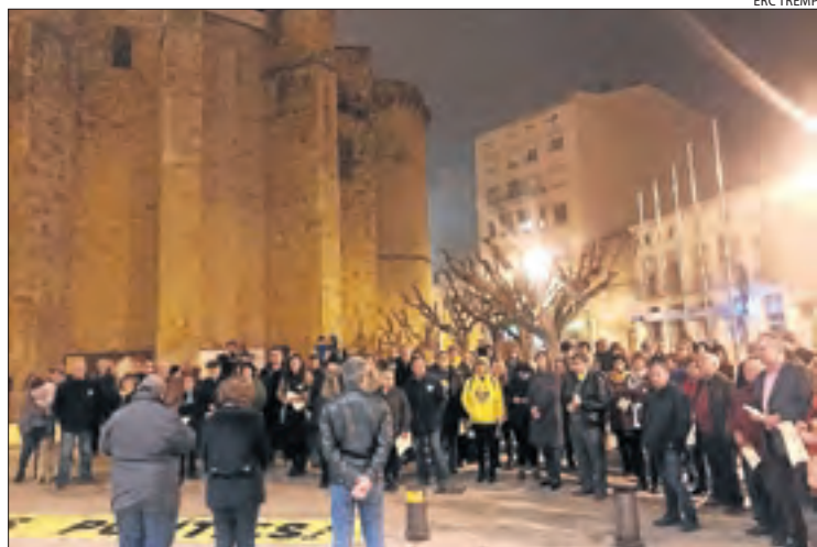
Imatge de la concentració a Tàrrrega.