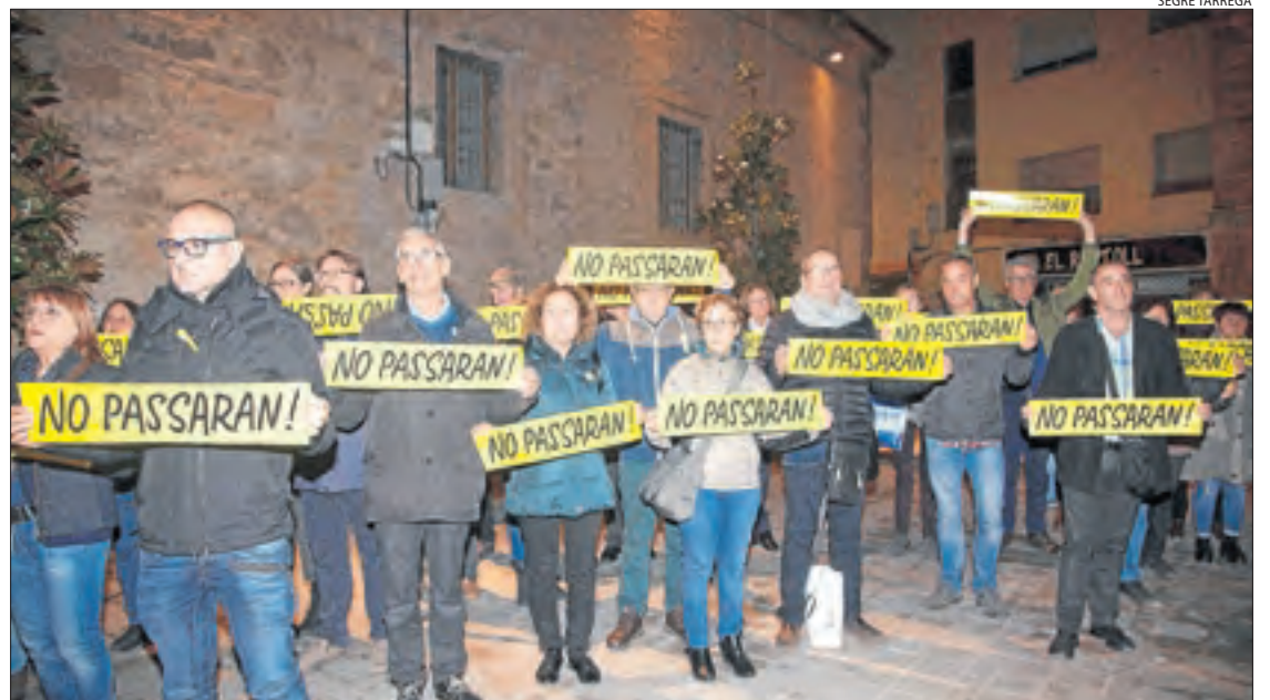
Un centenar de veïns es van manifestar ahir a la plaça dels Àlbers de Tàrrrega.

per demanar-ne la llibertat i també la de la resta de polítics independentistes empresonats i el retorn dels que es troben a l'exili. En l'acte, organitzat per Tàrrrega per la Independència (l'assemblea local de l'ANC), es van llegir cartes escrites per