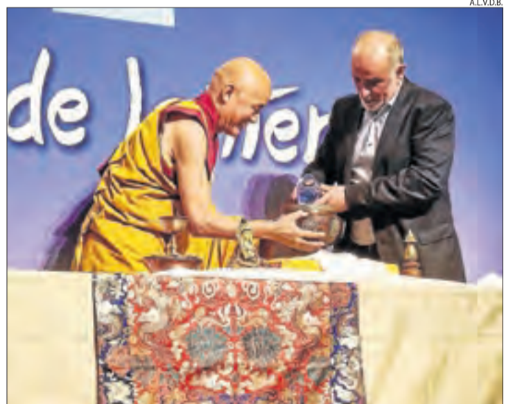
Perelada, en el ritu d'agermanament celebrat a Expotural.