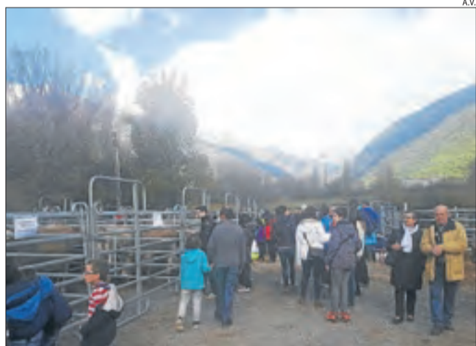
Imatge dels visitants de la fira de Tots Sants de Vilaller.