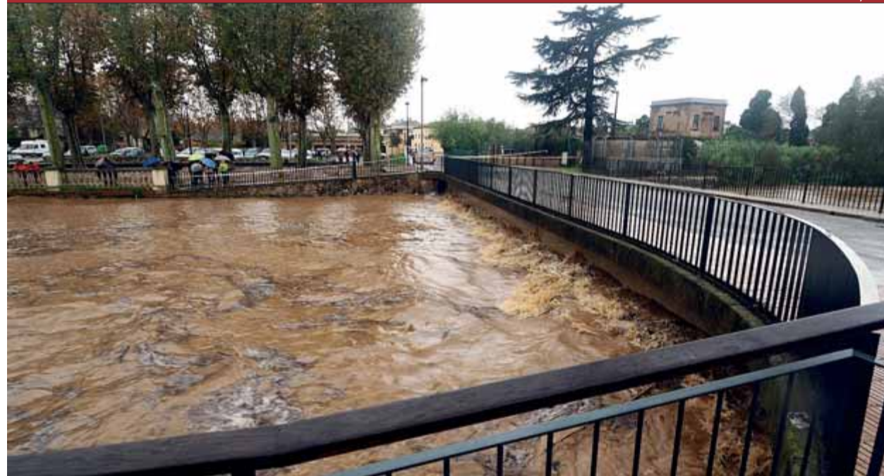
El Daró, al seu pas per la Bisbal d'Empordà, amb el cabal molt crescut per la forta pluja

RESULTAT • “Si es pretenia trobar una solució al conflicte, no es va trobar” PRECEDENT • “Ara es pot aplicar a qualsevol regió o comunitat” FOCUS • “Tenien una obsessió amb la projecció exterior”