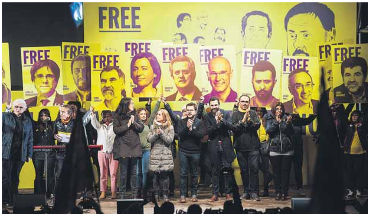
Un acte de suport als presos a l'exterior de la presó de Lledoners