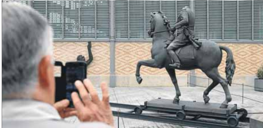
Estàtua decapitada de Franco, en l'exposició feta al Born, l'octubre del 2016

A més de l'atorgada a Franco, el consistori proposa retirar les medalles