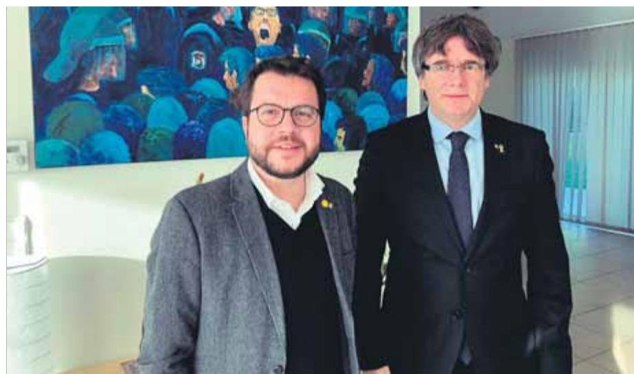
Aragonès i Puigdemont, ahir a la Casa de la República de Waterloo

■ Parlen del judici de l'1-O i de la situació de l'exili, però no de les europees ■ S'insten a seguir treballant "conjuntament"