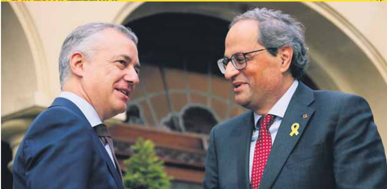
El lehendakari Urkullu i el president Torra, ahir a l'entrada del Palau d'Ajuria Enea

Apunteu-vos a l'acte, que se celebrarà a l'Auditori de Girona el dia 26