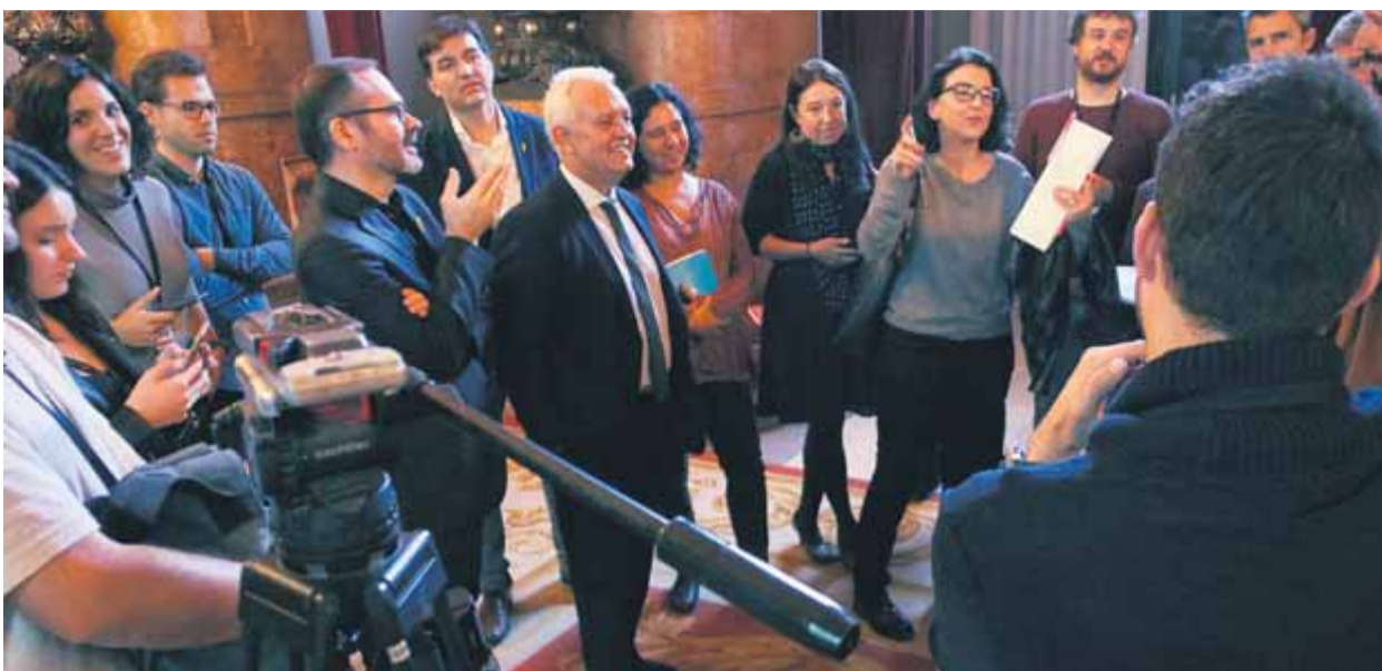
Els diputats participants en la reunió, comentant-la amb els periodistes després de sortir-ne