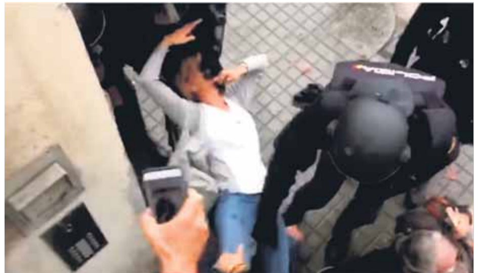
Una dona es agafada per la boca i arrossegada, a l'escola Dolors Montserdà, l'1-O ■

Pel que fa a l'ús excessiu de la força, recollit en molts de vídeos, un inspector, denunciat per set accions violentes, com el cop de puny a a cara, va explicar que usava la tècnica atemi, que en arts marcials consisteix en cops ràpids al