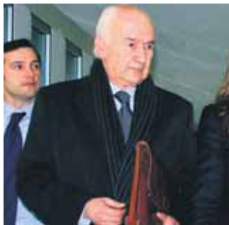
El jutge militar Carlos Rey, acusat de crim de lesa humanitat

L'Ajuntament formalitza l'acusació contra el jutge militar que l'any 1974 va dictar la condemna a mort