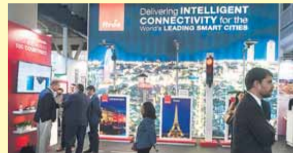
Un dels estands de l'Smart City Expo

OPOSICIÓ • Els unionistes nord-irlandesos creuen que es trencarà el país i els euroescèptics volen tombar el text