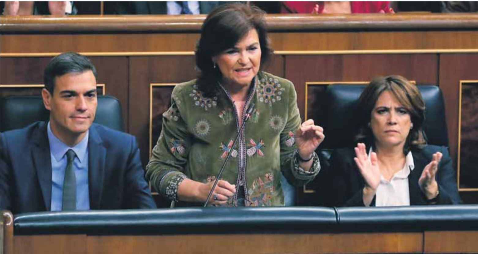
Sánchez, la vicepresidenta Calvo i la ministra Delgado, durant la sessió de control al govern de l'Estat ahir al Congrés