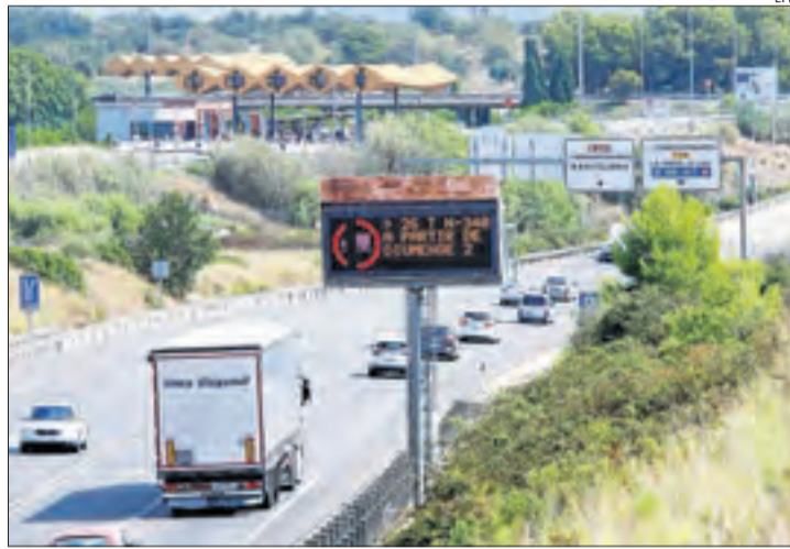
Vehicles en circulació per una autopista catalana.