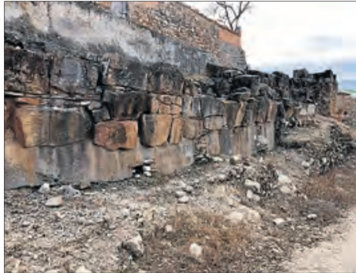
CENTRE D'ESTUDIS D'ISONA I CONCA DELLÀ/FEM POBLE

Entre els anys 1987 i 1994 s'hi van succeir diverses intervencions arqueològiques, encara que gran part de les restes es troben sota les actuals cases i carrers de la localitat, tret d'uns trams de muralles, que estan a la vista.