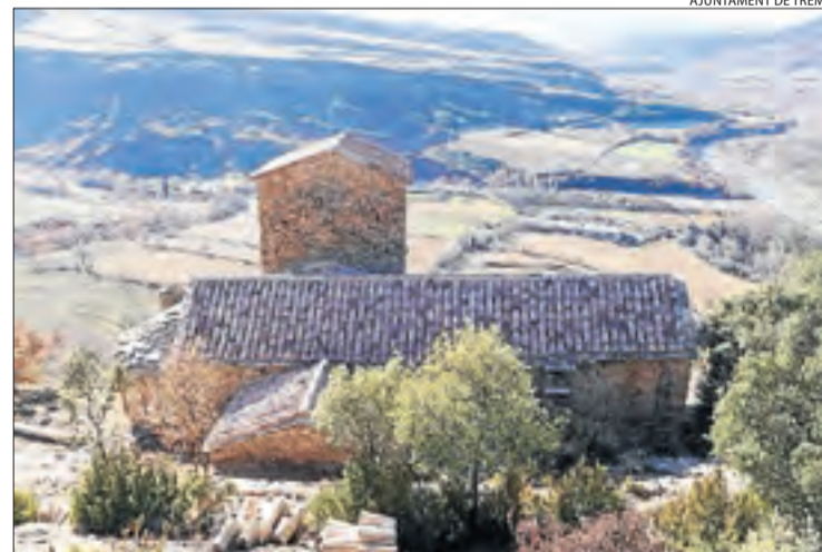
Una vista de l'església de Sant Pere d'Orrit, a la zona de la Terreta.