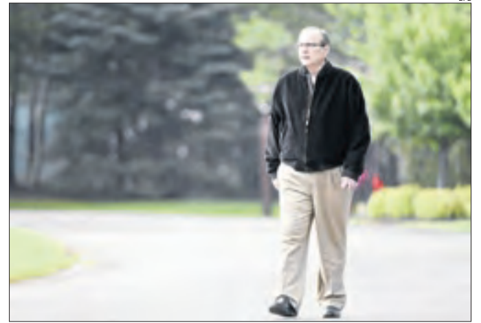
El cofundador de Microsoft, Paul Allen.