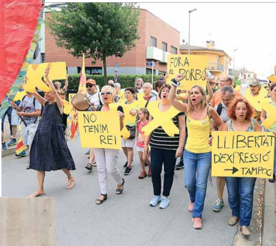
Senyal de "prohibit" amb la imatge del rei que va aparèixer en una rotonda de Banyoles al juny; Felip VI i la reina Letícia, durant una entrega de premis a Vilablareix, al juny, i pancartes dels CDR gironins contra la monarquia