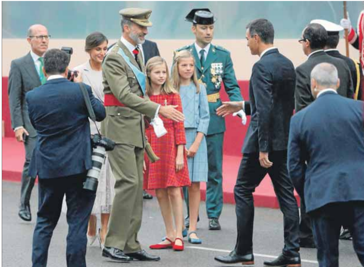
El rei Felip VI saluda Sánchez a l'inici de la parada militar del 12-O en què el president va ser escridassat pel públic

En la seva estrena en una parada militar del 12-O com a president i després de ser xiulat i rebut amb crits d'"okupa" pel públic, Sánchez va celebrar que la situació a Catalunya és "més tranquil·la que fa un any". Segons ell, la crisi catalana és un "de-