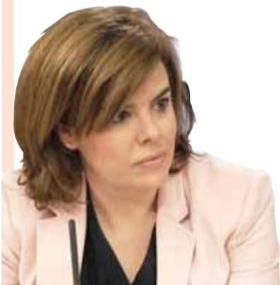
SORAYA SÁENZ DE SANTAMARÍA VICEPRESIDENTA DEL GOVERN ESPANYOL

“S'està perjudicant la marca Catalunya i la marca Barcelona”