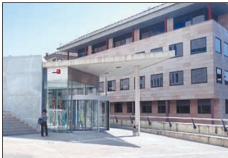
La vista oral s'havia de celebrar a l'Audiència de Lleida

En aquest sentit, la dona va admetre que entre l'1 de gener de 2013 i el 29 de febrer de 2016 es va apropiat de la quantitat de 60.000 euros de les caixes registradores dels dos establiments. En una de les botigues es venia tabac, mentre que el segon era de joguines i altres objectes de regal i d'informàtica, sent ella la