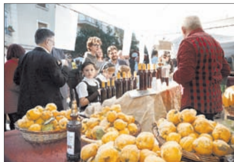
Imatge d'una de les edicions anteriors de la Fira