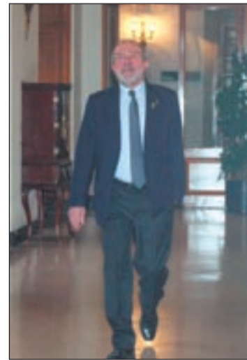
Reñé al Ple d'investidura

Amb aquest gest el que volen evidenciar els membres del PDeCAT és que la formació "no està bloquejada". És més, Solé assegura que "hi ha hagut un canvi d'ac-