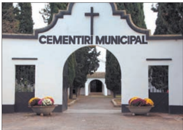
Imatge de l'entrada del cementiri del poble