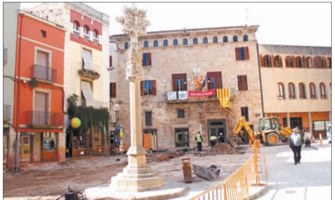
La decisió d'ocultar la inscripció rau del compliment de la llei de Memòria Històrica