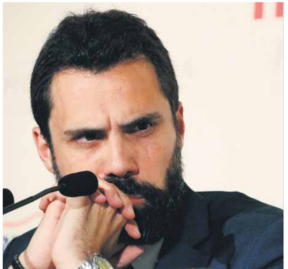
El president del Parlament, Roger Torrent, ahir en l’esmorzar informatiu

D’altra banda, preguntat per si voldria encapçalat la llista d’ERC en l’escenari d’un avançament electoral, va preferir respondre amb evasives i no descartar cap possibilitat. ■