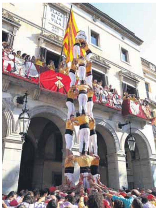
Una actuació dels Bordegassos amb la seva camisa de color groc a Vilanova i la Geltrú ■ ANDREU PUIG

La reacció de l'hospital va ser desmarcar-se d'aquesta decisió i atribuir-la a l'agència DoubleYou, contractada per dur tota la campanya amb la qual han de recaptar més de 14 milions per construir el centre d'oncologia pediàtrica més gran d'Europa. Fonts del centre van dir ahir que els havien comentat que