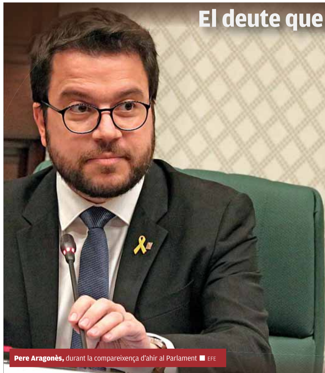
Pere Aragonès, durant la compareixença d'ahir al Parlament