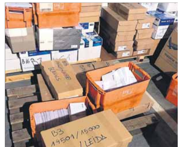
Certificats de l'1-0 comissats per la Guàrdia Civil, a la seu d'Unipost a Manresa

D'una altra banda, la fiscal ha demanat al jutge que Hisenda faci un informe detallat de les suposades partides gastades pel referèndum i també que s'elabori un estudi sobre els costos de la cessió de locals públics per a l'1-O. ■