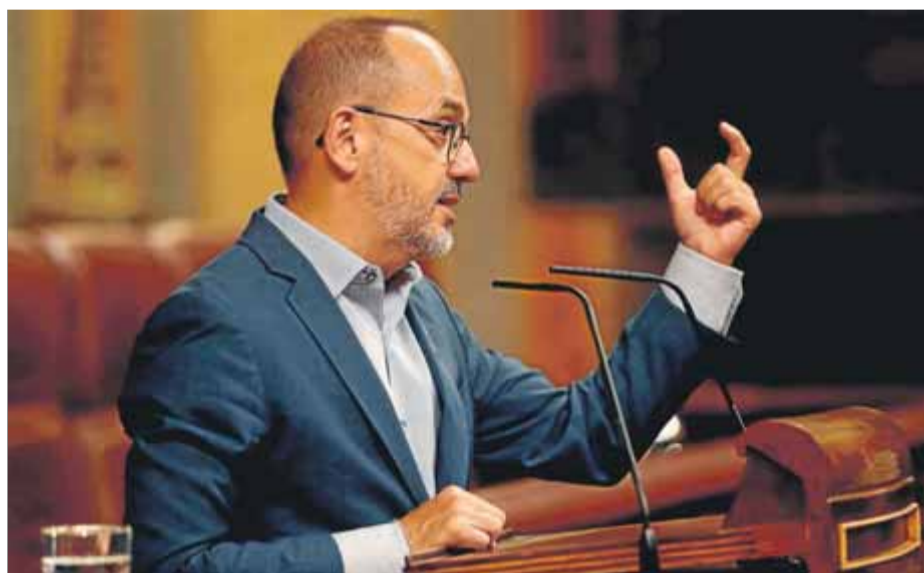
Carles Campuzano, ahir al Congrés

“El meu càrrec de portaveu sempre està a disposició del president del partit”, hi va afegir. La seva companya de files a Madrid Míriam Nogueras, vi-