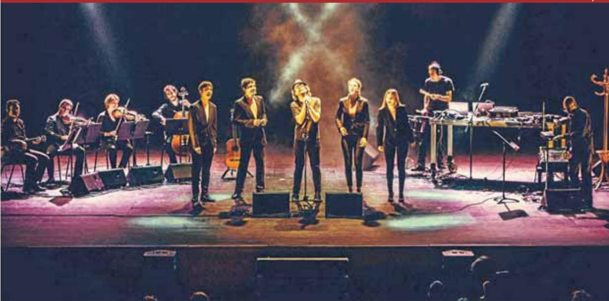
Quartet Brossa, Pinker Tones i el Quartet Mèlt, en l'estrena de 'Léon', ahir al Mercat de Música Viva