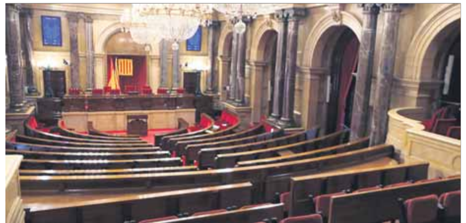
Hemicicle del Parlament on el dia 3 d'octubre se celebrarà el debat de política general