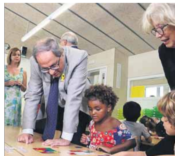
Torra i l'exconsellera d'Ensenyament Irene Rigau, parlant ahir amb infants de l'escola El Far, de Calella

Durant el seu discurs d'ahir, la portaveu del gabinet de Torra va apel·lar també "als demòcrates espanyols", dels quals va assegurar que en aquests darrers temps: "Hem trobat a faltar el seu alè i suport, perquè això va de democràcia i de drets." De fet, aquest va ser un dels arguments que va centrar la glosa de la Diada que es va encarregar a la periodista Pilar Rahola, la qual havia emfasitzat: "Ens sentim orfes de la massa crítica espanyola." El delegat de la Generalitat a Madrid, Ferran Mascarell, també repassava un any complex durant el qual va arribar a ser destituït arran de l'aplicació del 155. De fet, fa pocs mesos que ha tornat a ocupar el càrrec.