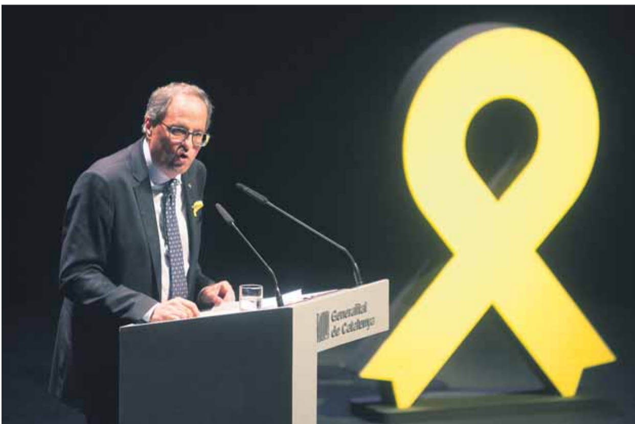
El president Quim Torra, durant el seu discurs d’ahir al Teatre Nacional

“ CONSENSOS Hi ha tres grans consensos a Catalunya: referèndum, antirepressió i republicanisme