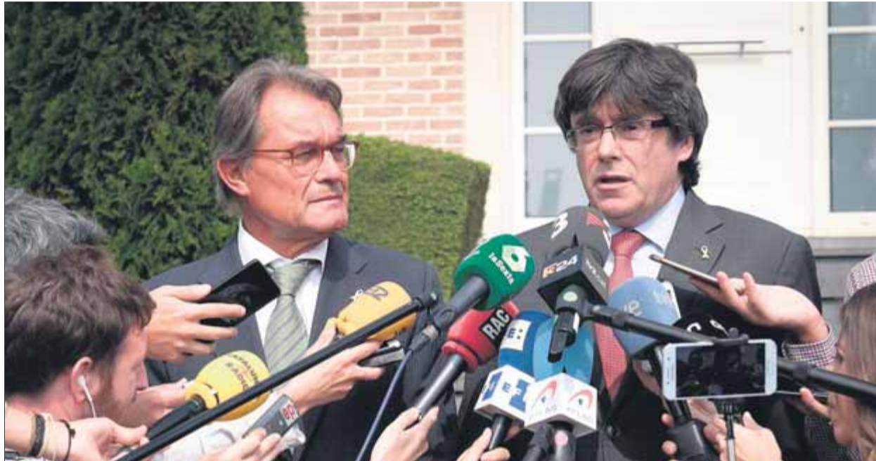
Els presidents Mas i Puigdemont, en la compareixença posterior a la seva reunió

Amb vista als pròxims mesos que s'esperen intensos no només per les converses entre la Gene-