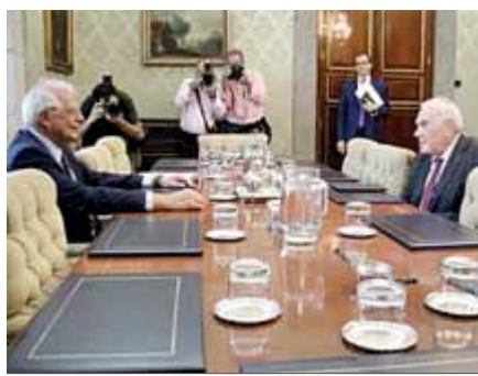
Borrell i Maragall, en la reunió d'ahir

Maragall i Batet ho acorden i Borrell es compromet a "respectar" l'acció exterior