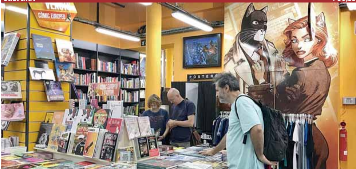
Interior de la botiga barcelonina Norma Comics, que ha rebut el guardó, una espècie d'Oscar dels còmics