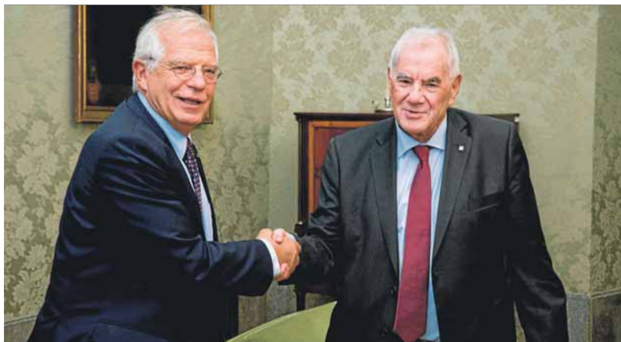
El ministre Borrell (Afers Exteriors) saluda el conseller Maragall ahir al Palau de Santa Cruz a Madrid