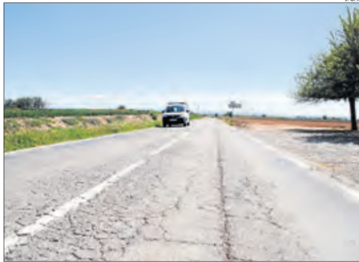
L'estat actual de la via és molt insegur i ple de clots.

Les obres de millora de la via es van adjudicar el mes d'octubre passat per 4,3 milions d'euros. Els treballs contemplen eixamplar la calçada fins als deu metres en un tram de quatre quilòmetres, modificar el traçat actual per suavitzar revolts i rasants, així com re-