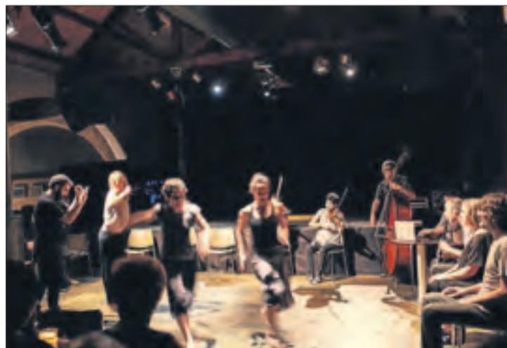
Imatge d'un espectacle anterior del Col·lectiu Free't.