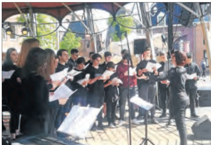
Una de les actuacions que van tenir lloc a Holanda.