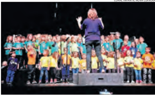
CORAL INFANTIL NOVA CERVERA