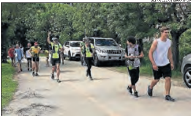
ULTRA CLEAN MARATHON

Els cantaires Barrufets i Petits de la Coral Infantil Nova Cervera van participar diumenge en la celebració de la trobada Juguem Cantant , organitzada pel Secretariat de Corals Infantils de Catalunya a Castellar del Vallès.