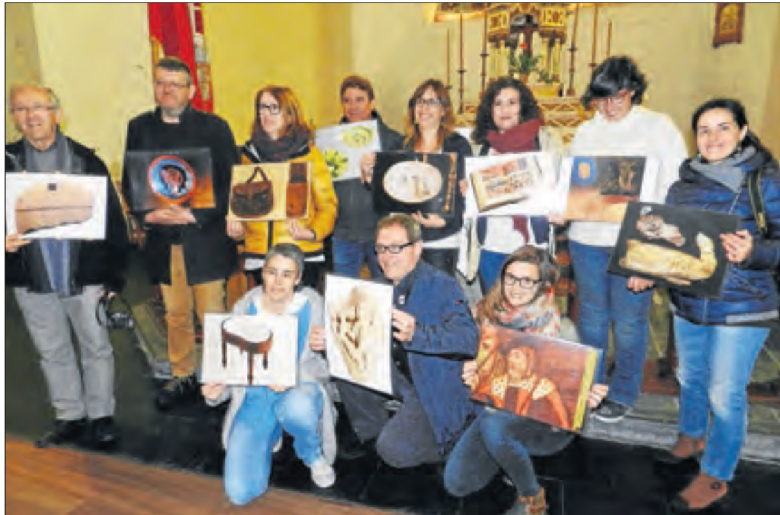
Directors i responsables de museus de la Xarxa, amb imatges d'algunes de les seues peces.