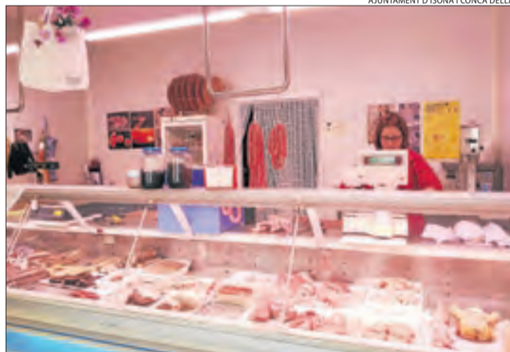
Imatge de la carnisseria d'Isona i Conca Dellà.