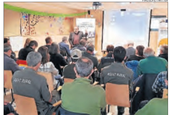
Presentació del programa Piroslife ahir a Llavorsí.

LLEIDA | Ramaders i ajuntaments fan un balanç crític del programa Piroslife, al considerar que el projecte finançat per la UE per reforçar la presència de l'ós al Pirineu i millorar la seua coexistència amb l'activitat humana no ha portat beneficis. Així ho van expressar ahir edils i representants del sector a Llavorsí, en una jornada sobre el Piroslife l'últim any en què la Generalitat rebrà fons comunitaris per a la gestió de l'ós.