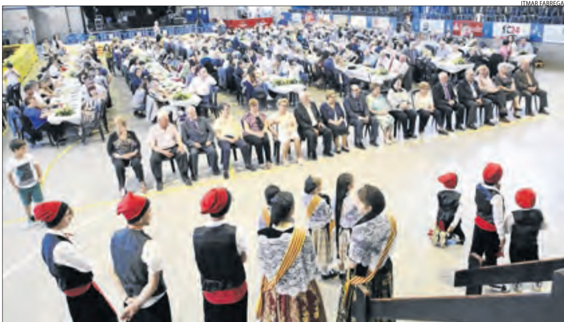
Un moment de l'entrega de plaques commemoratives.