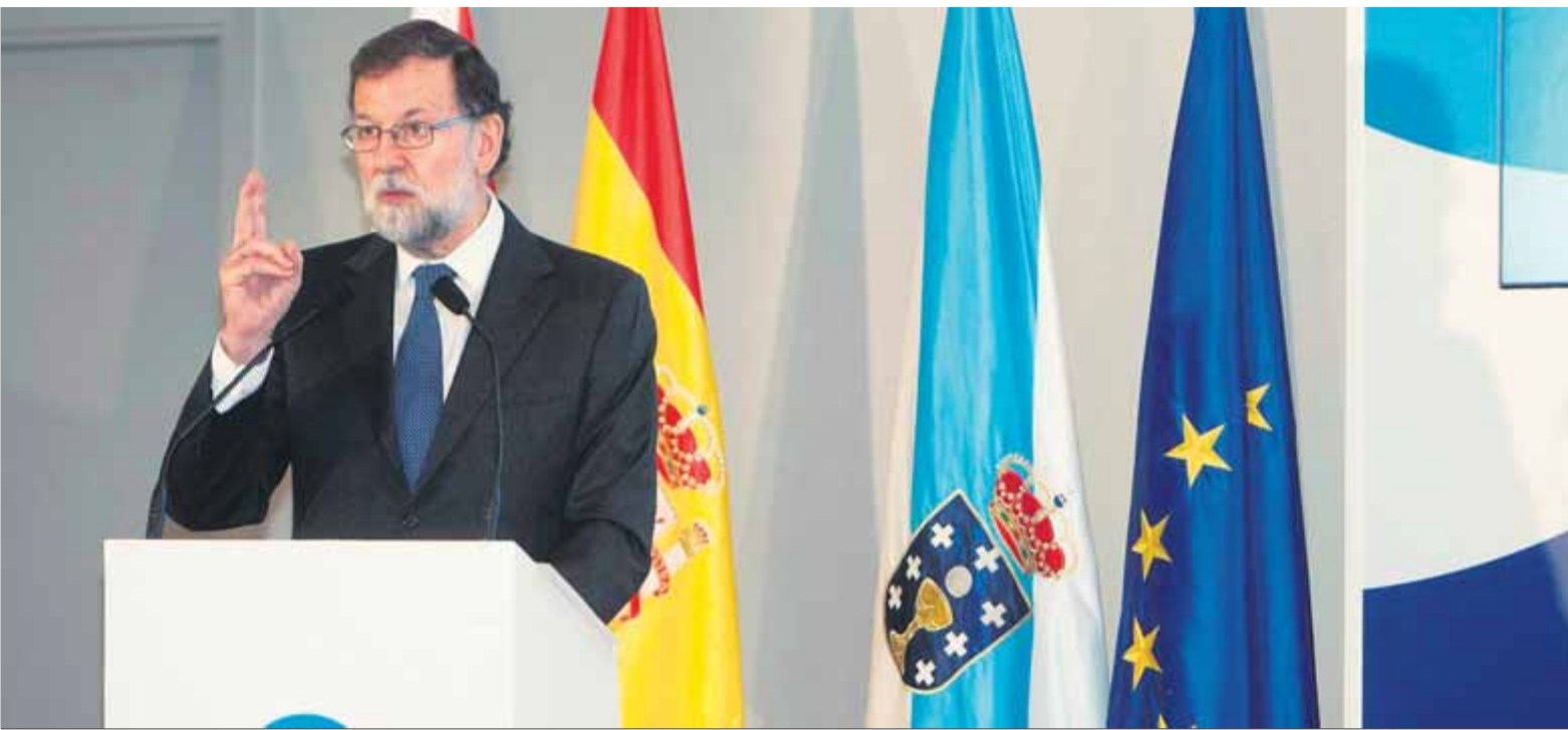
El president del govern espanyol, Mariano Rajoy, ahir, durant un acte amb empresaris a Vigo