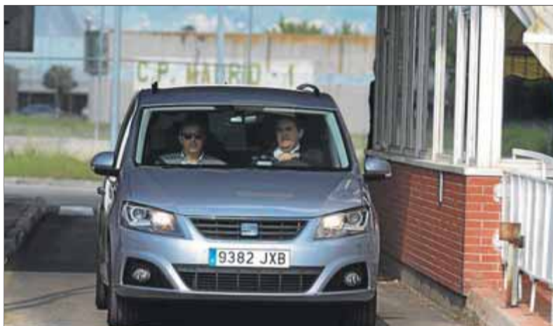
El cotxe del president del Parlament surt de la presó d'Alcalá-Meco després de visitar l'expresidenta Carme Forcadell i l'exconsellera Dolors Bassa