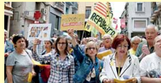
Concentració ahir a la Paeria de Lleida ■ ACN