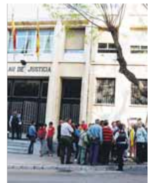
Els concentrats fora dels jutjats de Tarragona

Es parla d'internacionalització del procés català. Algunes coses poden quedar clares per a la justícia europea, però les que he mencionat no poden servir mai com a argument de defensa, perquè no es pot demostrar la relació directa entre les intencions polítiques i unes activitats que difícilment es poden presentar com a sancions.