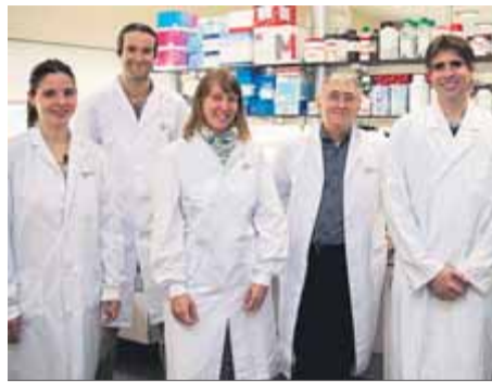
L'equip de la investigació ■ IDIBAP

Investigadors catalans n'ofereixen per primer cop un mapa en gran resolució