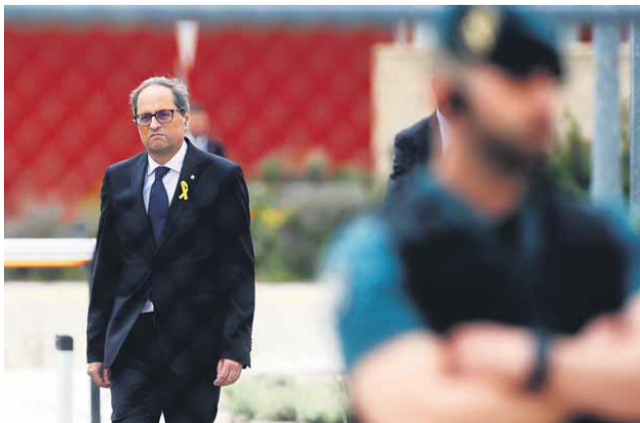
El president, Quim Torra, en un dels accessos a la presó madrilenya d'Estremera

REINCIDENT • Torna a reclamar a Rajoy l'inici de converses per solucionar el problema polític amb diàleg