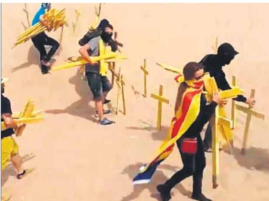
Alguns dels ultres duïen estelades per crear confusió entre els veïns