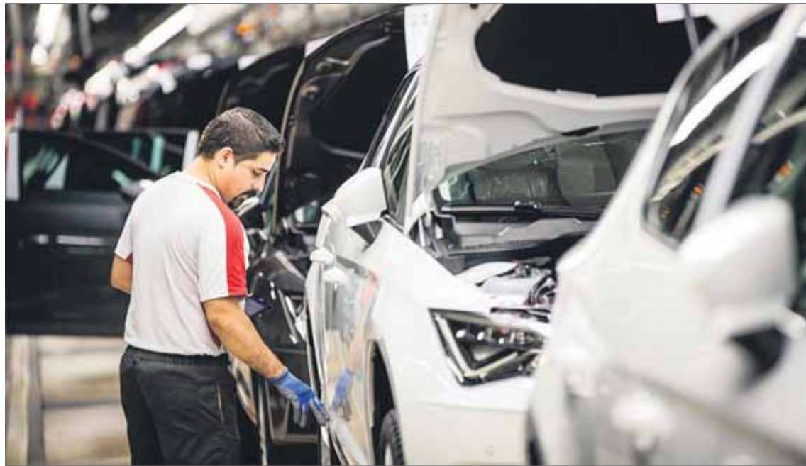
L'empresa Seat és la que té més treballadors de Catalunya ■ EVA GARCIA

2. Un segon element és el retard en els pagaments, que pot oscil·lar entre uns dies i uns anys. La burocràcia de l'Estat és lenta per naturalesa. Si és lenta de forma natural, es pot incrementar la lentitud, sense grans esforços. Les persones encarregades de tirar endavant els expedients han pres vacances per visitar les piràmides d'Egipte o les meravelles del parc de Yellowstone als Estats Units. Si