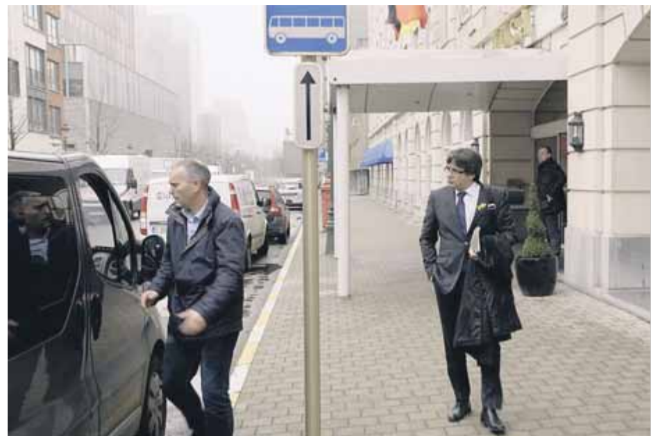
Carles Puigdemont en una imatge del documental, que s’estrenarà a la tardor

El documental se centrarà en les eleccions del 21 de desembre: les circumstàncies que hi van portar, la campanya electoral i el que ha passat després. Culminarà amb la presa de possessió del càrrec del president, Quim Torra,