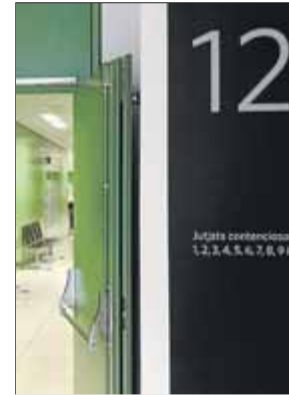
Entrada dels jutjats contenciosos a Barcelona ■

El Consell General del Poder Judicial (CGPJ) as-