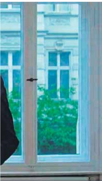
le Quim Torra