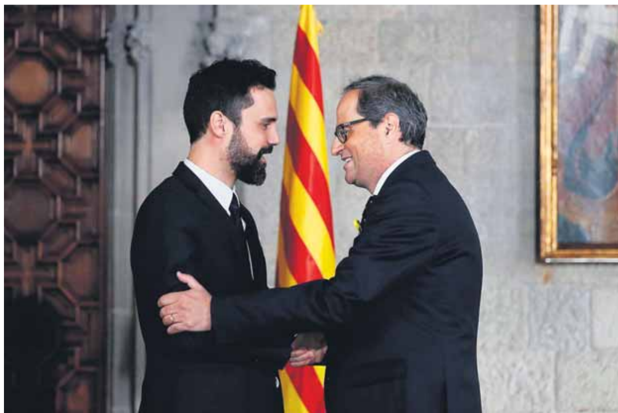
El president del Parlament, Roger Torrent, felicita el de la Generalitat, Quim Torra, després de la cerimònia

155 • El PSOE demana que es reguli per llei la presa de possessió, el PP la critica i Cs insisteix a endurir la intervenció