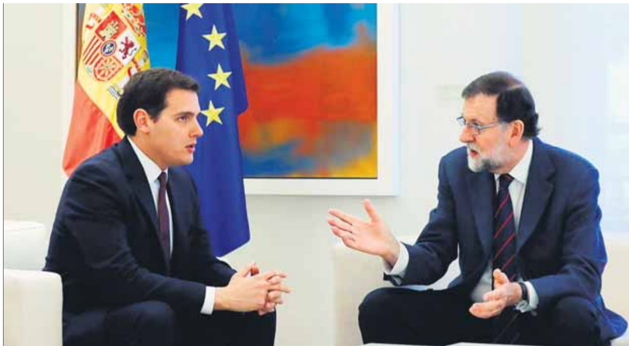
Rajoy i Rivera es van reunir durant una hora a La Moncloa per abordar la nova situació a Catalunya

Amb la displicència de no sortir a l'escalinata de La Moncloa a saludar-lo –sí que ho va fer amb Sánchez–, Rajoy va rebre ahir durant una hora un Rivera erigit en guardià de la severitat amb Catalunya que busca l'opa a l'electorat del PP. En la croada per imposar un 155 extrem "imme-