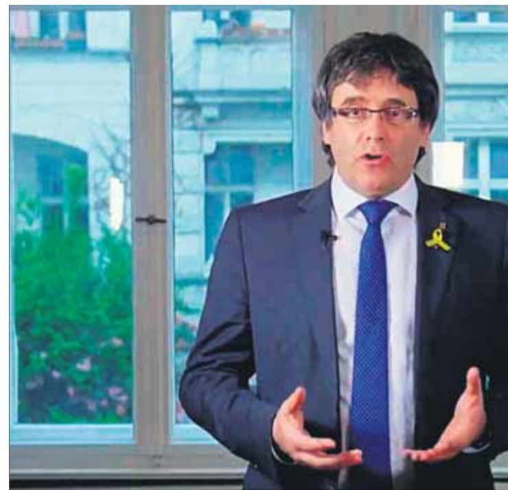
Carles Puigdemont durant l'anunci, el dia 10 passat, de la candidatura

L'argument de Bèlgica per no entrar ni tan sols a analitzar el fons de la petició de Llarena pels delictes de rebel·lió i malbaratament de diner públic és que prèviament s'havia d'haver dictat una ordre de detenció en territori espanyol —l'anterior havia decaïgut quan va retirar l'euroordre de l'Audiència Nacional— i aquesta és una