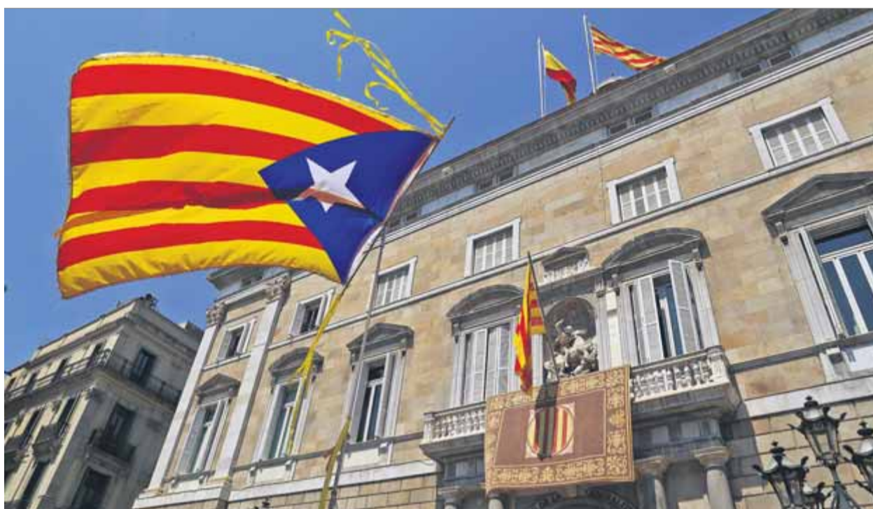
Una estelada a peu de carrer voleiant en sentit contrari al de la senyera i la bandera espanyola del Palau

El so de les 49 campanes de bronze del carilló del Palau de la Generalitat entonant el Cant de la senyera i Els segadors va anunciar ahir la recuperació de la institució usurpada pel 155. Campanades que expulsaven el fantasma de l'ocupació de les parets nobles de l'edifici.