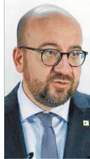
Charles Michel, primer ministre belga

Les mirades dels sectors més conservadors, doncs, apunten cap a Bèlgica i ahir el primer ministre belga, Charles Michel, va reiterar que "la justícia