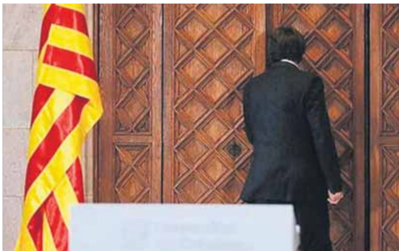
Imatge que Puigdemont va penjar ahir a Instagram