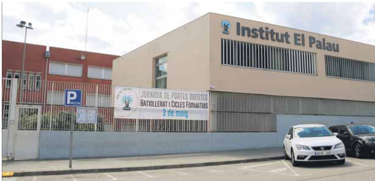
L'institut El Palau de Sant Andreu de la Barca té nou professors acusats de delictes d'odi ■ JUANMA RAMOS

La plataforma Somescola, que aplega 54 entitats en defensa de l'escola catalana, va denunciar els "atacs infundats contra docents per la via penal", com és el cas dels nou professors de l'institut El Palau de Sant Andreu de la Barca, que considera que