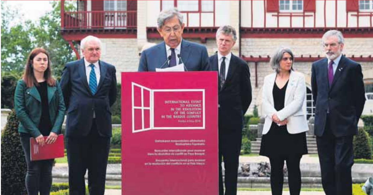
El mexicà Cuauhtémoc Cárdenas, amb altres personalitats internacionals, ahir a Kanbo