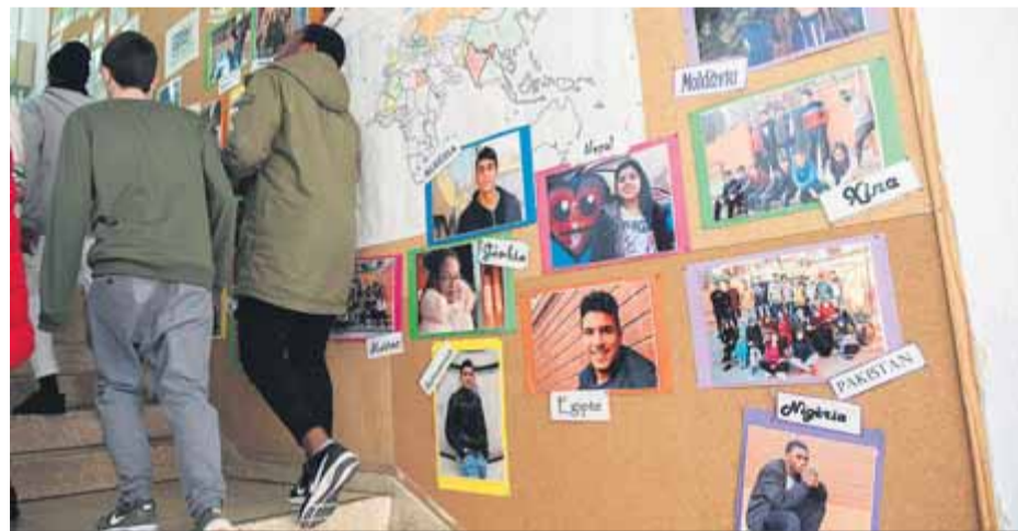
Els mestres de primària faran classe als instituts el curs vinent ■ JOSEP LOSADA

La mesura ha provocat la indignació de professors de secundària, especialment interins, que van expressar el seu malestar a les xarxes socials i han fet una recollida de firmes a la plataforma Change.org en la qual qualifiquen les mesures de "pedaços per no solucionar l'arrel del problema de la manca de docents d'aquestes especialitats". Els professors assenyalen que aquest fet, que "desplaça els interins d'aquestes especialitats, no és una mesura justa" i demanen a Ensenyament que "doni preferència en les adjudicacions d'estiu i