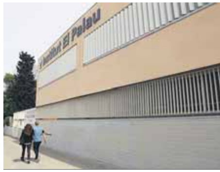
L'institut El Palau ■ J. RAMOS

Mestres, famílies, sindicats i entitats denuncien una campanya contra l'escola