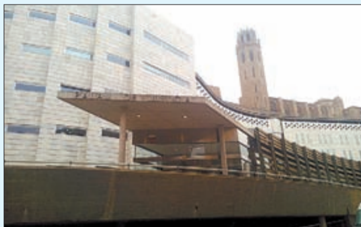
El judici es va celebrar el 25 d'abril a Lleida

Durant la vista oral, l'home va admetre que havia anat amb la nena i el germà d'aquesta a una zona apartada del parc i que, quan el nen ja no hi era, la menor es va baixar els pantalons i la roba interior, però va negar que la violés. Tot i això, la Sala considera provat que durant diversos dies d'aquell mes de juliol, l'home havia anat en reiterades