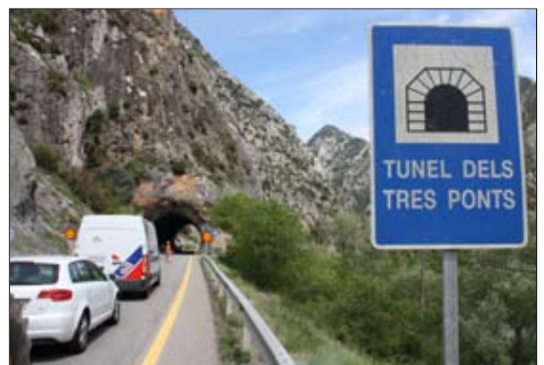
Les voladures van obligar a aturar el trànsit

Les voladures de prova que s'han dut a terme ahir dijous al congost de Trespunts, a les proximitats de la futura boca sud del túnel que s'excavarà en aquesta zona, es van realitzar sense incidents i amb un resultat satisfactori, segons van informar fonts del departament de Territori i Sostenibilitat, encarregat d'executar les obres. Tot i que estava previst que l'actuació comportés talls intermitents, de cinc o deu minuts, de la carretera C-14 entre les 14 i les 15 hores, finalment es va optar per fer una única restricció en els dos sentits de la marxa