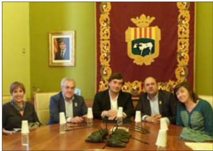
La iniciativa es va presentar ahir a les Borges