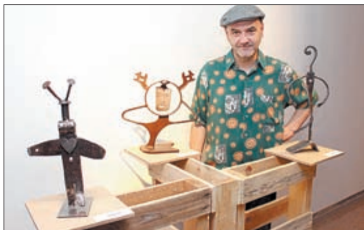
L'escultor de Tàrraga amb algunes de les seves obres

L'artista va obrir l'exposició acompanyat de l'alcalde Rosa