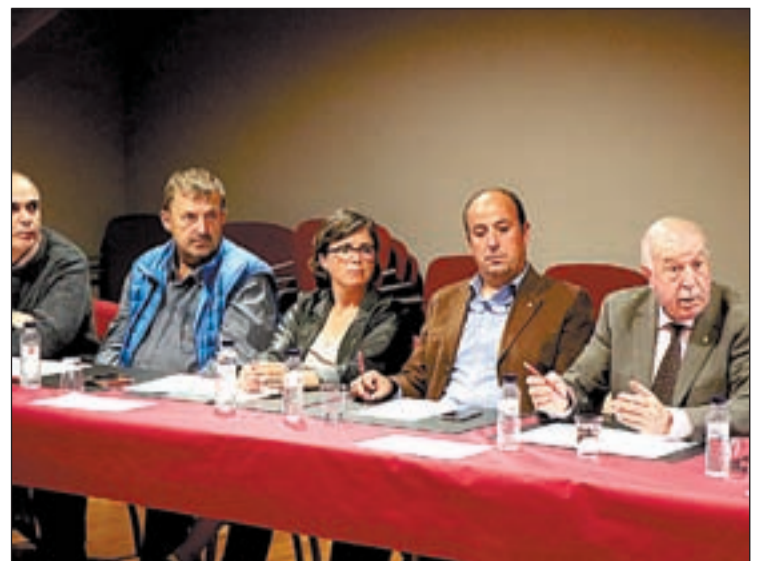
L'Aran va celebrar ahir un Consell d'Alcaldes