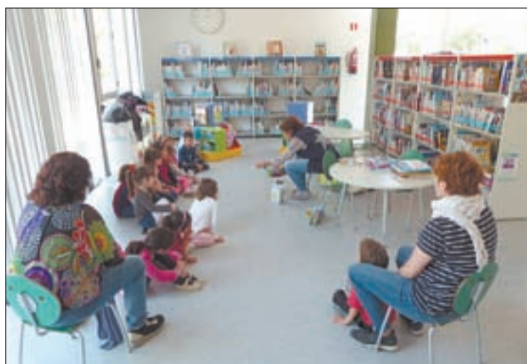
Un grup d'escolars en una activitat a la biblioteca

Les obres de millora van començar al gener amb una retirada prèvia de 2.000 documents descatalogats. Seguidament, amb l'inici dels treballs, es van