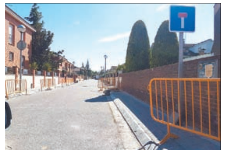
Un dels carrers on s'estan reparant les voreres

Bellpuig repassa les voreres de diferents carrers de la població per deixar-les en bones condicions. L'actuació consisteix en canviar els panots malmesos i/o aixecats i en reparar-ne l'encintat d'algunes. Les obres tenen subvenció de la Diputació de Lleida de 40.000€ i les realitza l'empresa SEIM SLU. per 45.000€.