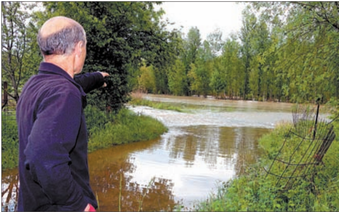
El riu va anegar ahir camps de conreu a la Guàrdia de Noguera