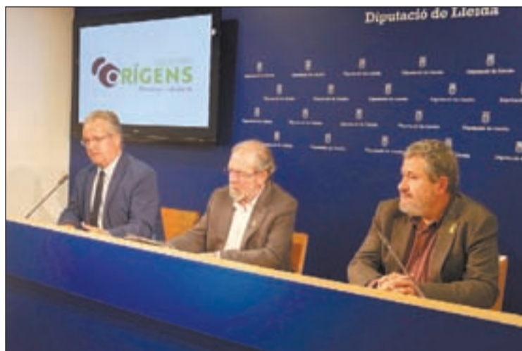
Les autoritats presentant la nova marca

Es vol posar èmfasi, d'aquesta manera, en els orígens i en els diferents estadis de la formació dels Pirineus i, a la vegada, s'ha cercat una denominació que aixoplugés els 19 municipis lleidatans que integren el Geoparc, repartits entre quatre comarques. La nova marca s'acompanya d'un logotip amb la imatge d'una petjada de dinosaure, en concret d'un titanosaure, i de la lletra O, per reforçar així el terme i el concepte orígens . D'altra banda, des del Geoparc es fixen com a objectiu poder aconseguir en els pròxims anys més finançament per poder tirar les diferents accions previstes i poder revalidar d'aquí a quatre anys aquest segell de la