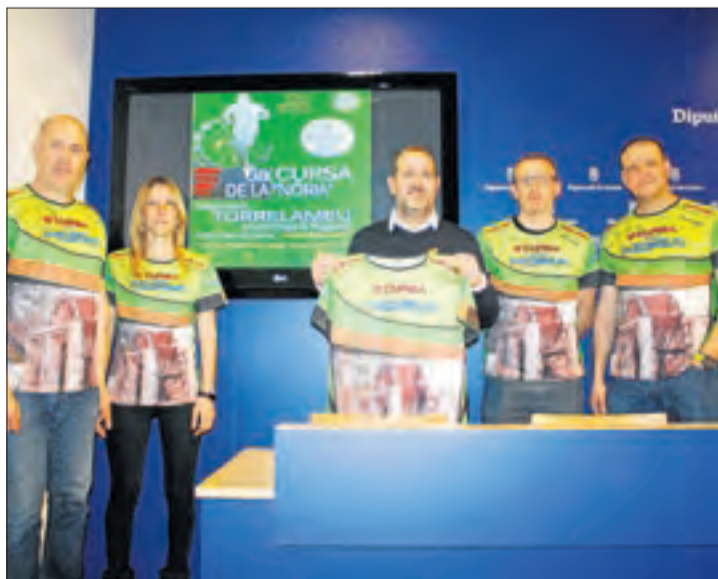
La prova es va presentar ahir a la Diputació.

A més, la jornada també tindrà el seu vessant solidari, atès