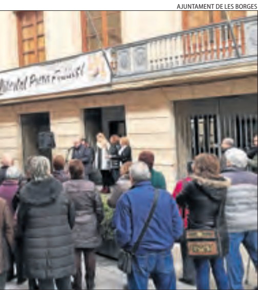
AJUNTAMENT DE LES BORGES