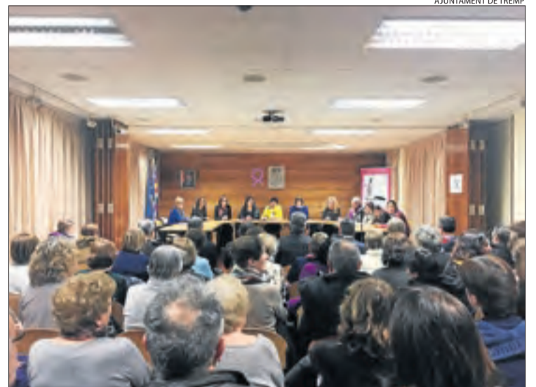
AJUNTAMENT DE TREMP