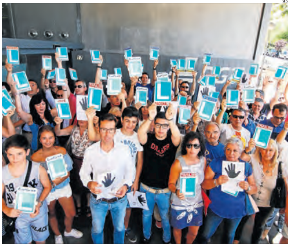
Imatge feta a l'estiu d'una protesta de professors d'autoescoles de Ponent davant la DGT.

dria agreujar-se a Lleida, atès que està previst que properament la província perdi un dels sis examinadors amb què compta actualment.