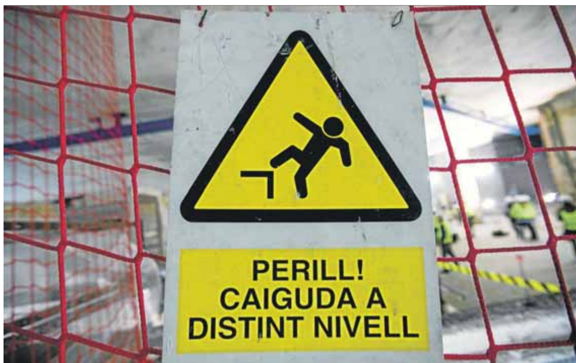
Cartell que recomana precaució en les obres d'una infraestructura

El govern de M. Rajoy, com diuen els humoristes de les cadenes de la Generalitat, no intervingudes, ha fet que passem d'una preindependència a una preautonomia. Sobretot si tenim en compte que ha decapitat l'estructura de la Generalitat amb l'acomodament de 260 funcionaris, als quals podríem afegir els 130 investigats i els que estan a la presó. Tot gràcies a l'article 155 de la Constitució Espanyola, que es proposa humiliar i sancionar econòmicament Catalunya i els catalans