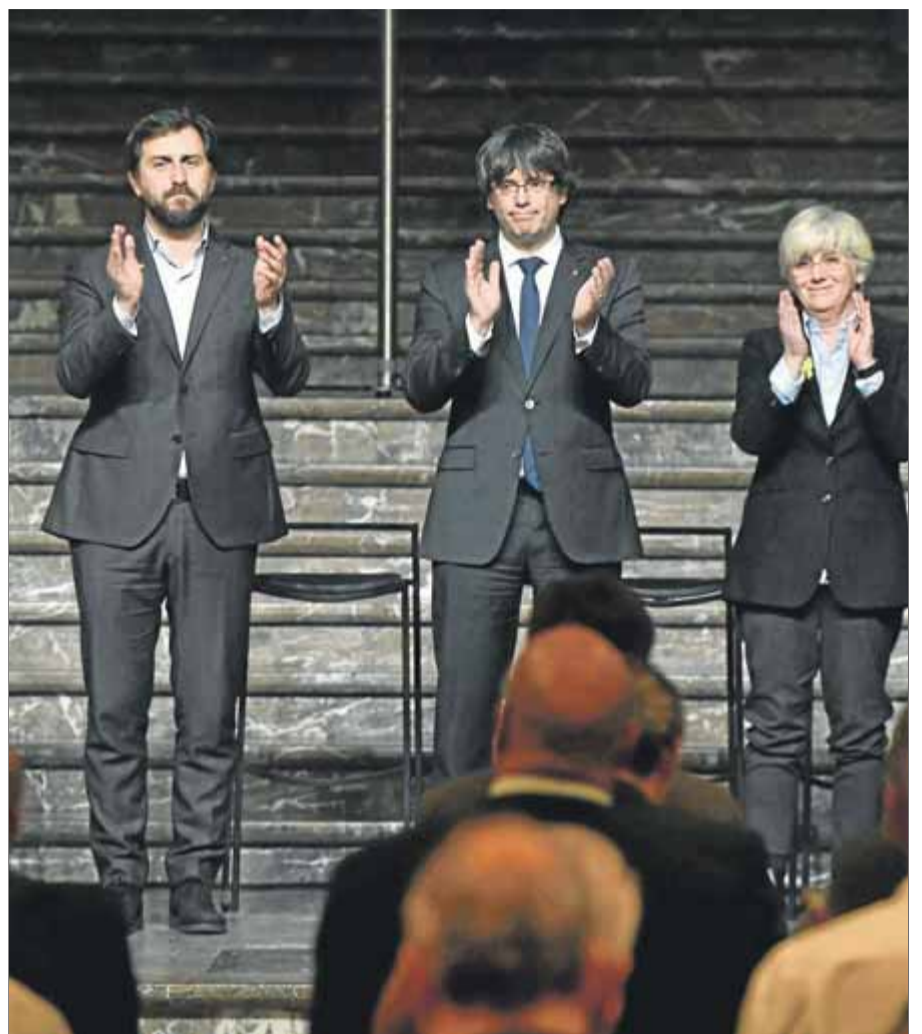
Els manifestants que van anar a Brussel·les el mes de desembre van reclamar que Europa escolti les seves reivindicacions. Al costat, Comín, Puigdemont i Ponsatí

queixes sí que han anat arribant clares i meridianes a les altes instàncies de la UE. Ara, falta que reaccionin. Per exemple, el Col·lectiu Praga, una entitat impulsada l'any 2013 per una quarantena de catedràtics i professors de dret per contribuir amb arguments jurídics al debat sobre l'exercici del dret a decidir a Catalunya, va enviar un informe al comissari de Drets Humans del Consell d'Europa, Nils Muiznieks, denunciant la vulneració de drets a Catalunya per part de l'Estat després de l'1 d'octubre.