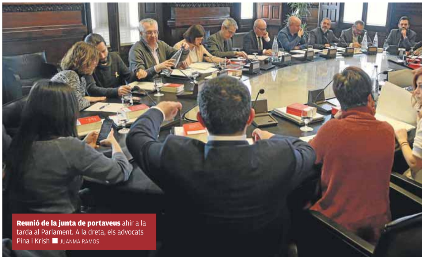
Reunió de la junta de portaveus ahir a la tarda al Parlament. A la dreta, els advocats Pina i Krish

En concret, els independentistes apelen a l'article 25 del Pacte Internacional dels Drets Civils i Polítics i recorden que el Comitè de Drets Humans de l'ONU va instar Espanya a complir les mesures cautelars perquè l'expresident de l'ANC no en perdi cap mentre avalua una demanda presentada per la seva defensa, amb el convenciment que aquests criteris es poden estendre a tots aquells que es troben en la mateixa situació. En el cas de Sánchez, la majoria independentista també portarà el Parla-