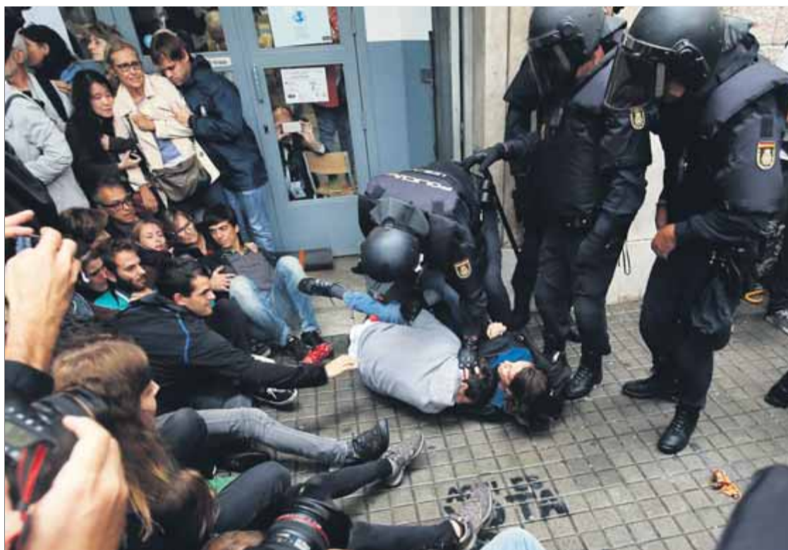
Les càrregues de la policia espanyola l'1-O han estat denunciades davant instàncies internacionals

Tant els diferents relators de les Nacions Unides i l'Alt Comissionat, com el comissari de Drets Humans del Consell d'Europa són figures internacionals cabdals en aquella protecció dels drets i llibertats. No són tribunals que dictin sentències, però sí organismes que emeten informes amb impacte mundial, en els quals es destapen pràctiques sistemàtiques de violacions de drets que els tribunals interns, no separats dels respectius poders executius (especialment, les cúpules del