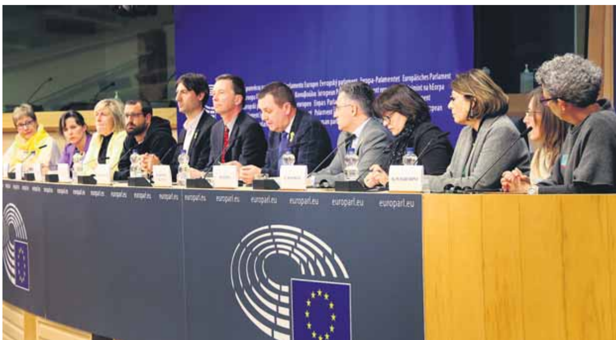
Familiars de polítics presos i exiliats, ahir en roda de premsa juntament amb eurodiputats a Brussel·les