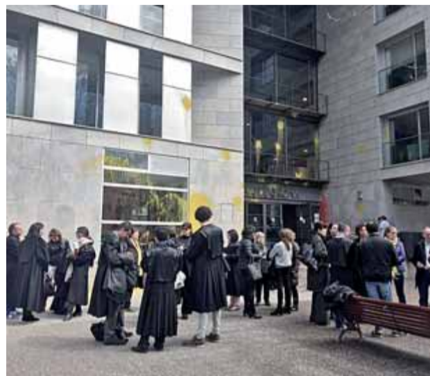
La protesta a la Ciutat de la Justícia i, a la dreta, la concentració a les portes dels jutjats de l'avinguda Ramon Folch de Girona ■ ACN / G. PLADEVAYA