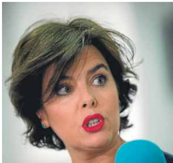
Sáenz de Santamaría, atenent la premsa

litzarà l'escenari que s'obre amb Puigdemont a la presó de Neumünster en la reunió extraordinària que farà avui el Consell de Ministres per aprovar els pressupostos del present 2018. Però la seva mà dreta i vicepresidenta espa-